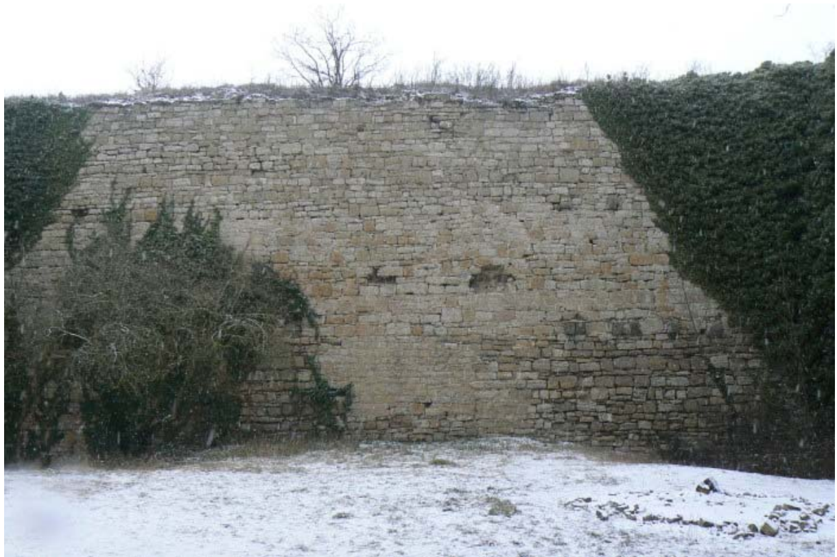
Nordmauer vom Hof aus gesehen

In dem kleinen Weiler befindet sich noch ein altes Herrenhaus und eine Kelter. Dieser vermutliche Wirtschaftshof der ehemaligen Burg befindet sich nördlich der ca. 20 auf 20 Meter messenden Kernburg. Bemerkenswert an diesem Mauergeviert (wie eine Kastellburg erbaut) ist die Mächtigkeit der Kernburgmauer, welche sich schildmauerartig 2 verstärkt gegen die gefährdete Nord- und Ostseite richtet und deren mächtige Quader an die Schildmauerburg Zuzenhausen 3 erinnern. Über einen Weg durch ein ehemaliges steinernes Tor erreicht man die nach Südwesten verlaufende Bergspornspitze, welche durch das Enztal und einer nach Nordwesten verlaufenden talartigen Vertiefung gebildet wird. Im verschütteten, einst aus dem Felsen gehauenen Halsgraben, befindet sich heute ein kleiner Parkplatz, welcher von der efeubewachsenen, ca. 10 Meter hohen schildmauerartigen Nordmauer beschattet wird.