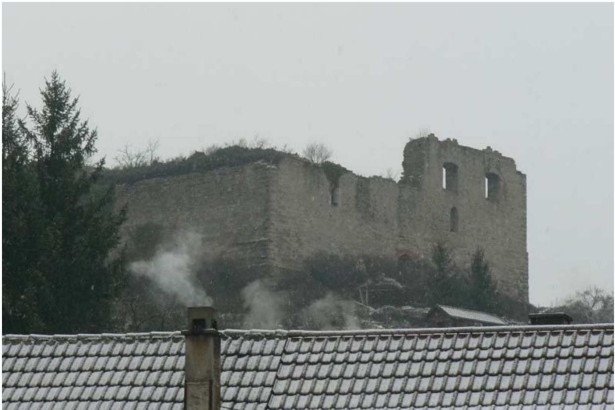
Südwestseite von Untermberg gesehen

Über dem Ort „Untermberg“ erheben sich die mächtigen Mauerreste des von Südwest nach Nordost verlaufenden Enztales. Wie ein großer Klotz spiegelt sich die Burgruine im Wasser der Enz. Überquert man von Sachsenheim die Hochfläche -das sogenannte Burgfeld- nach Südosten, so erreicht man den Weiler „Egartenhof“. In der Topografischen Karte findet sich der Begriff „Ruine Äußere Burg“ - es handelt sich dabei um die Burg Alt Sachsenheim.