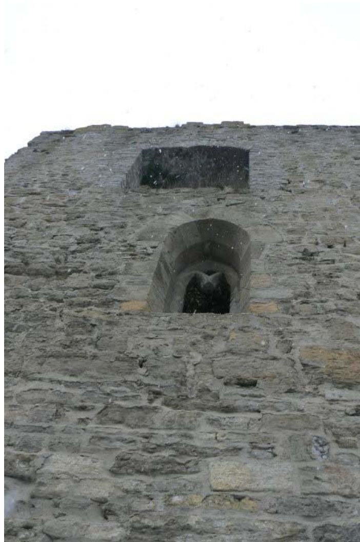
Südseite mit gotischem Fenster

Zufahrt von der A 81 Stuttgart - 6 Heilbronn. Ausfahrt Ludwigsburg 7 -Nord auf der B 27 Richtung Bietigheim fahren. Kurz vor Bietigheim nach Bissingen links abbiegen, den Ort durchqueren und die Enz in Richtung Sachsenheim auf der L 1110 nach Untermberg überqueren. In der Ortsmitte von Untermberg rechts hoch in die Schloßstraße unter der schon sichtbaren Burg zum Weiler Egartenhof abbiegen und im Weiler parken. Dort ist die Ruine ausgeschildert. Die Ruine ist bis auf den Innenhof frei zugänglich und bietet einen herrlichen Blick über das Enztal.