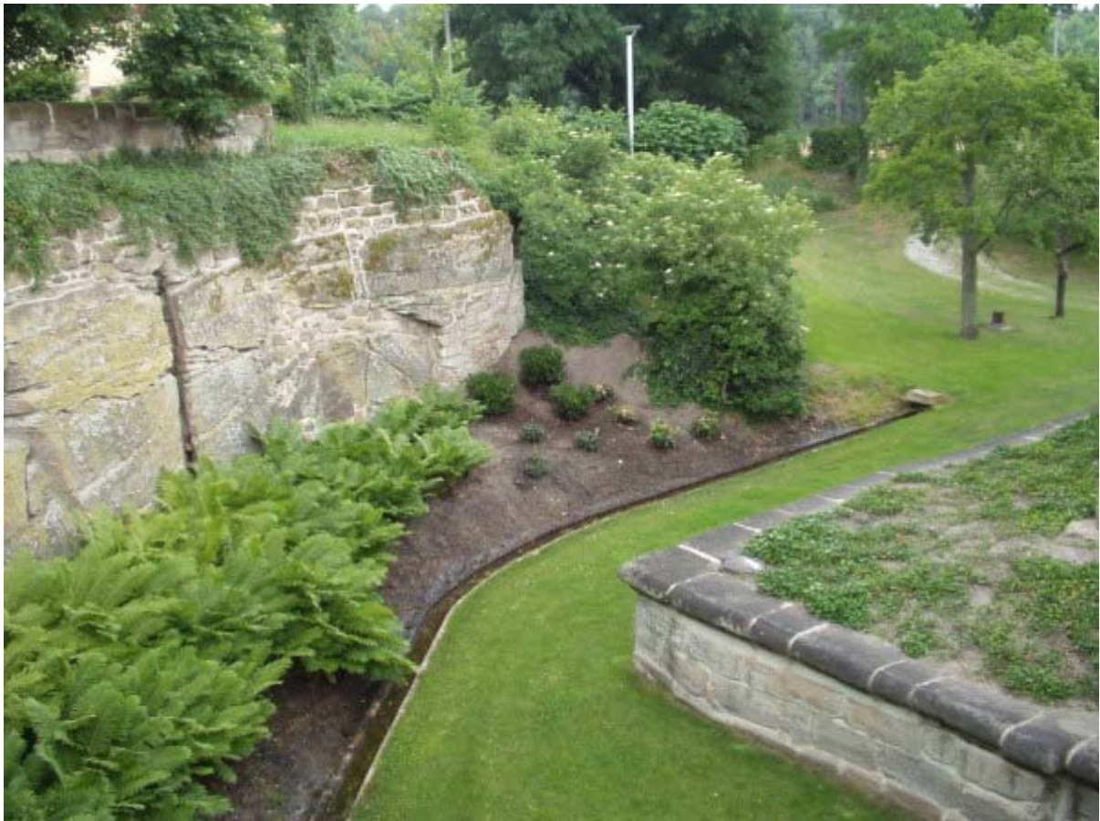
Südwestecke des Grabens mit ehemaligem Zufluss, rechts Sockelfundament

Das Hauptgebäude wird von einem sockelartigen rechteckigen Fundament mit flachen Stützmauern auf der Berme 6 umgeben. Einige Fundamentsteine weisen Zangenlöcher auf, welche eine vorsichtige Datierung des Steinmaterial ermöglichen. 7 Die so genannte Hebezange wurde zum Transport von Steinquadern im Burgenbau ab ca. 1220-30 in ausschließlich benutzt. Da nicht alle der Steinquader mit geregelter Glattfläche oder teilweise grob abgespitzten Quaderbossen die typischen Zangenlöcher aufweisen, ist es möglich das bei einem Wiederaufbau/ Umbau in späteren Jahrhunderten altes Baumaterial für das Fundament verwendet wurde. Auf der Ostseite neben dem Schlossgraben befindet sich ein kleiner ummauerter, barocker Schlossgarten. Südlich gegenüber dem Tor, zu dem eine Steinbrücke führt, ist die „Vorburg“ axial angelegt, links und rechts des Zuganges stehen zwei große Scheunen/Wirtschaftsgebäude. Das Innere des Schlosses ist aufwändig renoviert, das Kreuzgratgewölbe auf Sandsteinsäulen im Erdgeschoss verleiht dem Gebäude einen noch sehr mittelalterlichen Eindruck.