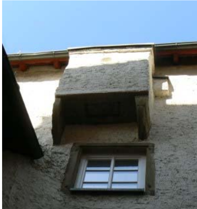
Abtritt am Steinhaus

mehrstöckiges Steinhaus- ein Wohnturm mit dicken Mauern und verziertem Rundbogenfries. Man beachte den Abtritt, der direkt über dem Hofeingang ist. Welch Überraschung für einen Besucher, wenn der Burgherr in diesem Moment seine Notdurft in den tief unter ihm liegenden Hof herabplätschern ließ!