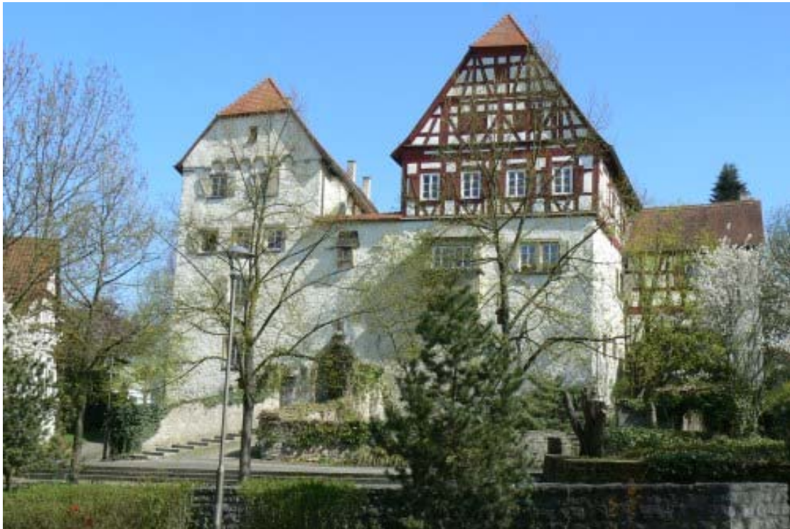
Das Alte Schloss von Westen gesehen

Südlich der Amanduskirche befindet sich das Neue Schloss westlich der Ludwigsburger Strasse und direkt gegenüber auf der Ostseite der Strasse liegt das Alte Schloss leicht erhöht am Hang. Während das Alte Schloss mit seinen Fachwerkgebäuden sofort ins Auge sticht, ist das Neue Schloss eher ein bescheidener Wohnbau, welchen man mit einem Landhaus vergleichen kann.