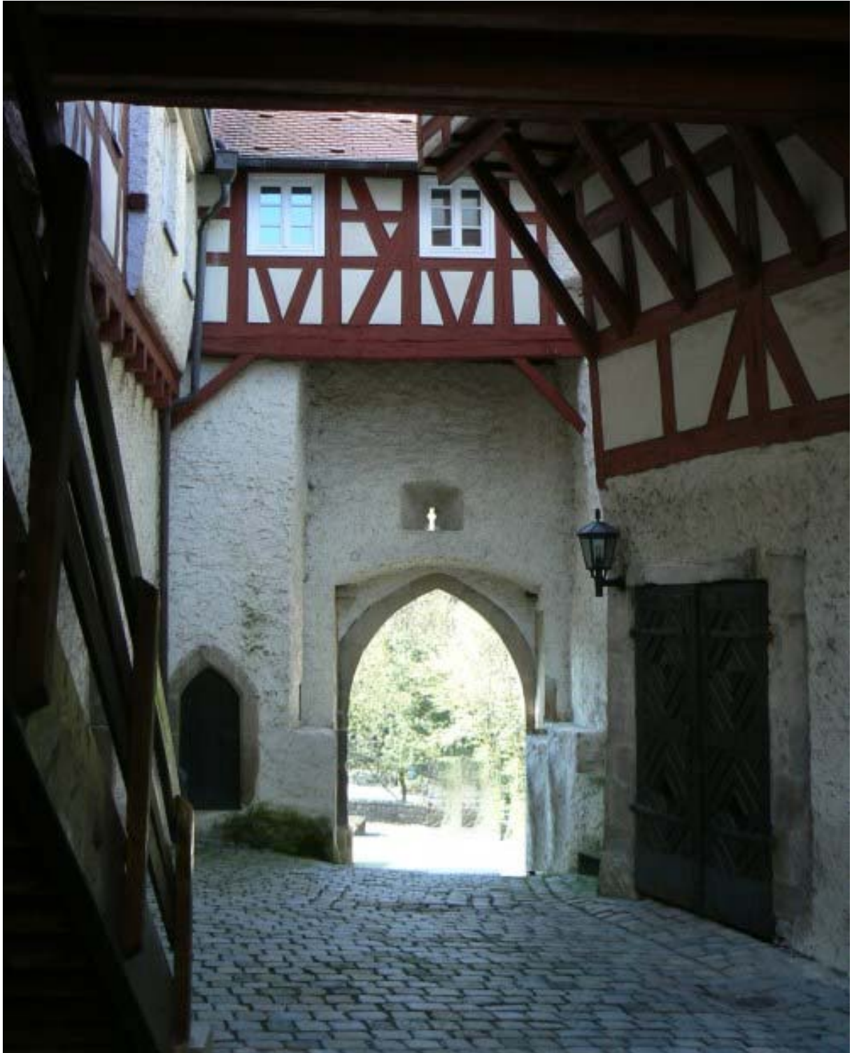
Innenhof mit Torportal