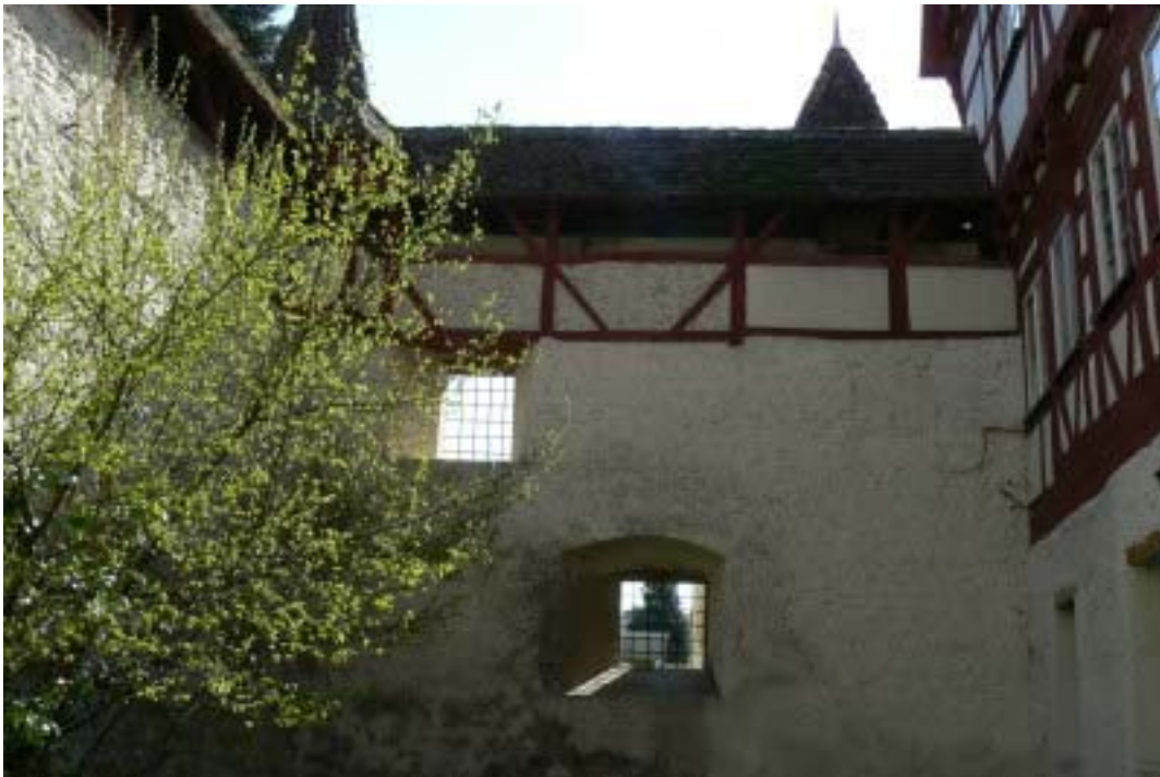
Hof mit Südmauer und Wehrgang

Spätere Besitzer waren dann die Herren von Hallweil(er), von Breitenbach, Göler von Ravensburg 8 und ab 1710 von Gemmingen-Hornberg . 9 Seit 1964 ist das Anwesen Eigentum der Gemeinde und heute befinden sich 11 Wohnungen, das Stadtarchiv und die Bibliothek in dem romantischen Bauwerk. Während der Renovierung wurde der Schlossgarten als Baugebiet ausgewiesen und bebaut. Gegenüber der Straße befindet sich auch die alte Schlosskeller. Lohnenswert ist die Besichtigung der Amanduskirche mit Grabgelegen u.a. der Herren von Gemmingen. Die Wehrkirche mit einem Turm aus dem Jahre 1400 und einem Querschiff aus dem Jahre 1620 ist außergewöhnlich schön ausgestattet.