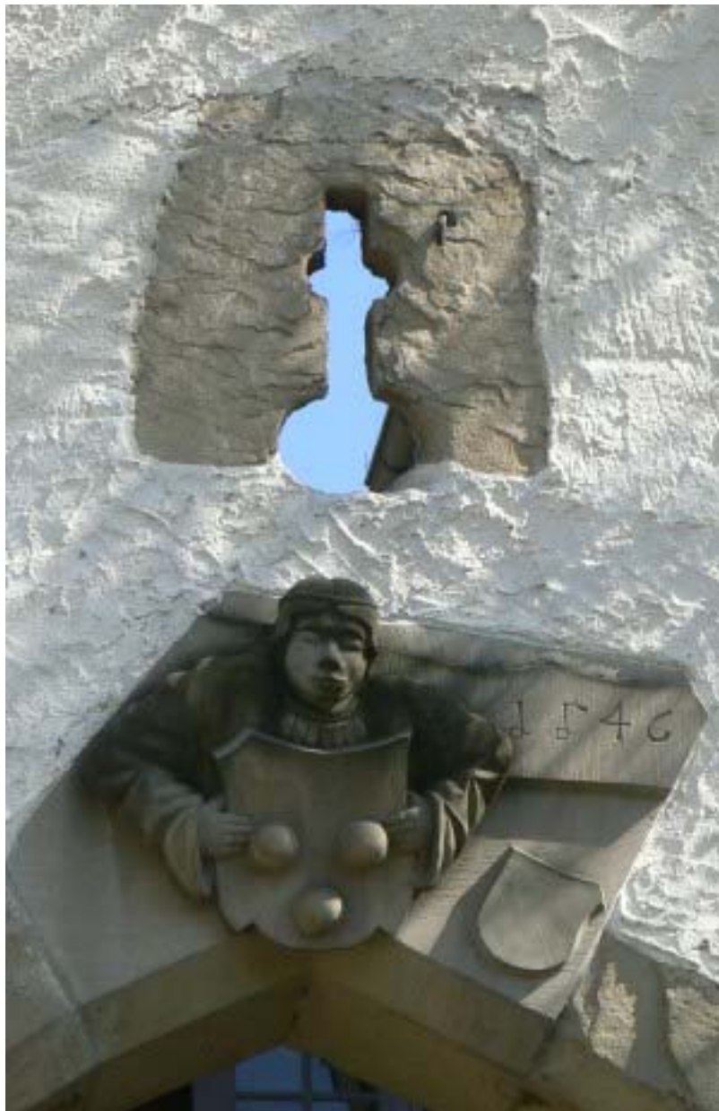
Wappen und Schlüsselscharte über dem Tor

Ganz anders das wehrhaft wirkende Alte Schloss. Die einstige kleine Niederadelsburg besteht heute aus zwei Gebäuden, welche sich einen kleinen Hof teilen. Von der Straße auf der Westseite führte der Zugang einst über einen heute zugeschütteten Graben durch ein spitzbogiges Torportal, welches mit einem Wappen gekrönt ist. Über dem Tor befinden sich eine Schlüsselscharte und darüber ein Gusserker in der Mauer.