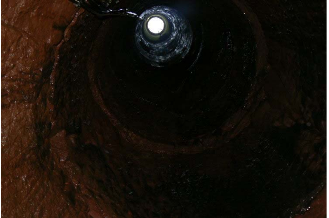
Brunnen aus dem Gang nach oben gesehen