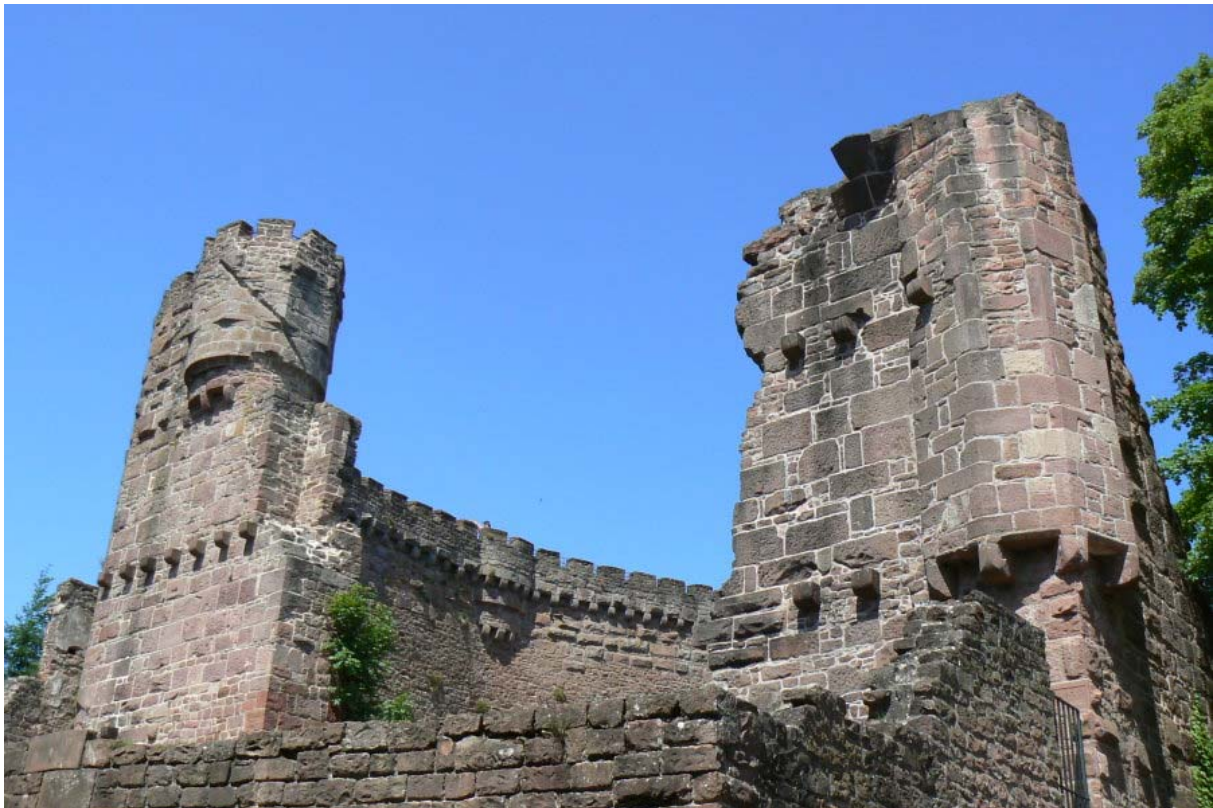
Reste der Schildmauer (links)

Östlich von Heidelberg 1 findet man auf der Südseite des Neckars hoch über einer Neckarschleife den Ort Dilsberg über dem an höchster Stelle die alte Feste thront. Parken ist vor der Altstadtmauer möglich 2 . Die kopfsteingepflasterten Gassen laden zu einem Rundgang durch den Ort ein.