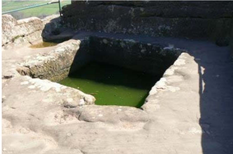
Zisterne am höchsten Punkt der oberen Plattform

Wie im ganzen Fels finden sich hier auch überall Ablaufrinnen für Regenwasser und zisternenartige Wasserspeicher, um das kostbarste Gut zu sammeln: Das Regenwasser. Brennholz, Nahrungsmittel und Dinge des täglichen Gebrauchs wurden mittels Lastenaufzügen, von denen Spuren im Felsen vorhanden sind, hochgezogen. Wasser wurde möglichst in den Zisternen über die Dachaufbauten gesammelt.