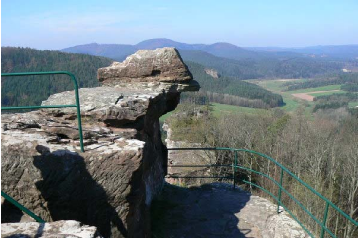
Blick vom höchsten Punkt der Ostseite nach Westen

Nicht zu verwechseln mit der Burg Drachenfels bei Königswinter (Nordrhein-Westfalen), befindet sich der Pfälzer Drachenfels auf einem in Ost-Westrichtung verlaufenden Sandsteinfelsen hoch über der umliegenden Region. Vom Parkplatz erreicht man die Ruine von der Ostseite. Auf der Südseite des Felsens betritt man die Burg durch die unterhalb des Felsens auf der warmen und sonnigen Südseite liegenden sogenannte „Hauptburg“ 4 , von der noch große Teile erhalten sind 5 . Durch den Vorhof und den rechteckigen Torturm mit Obergeschoss wird die Burg betreten. Die Außenmauern des Torturmes sind mit Buckelquadern verkleidet, auf denen Zangenlöcher und romanische Steinmetzzeichen erkennbar sind.