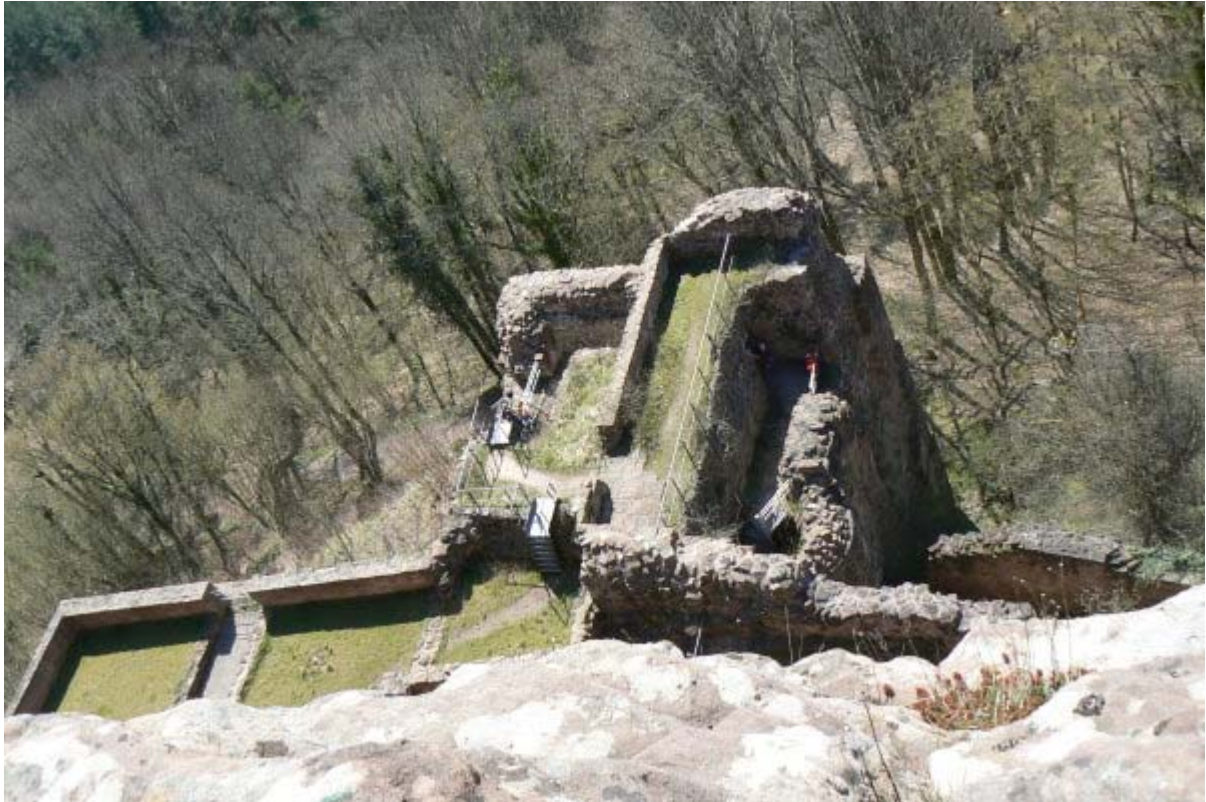
Torturm vom Ostfelsen aus gesehen

Zwischen Torturm und dem hohen Ostfelsen sind noch Teile von Kellerräumen und vom sogenannten Eisspeicher erhalten. Direkt am Ostfelsen befindet sich ein weiterer rechteckiger Turm mit Buckelquaderverkleidung. Westlich des Turmes erstreckt sich der nicht mehr erhaltene Burghof in Richtung des Westfelsens. Von der Hauptburg führen zwei schmale in den Fels gehauene Treppen zur Oberburg auf den Ostfelsen. („Westliche und östlicher Aufgang“). In den Aufgängen sind noch etliche Verriegelungsmöglichkeiten im Fels sichtbar, welche eine Eroberung erheblich erschwerten. Bei Herrmann 6 findet der interessierte Leser eine schöne Skizze des heutigen Zustandes der Ruine Drachenfels und eine sehr ausführliche Beschreibung.