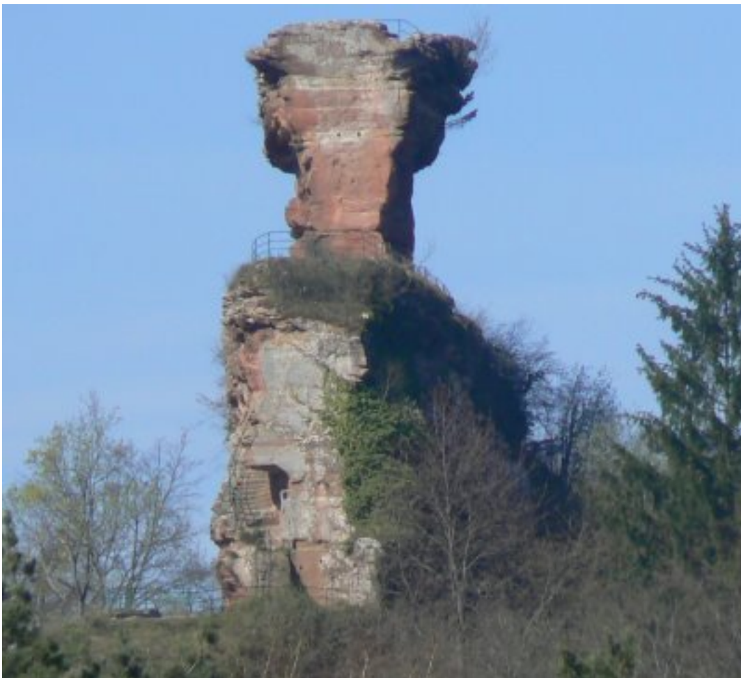
Blick von der Hütte auf den östlich gelegenen Drachenfels

Besucher der Pfalz, welche den Landkreis Pirmasens durchqueren, erreichen die weithin sichtbare Burg über die B270. Östlich des Dorfes Busenberg befindet sich der Weissensteiner Hof. Von dort führt ein Sträßchen zum Parkplatz der Drachenfelshütte des Pfälzerwaldvereines Busenberges. Von hier kann man in wenigen Minuten die frei zugängliche Ruine auf dem Drachenfels erklimmen.