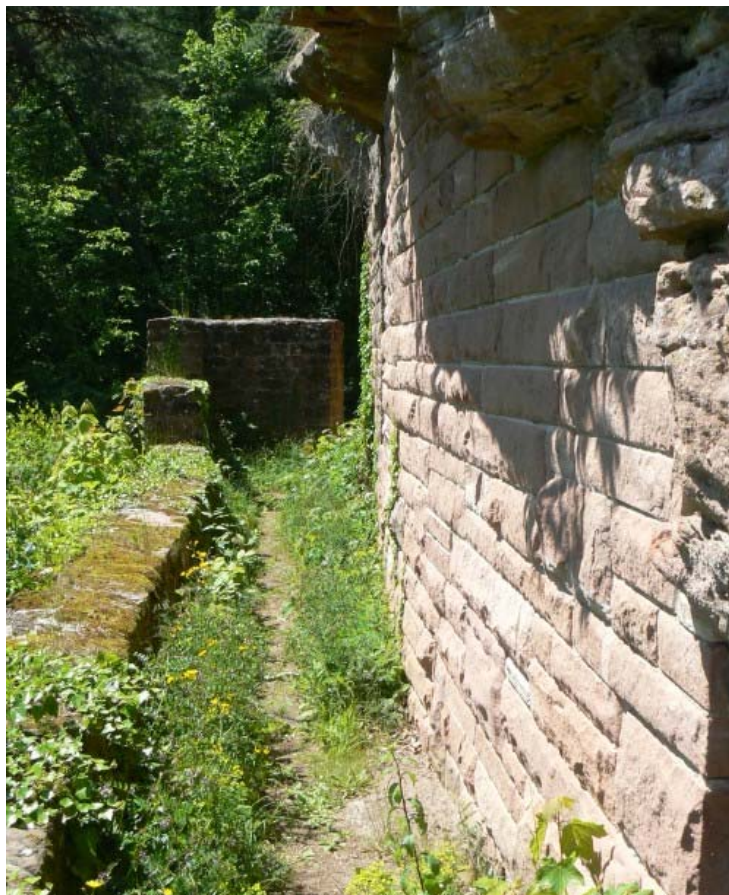
Zwinger auf der Südseite

Der ca. 10 Meter lange Felsklotz, auf dem sich der Bergfried befindet, wurde an den Seiten stark unterhöhlt um Raum für einen Zwinger zu schaffen und den Durchgang zur Vorburg an der Spornspitze zu ermöglichen. Der Überhang auf beiden Seiten lässt jeden Statiker sich wundern, dass diese Turmkonstruktion noch nicht zusammengebrochen ist. Aus diesem Grund wurde auch im letzten Jahrhundert eine mächtige Stützmauer auf der Nordseite errichtet und gleichzeitig eine Treppe zum Plateau des Felsens errichtet. Der Fels schützt wie eine Sperrmauer das sich dahinter befindende Vorburggelände. Ein schmales ca. 15 Meter langes Plateau fällt auf allen Seiten sturmfrei steil ab. Mauerreste sind nicht mehr vorhanden. Die Zwingermauern um den Felsklotz sind noch teilweise zu erkennen. Oben auf dem Felsplateau sieht man den Rest einer rechteckigen Zisterne. Balkenlöcher weisen auf ein Gebäude- vermutlich den Palas- hin. Der rundbogige Eingang in das erste Geschoss des Turmes befindet sich in 6 Metern Höhe. Der Turm kann nicht bestiegen werden. Der Aufbau der Ruine erinnert an andere Felsenburgen wie die Burg Fleckenstein 4 , Burg Drachenfels 5 oder Burg Wasignstein 6 .