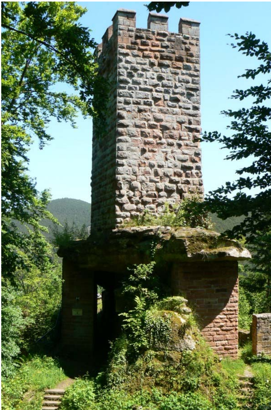
Bergfried vom Halsgraben aus gesehen

Vom Ort Erfenstein aus führt ein schmaler Taleinschnitt an einem Bach entlang nach Westen. Über diesem Tal ragt am Hang der Felsgrat nach Osten über das Tal. Von Norden her führt der Weg empör zur Spornspitze. Über einen aus dem Fels gehauenen, heute teilweise verschütteten und durch den Wanderweg veränderten Halsgraben, erreicht der Besucher den ca. 10 Meter hohen Felsklotz, auf dem sich der gut erhaltene, rechteckige und 10 Meter hohe Bergfried erhebt. Mit seinen Ausmaßen von ca. 4,9 Metern auf 5,5 Metern und einer Wanddicke von 1 Meter bis 1,5 Metern (im Westen) ist er relativ klein.