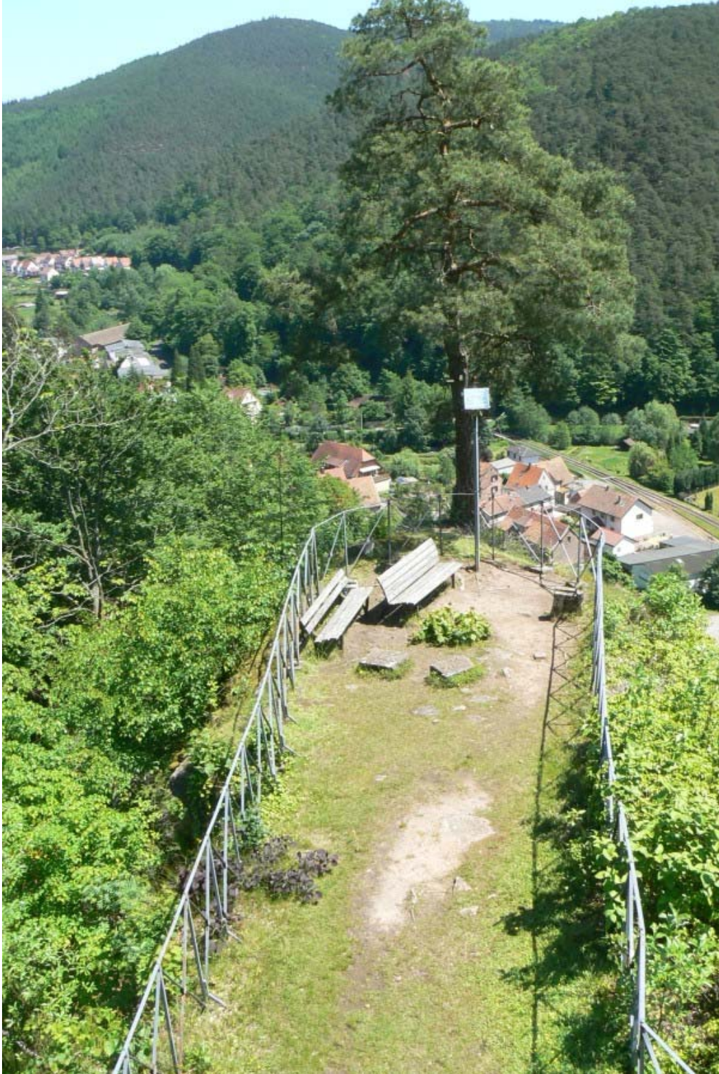
Vorburg auf dem Sporn nach Osten