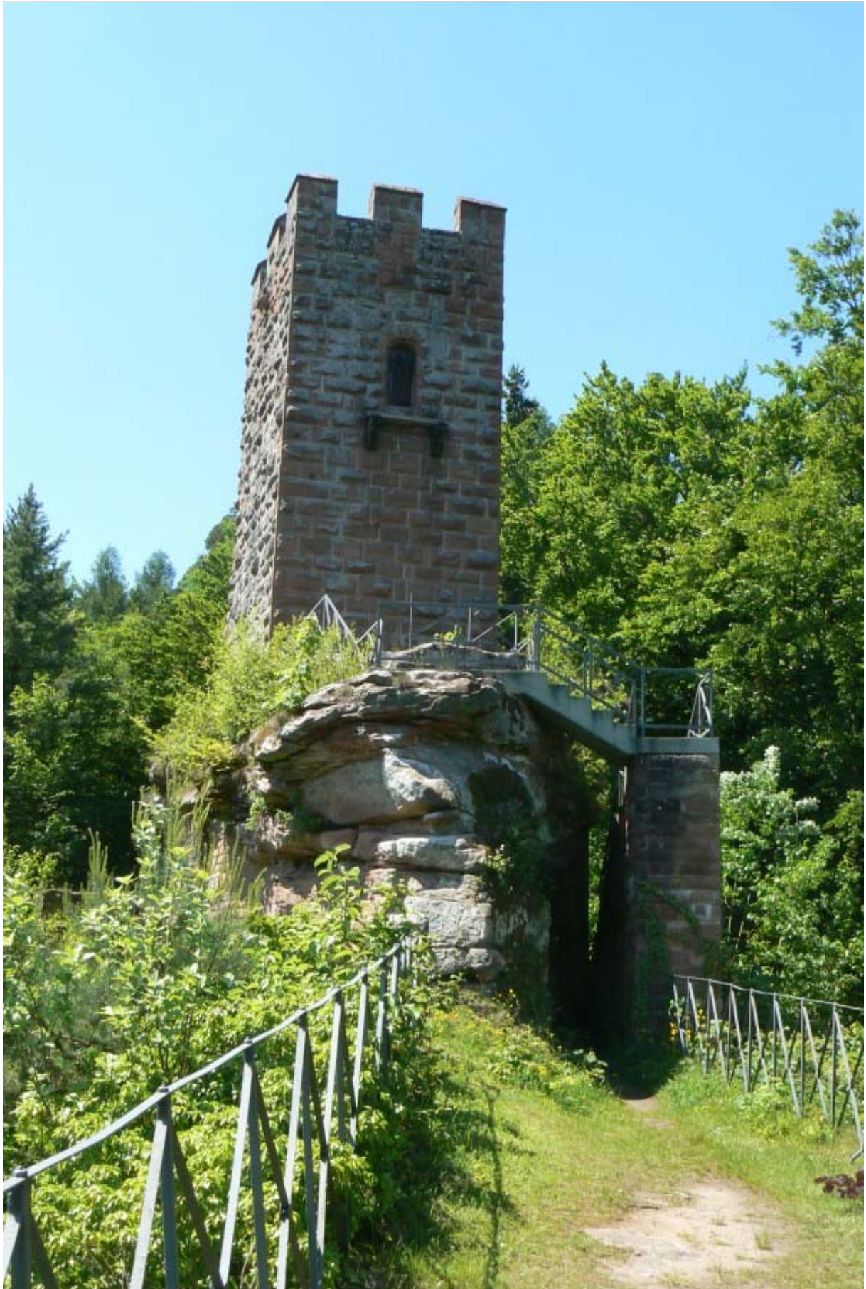
Bergfried von Osten gesehen