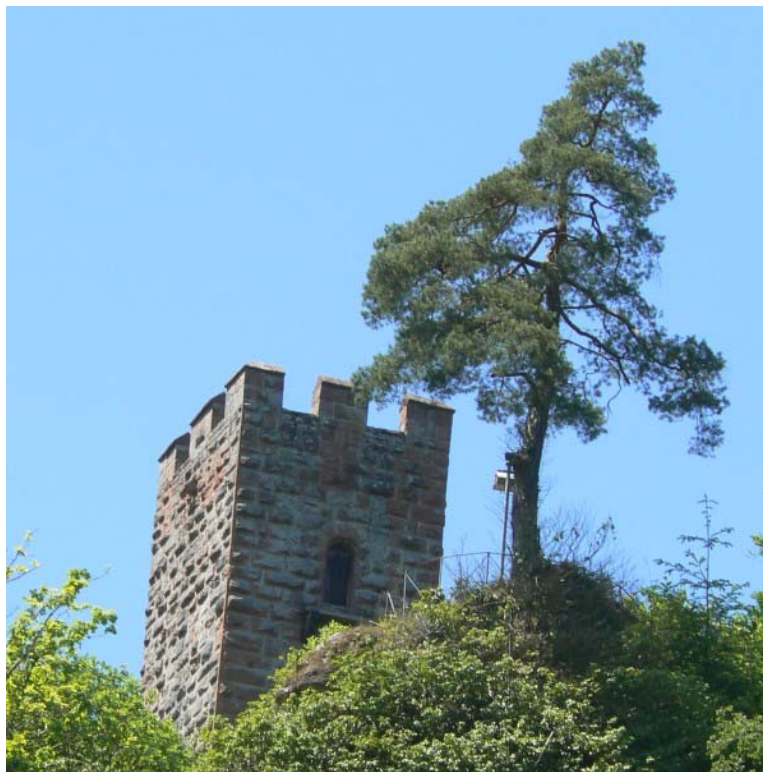
Blick vom Tal hoch zur Burg

An einem der vielen dicht bewaldeten Hänge der Pfalz ragt ein Felsgrat spornartig von Osten nach Westen über das Elmsteiner Tal. Vom Wald heute gut versteckt sieht man aus dem Tal nur den Bergfried der 265 Meter über N.N. erbauten Burg Erfenstein aus dem Wald ragen. Unmittelbar dahinter befinden sich die wenigen Reste der Burg Alt-Erfenstein 1 . Direkt in Augenhöhe gegenüber dem Burgareal von Erfenstein befindet sich 250 Meter weiter entfernt die Burg Spangenberg 2 auf der anderen Talseite. Hier bewachen zwei feindliche Grenzburgen ihre Besitzungen: Leininger Grafen auf der einen, das Bistum Speyer auf der anderen Seite.