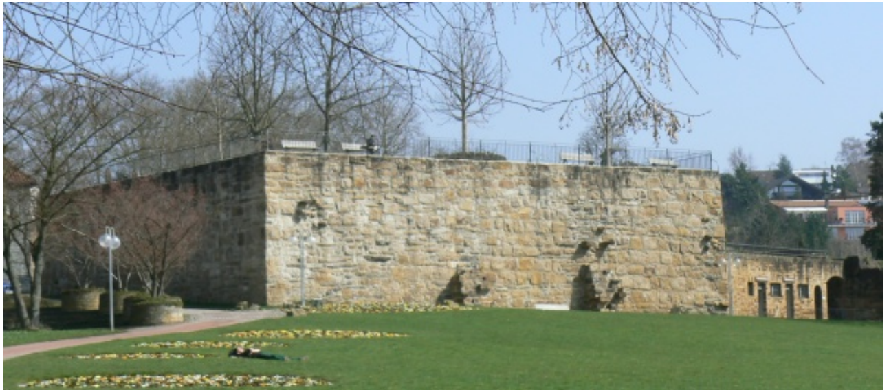
Schütte von Süden gesehen

Im Bereich der Nordseite muss einst ein Bergfried gestanden haben. Hier taucht der Begriff „Bergfried“ in alten Unterlagen auf. Auf der Nordseite befinden sich Wirtschaftsgebäude und ein Halbschalenturm im Mauerbering integriert. Die nordwestliche Schenkelmauer beginnt am so genannten „Mélac-Häusschen“ und verläuft den Hang hinunter. Auf der Nordseite der Burg verläuft der Bergsporn flach auf dem Areal des „Äußeren Burgplatzes“ und steigt danach wieder an.