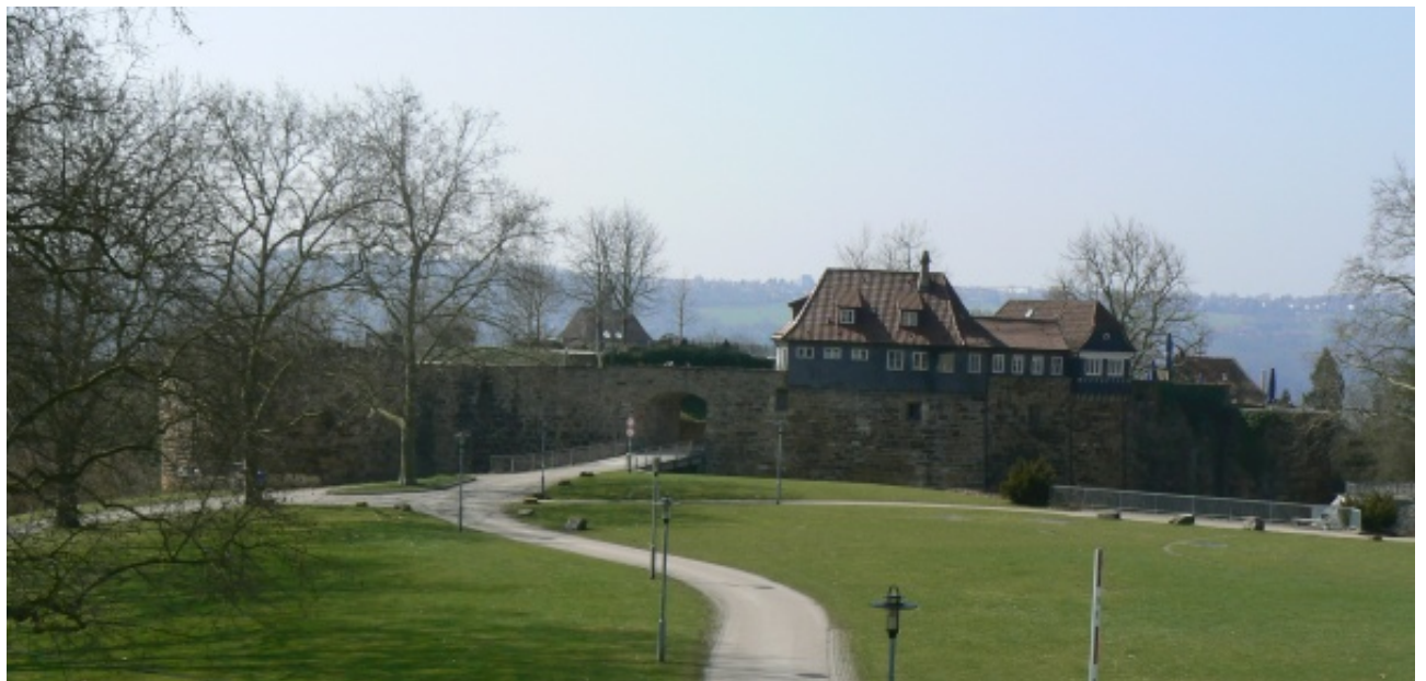
Nordseite mit „Äußerem Burgplatz“

Esslingen befindet sich neckaraufwärts südöstlich der Baden-Württembergischen Landeshauptstadt Stuttgart 1 . Typisch für die Landschaft des Württembergischen Neckartales sind die weinbergbewachsenen Hänge, welche wir auch am nördlichen Altstadtrand von Esslingen finden. Vom Altstadtkern steigt die sogenannte „Burgsteige“ steil zur Burg in Hangrandlage über dem Neckartal empor. Dominiert wird die Burg vom „Dicken Turm“, welcher an die Stadtbefestigung Nürnbergs 2 erinnert. Im Schatten der Württembergers 3 Herrschaft war die freie Stadt immer in Gefahr, vom mächtiger werdenden adligen Nachbarn überrannt zu werden. Dies war der Grund, die Stadt mit einer Burg und entsprechenden Stadtmauern zu schützen.