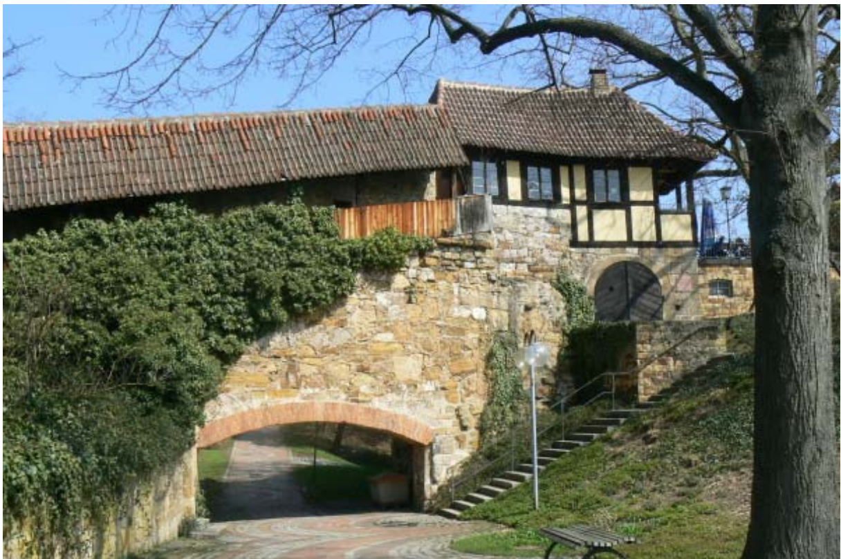
Mélac-Häusschen mit heutigem Durchbruch unter der Schenkelmauer

Im Bereich der Nordseite muss einst ein Bergfried gestanden haben. Hier taucht der Begriff „Bergfried“ in alten Unterlagen auf. Auf der Nordseite befinden sich Wirtschaftsgebäude und ein Halbschalenturm im Mauerbering integriert. Die nordwestliche Schenkelmauer beginnt am so genannten „Mélac-Häusschen“ und verläuft den Hang hinunter. Auf der Nordseite der Burg verläuft der Bergsporn flach auf dem Areal des „Äußeren Burgplatzes“ und steigt danach wieder an.