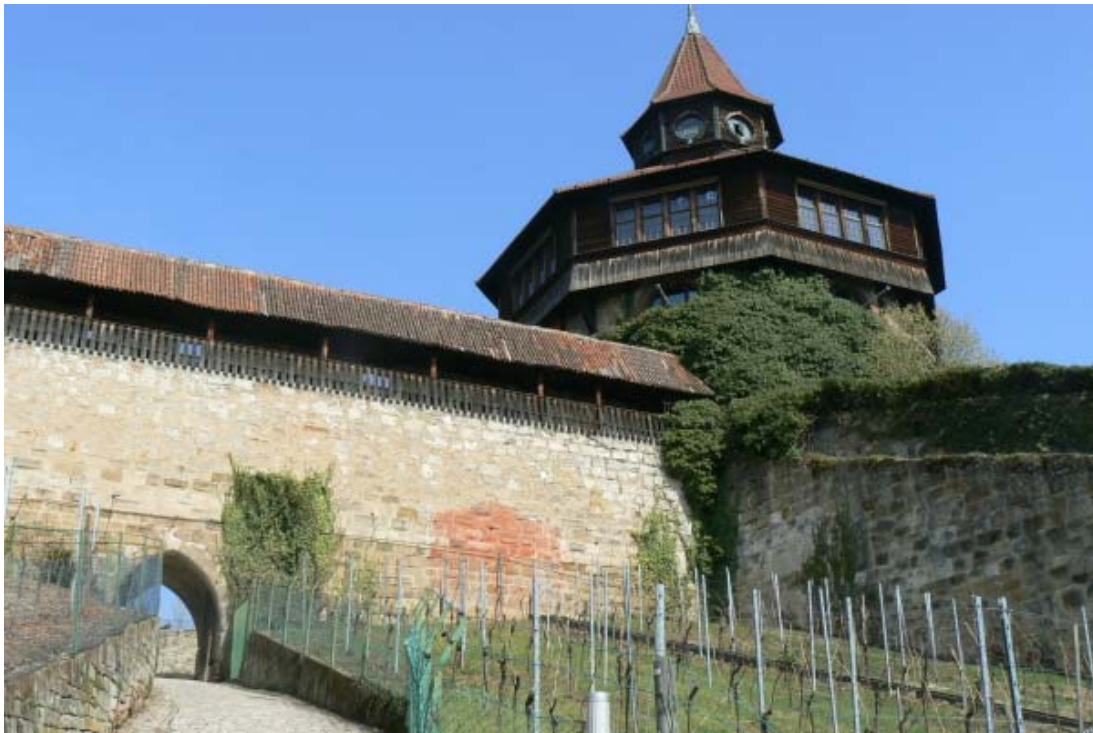
Burgsteige, Seilergang und Dicker Turm