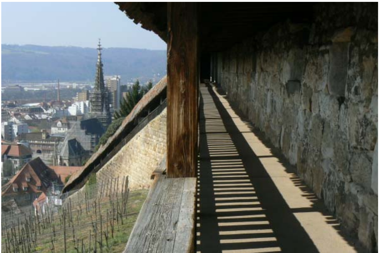
Der Seilergang mit Schenkelmauer zur Stadt

Die Esslinger Stadtburg wurde in Spornlage auf dem nördlich der einstigen freien Reichstadt sich erhebenden Schönenberg errichtet. Dieser Berg hebt sich leicht isoliert vom gesamten nördlichen Neckarhang ab und wird auf der Westseite von einem tiefen Taleinschnitt und auf der Ostseite von einer rinnenartigen Vertiefung vom Neckarhang isoliert. Wesentlich höher wie der Altstadt kern gelegen, bildete er für einen Feind eine ideale Angriffsposition auf die Stadt, welche nach Süden hin vom Neckar geschützt wurde. Diese Stelle in die Stadtbefestigung zu integrieren war also zwingend notwendig. Wann genau die erste Burg auf dem Berg errichtet wurde, ist unklar. Eventuell fällt die Erbauung mit der Erhebung Esslingens zur freien Reichsstadt 1219 durch Kaiser Friedrich II. In dieser Zeit wurde der damalige Ort durch Stadtmauern gesichert. Die südliche Mauer (Sailergang) sowie die dortigen zwei Schenkelmauern weisen staufische Buckelquader mit kissenförmigen Bossen und Randschlag auf. Das Mauerwerk ist größtenteils gleichmäßig und sauber verarbeitet. Dies würde auf eine Errichtung im 13. Jahrhundert hinweisen. 5