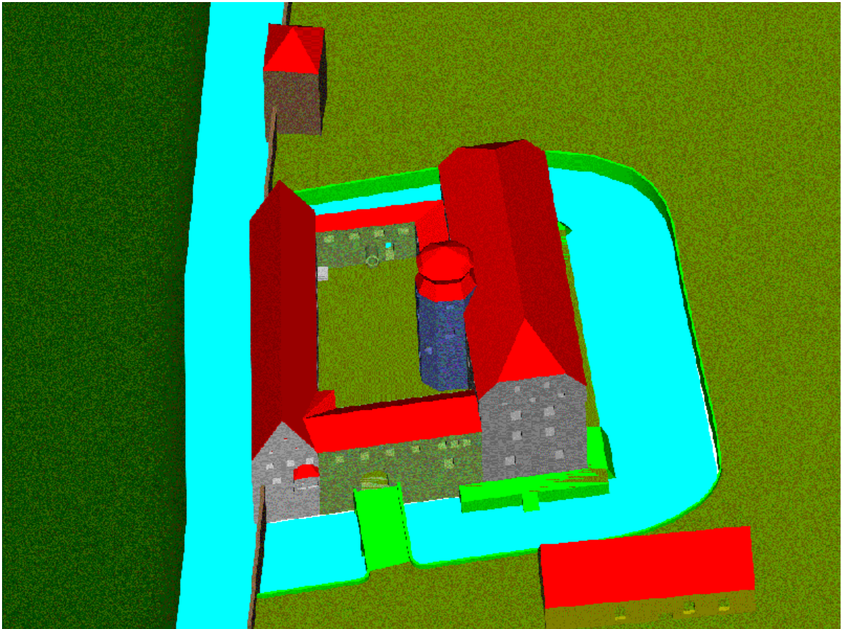
Rekonstruktion der Anlage in der Renaissancezeit (ohne Stadtgebäude)