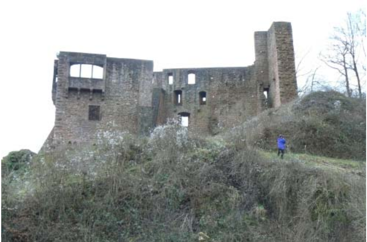
Blick von der Ostseite auf den Kapellenbau (links) in der Mitte der ehemalige Palas und rechts der Schildmauerrest