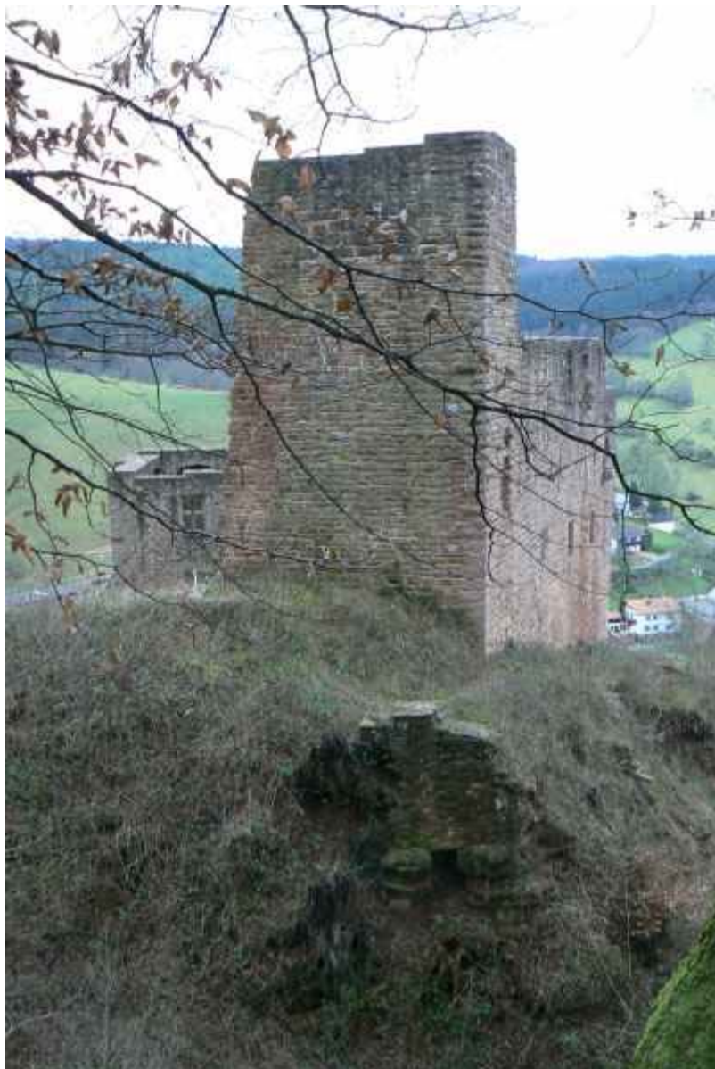
Blick von der Hangseite über den Halsgraben auf den Rest der Schildmauer, vorne Reste der Zwingermauer