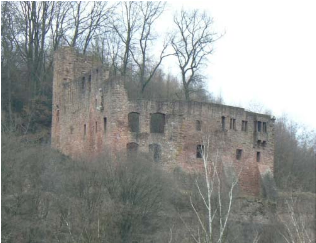
Freienstein von Gammelsbach aus gesehen

Vom Neckartal zweigt das Gammelsbachtal von Eberbach nach Osten in den Odenwald ab, folgt man diesem Tal erreicht man den Ort Gammelsbach über dem in Hanglage auf einer künstlichen Spornterrasse 1 die Ruine Freienstein emporragt.