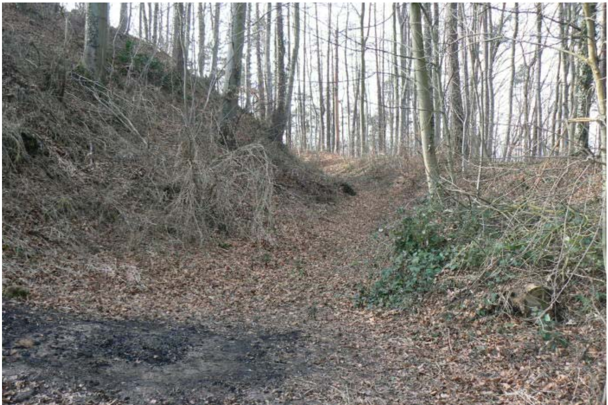
Ringgraben auf der Westseite

Der kleine Ort Obergleichen grenzt direkt mit einem Gehöft an die Ostseite des Burghügels. Steil fällt dort der natürliche Bergkegel zum Ort hin ab und ein ehemaliger Halsgraben wurde vermutlich zugeschüttet und überbaut. Das von Westen nach Osten 34 Meter Breite und von Süden nach Norden 35 Meter messende fast ebene, Burgplateau befindet sich ca. 10 bis 15 Meter über dem Niveau des heutigen Ortes und wird auf der Nord-, Süd- und Westseite von einem künstlichen und ringförmigen und heute noch ca. 2 Meter tiefen Graben umgeben, der ebenso von einem bis zu 2 Meter hohem Ringwall umgeben ist.