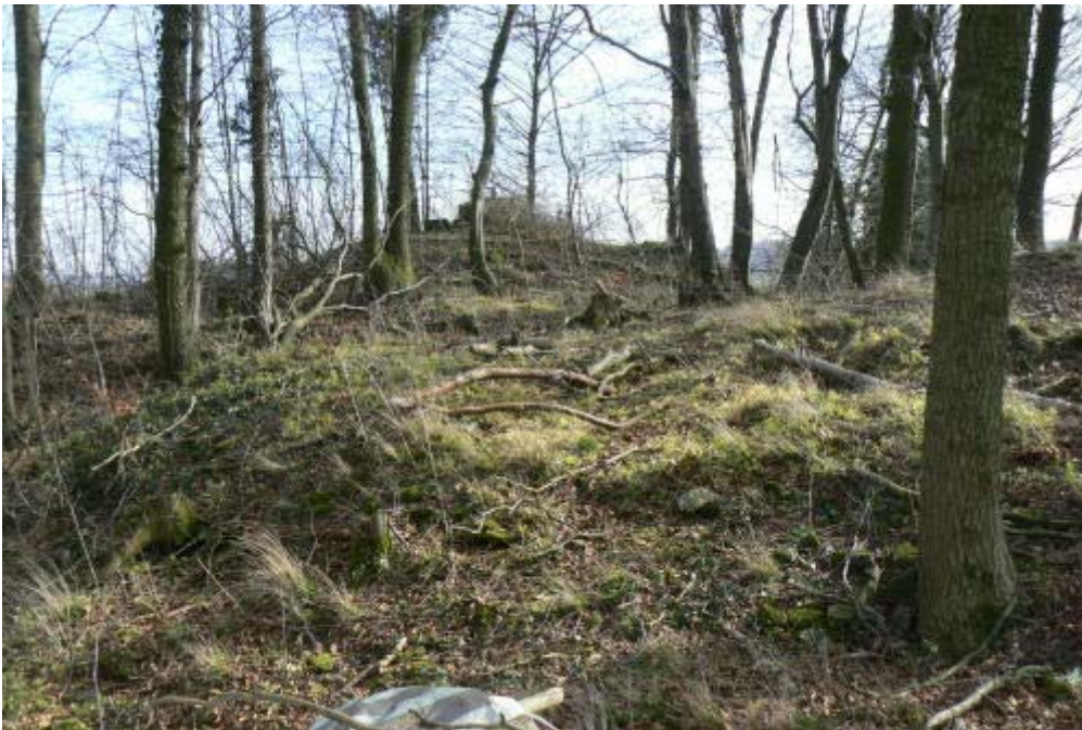
Burgplateau mit Wasserbehälter im Osten

Daneben lässt eine rechteckige Vertiefung ein ehemaliges Gebäudefundament oder einen kleinen Keller erahnen. Ein Hügel auf der Westseite könnte der Rest eines Gebäudes sein. Ein Grundriss der ehemaligen Anlage bleibt aber bei einer Vorortbegutachtung pure Spekulation. Lesefunde von Becherkacheln und Scherbenfragmenten auf dem erodierten Westhang lassen aber eine intensive Nutzung des Areals vermuten. Die strategisch hervorragende Lage und der weite Blick von dem einst sicherlich gerodeten Berg über die ganzen Löwensteiner Berge könnten darauf hinweisen, dass diese Burg nicht ganz unbedeutend war.