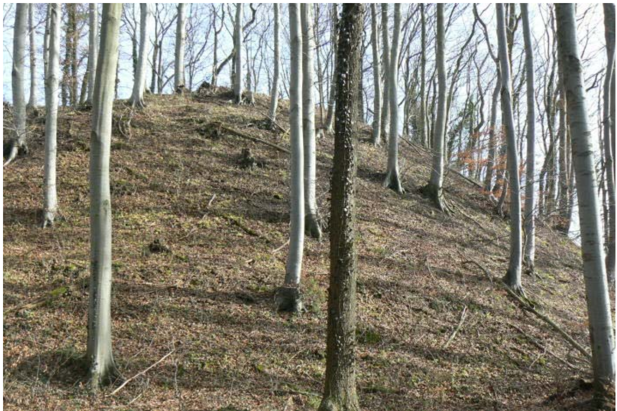
Burghügel von Westen

Weithin sichtbar liegt der bewaldete kegelförmige Burghügel der einstigen Burg Gleichen über dem Brettachtal und zeichnet sich markant von den anderen Erhebungen der Löwensteiner Berge ab.