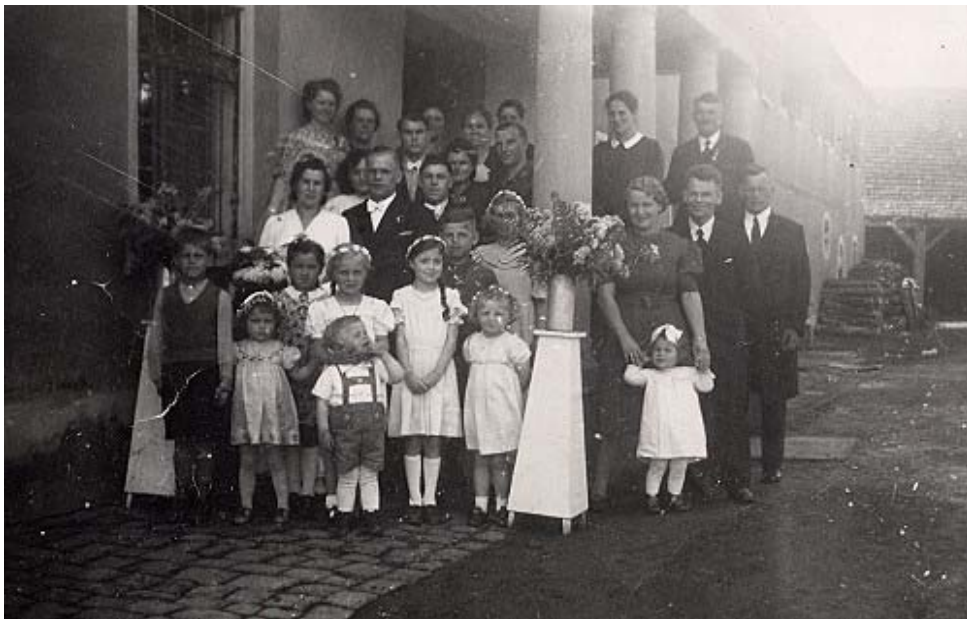
Haupteingang des Schlosses

Erbaut wurde das Gebäude von den Herren von Helmstadt . Im Jahre 1684 kam es in Besitz der Herren von Berlichingen 1 . Noch am Anfang des 19. Jahrhunderts wurde das Anwesen renoviert und von einem Grafen Götz von Berlichingen bewohnt. 2