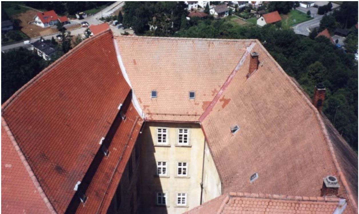
Palas und Hof

Führungen nach Anmeldung Restaurant Burgschenke (März-Anfang November geöffnet) Burg Biergarten, Museumsshop. Parkplätze bei der Vorburg (auch Busse) und Richtung Süden auf dem Bergplateau. Anfahrt von Heilbronn oder Heidelberg über die B27 ( Burgenstrasse ) bei Gundelsheim nach Neckarmühlbach abbiegen, ab dort ist die Burg ausgeschildert und gut sichtbar. Empfehlenswerte Wanderung: Parken beim Golfplatz in Bad Rappenau – Zimmerhof. Wanderung durchs Fünfmühltal nach Norden bis zur Burg Guttenberg, nach Süden zurück über den Berg vorbei am Jüdischen Friedhof nach Zimmerhof.