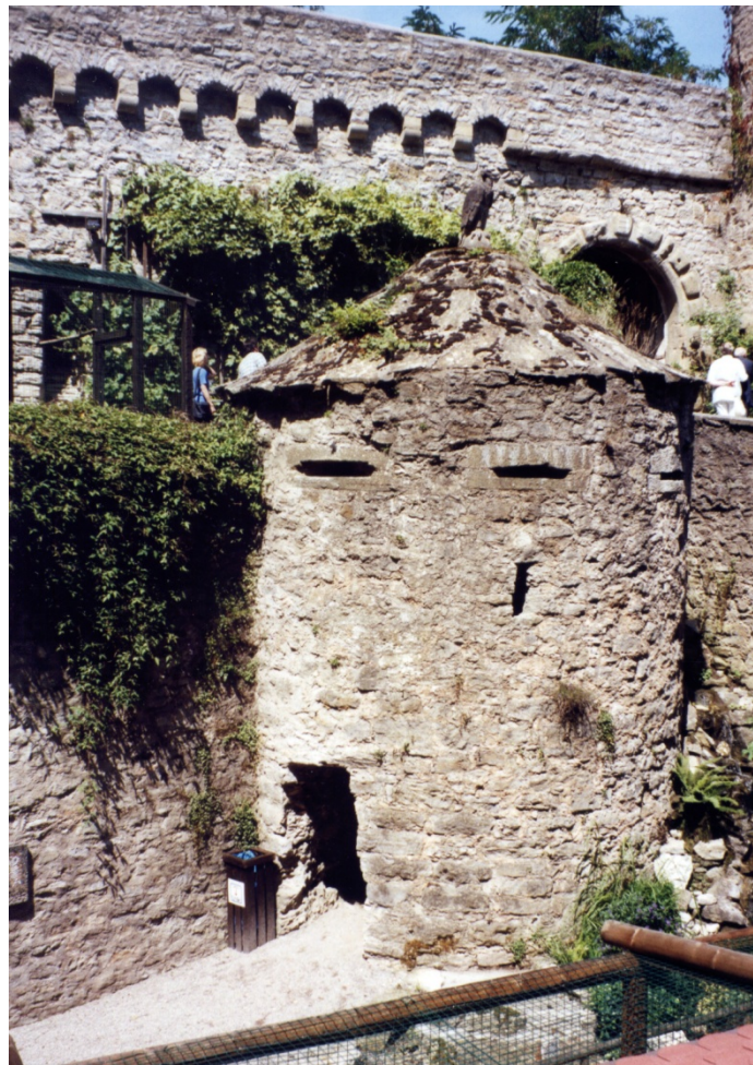
Flankierungsrondell bei der Brücke

Den engen Hof betritt man von der Nordseite. Im Palas befindet sich das Burgmuseum mit interessanten Exponaten, wie z.B. eine Baumbibliothek (für jede Baumart ist ein Buch aus dem jeweiligen Baumholz mit Blättern und Samen angelegt). Auch martialische Folterinstrumente und nachgestellte Zinnsoldatenschlachten werden gezeigt. Das Burggespenst und Ritterrüstungen lassen den Burgenromantiker in die leider nicht immer so gewesene Vergangenheit eintauchen.