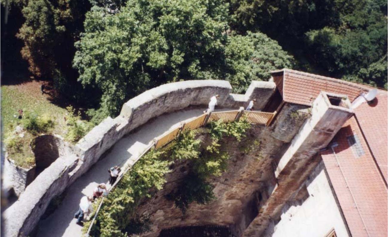
Hoher Mantel vom Bergfried aus gesehen