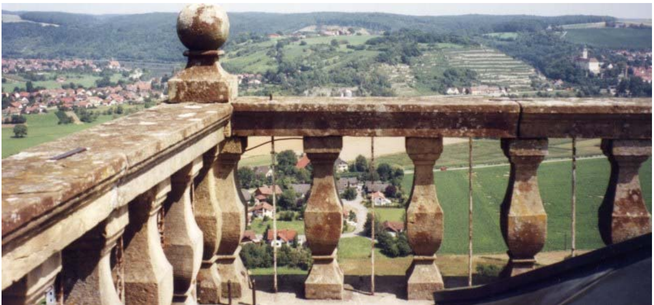
Blick vom Bergfried zu Schloss Horneck

Die nördlich der Kaiserpfalz Wimpfen an der Burgenstraße gelegene und einst um 1200 durch die Stauer zur Sicherung der Pfalz angelegte Burg, gehört zu den wenigen nie zerstörten oder eroberten Burgen. Durch geschickte Diplomatie und eine große Portion Glück blieb die Anlage 800 Jahre unberührt.