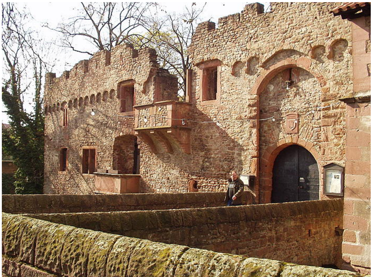
Blick vom Süden über den Graben

Im nördlichen Stadtteil Heidelberg -Handschuhsheim liegt mitten im Ortskern die quadratische Tiefburg.