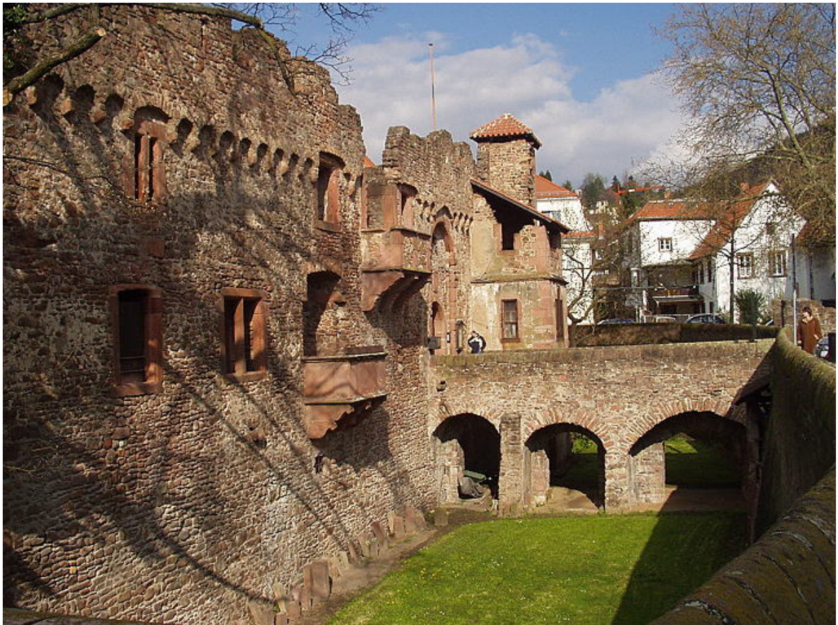
Südseite mit den zwei Balkonen des Südpalas

befand sich hier eine Zugbrücke und ein Fallgatter. In der Mitte des Areals steht ein wohnturmartiges, dreistöckiges Gebäude. Der Bau mit Satteldach wurde 1913 bei einer Renovierung der Anlage neu errichtet und soll ursprünglich aus dem 14. Jahrhundert stammen 3 . Zwei weitere Gebäude sind als Reste noch vorhanden: Der Palas auf der Südseite, "Kemenatenbau" genannt, dessen Fensterfronten und zwei Renaissancebalkone an der Außenmauer noch vorhanden sind und welcher auf das Jahr 1544 datiert wird, sowie der Palas an der östlichen Außenmauer, von dem noch an der Südostecke ein spätgotischer Anbau und ein Treppenturm sichtbar ist.