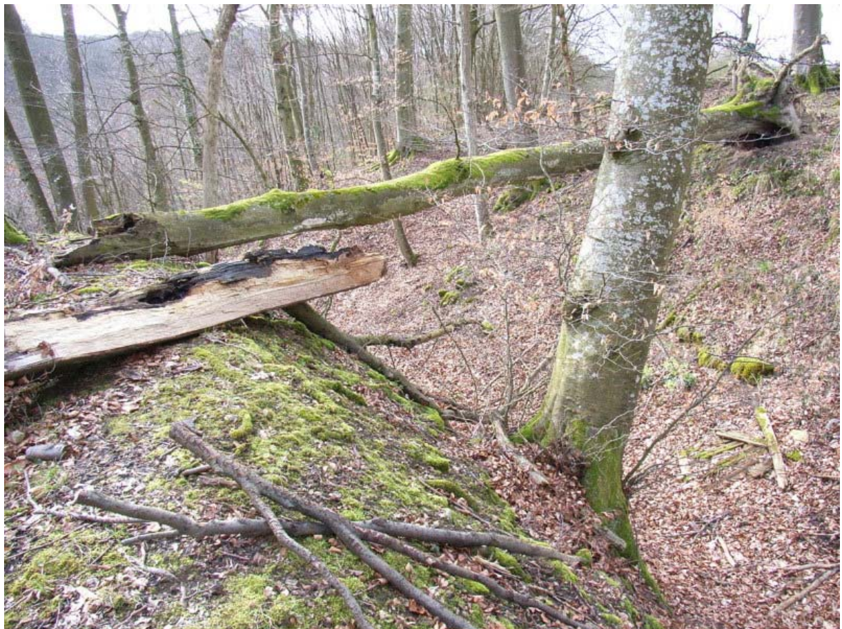
Halsgraben mit Mauerwall (links)

An dieser Stelle sind auch gebrannte Lehmbrocken 4 zu finden, welche aus den Zwischenräumen von Fachwerkhäusern stammen. Diese Lehmbrocken werden bei einem Gebäudebrand zu roten Tonbrocken gebrannt und bleiben deshalb der Nachwelt erhalten. Aufgrund dieser Tonbrocken ist zu vermuten, dass dieses ehemalige Gebäude durch einen Brand zerstört wurde. Eventuell teilte die ganze Burg dieses Schicksal. Die Steine der Anlage wurden dann im Laufe der Jahrhunderte als Baumaterial abtransportiert. Im 19. Jahrhundert wurden noch Ziegel und Mörtelreste gefunden. Geblieben sind nur noch die Umrisse der Anlage.