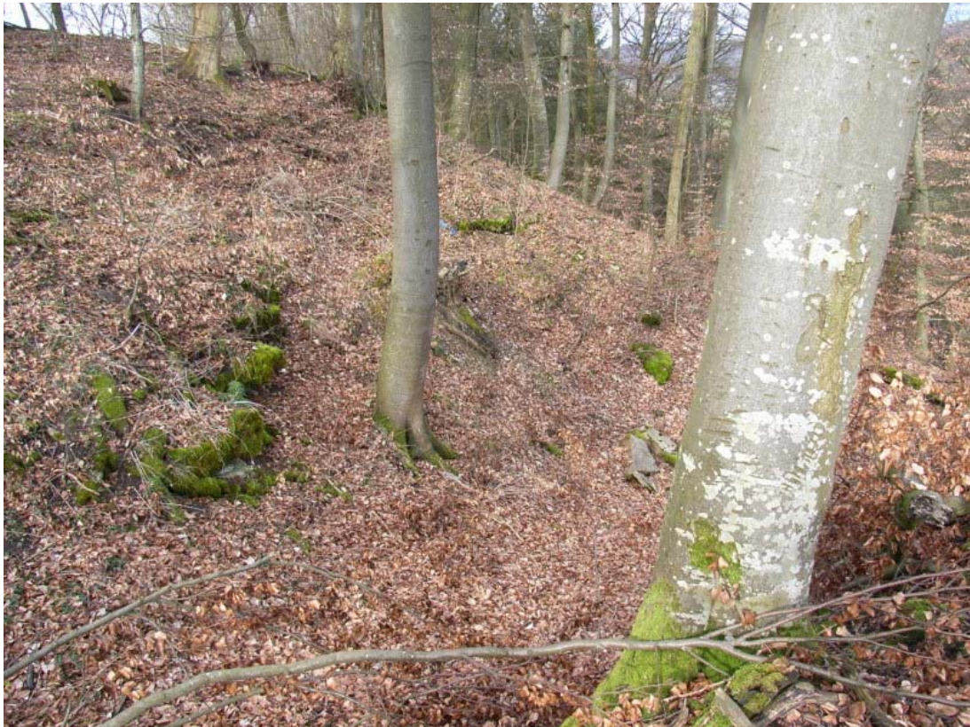
Burggelände von Westen

Unterhalb dieses Bergspornes verläuft ein Verbindungsweg im Tal des Erlenbaches zum Neckartal hinunter.