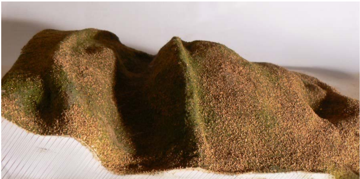
Heutiger Befund ohne Baumbestand

Betritt man den Wald von Norden, dann ist ein bis zu 12 Meter hoher Wall eines einstigen Vorwerkes sichtbar, welcher den Burgstall sichelförmig vom Bergsporn abtrennt. Vor diesem befand sich einst ein Graben, dessen Reste noch links und rechts am Hang vor dem Wall sichtbar sind. Der restliche Graben wurde durch die landwirtschaftliche Nutzung am Waldrand zerstört. Wall und Graben dienten als Annäherungshindernis für eventuelle Feinde, die sich von dieser Seite, der sogenannten Berg- oder Angriffsseite, näherten.