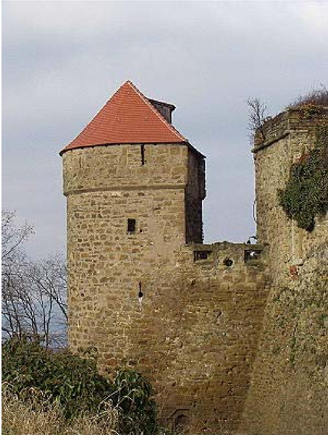
Der Pulverturm auf der Westseite