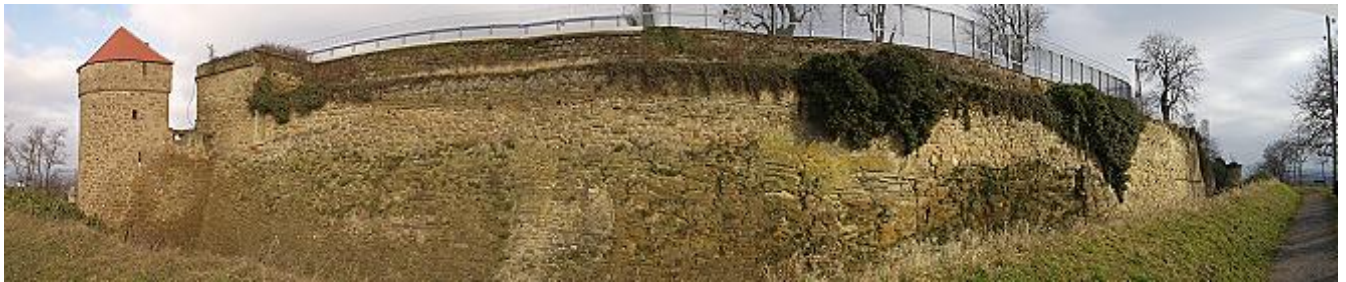
Westseite der Anlage, links der Pulverturm

Von der Autobahn A 81 in Höhe von Ludwigsburg ist der strategisch gut gelegene Bergkegel sichtbar und ist über die Ausfahrt Ludwigsburg Nord in Richtung Asperg erreichbar.