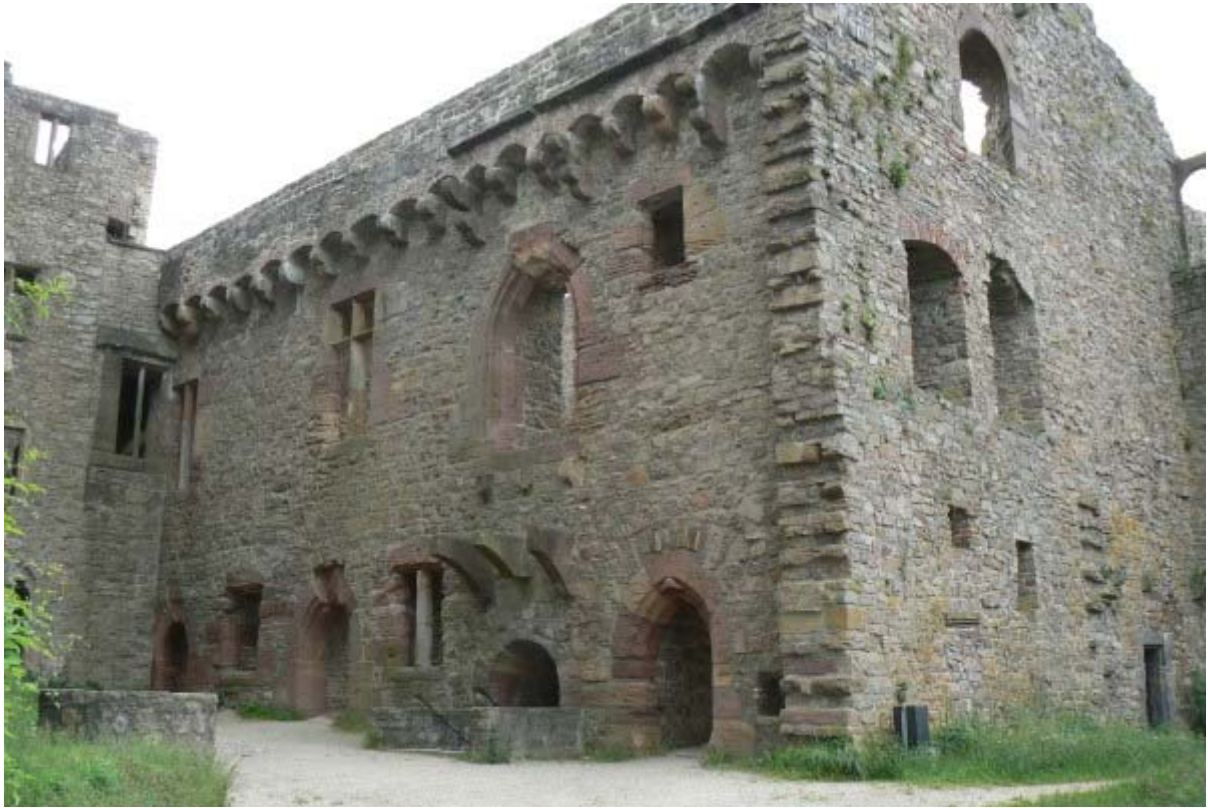
Bernhardsbau von Nordwesten gesehen 9

Im ersten Stock ist ein kleiner Raum auf der Nordseite begehbar, die sogenannte „Loge“ . Die Decke mit Birnstabrippen und Hohlkehlen sowie mit den Wappen von Baden und Oettingen geschmückt, Nischen und eine Vertiefung (für Weihwasser?) lassen eine sakrale Nutzung erahnen. Auch die Nähe zur Burgkapelle im nördlichen Jakobsbau lässt dies vermuten. Hier verweisen wir auf die ausführliche Forschung von Wagner/Dendler 10 .