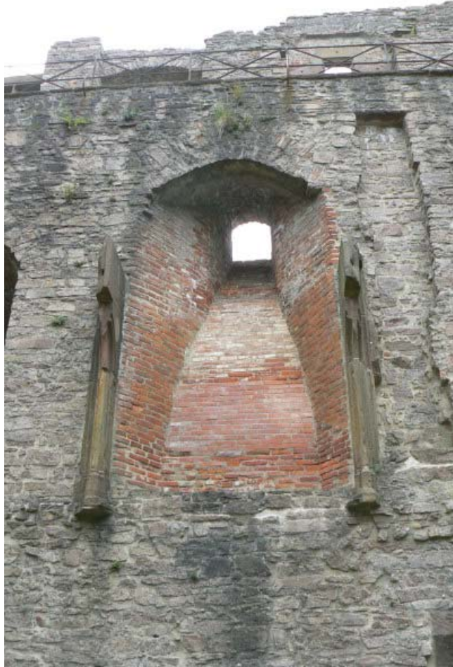
Kamin im Bernhardsbau