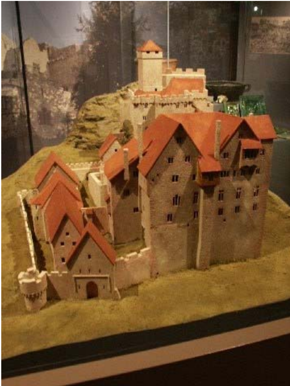
Modell der Burg von Südwesten gesehen