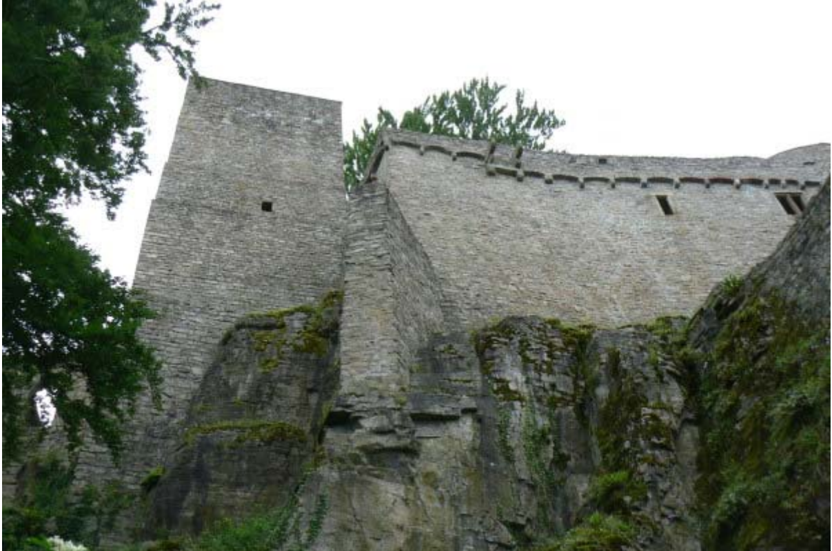
Bergfried und hoher Mantel von Western gesehen