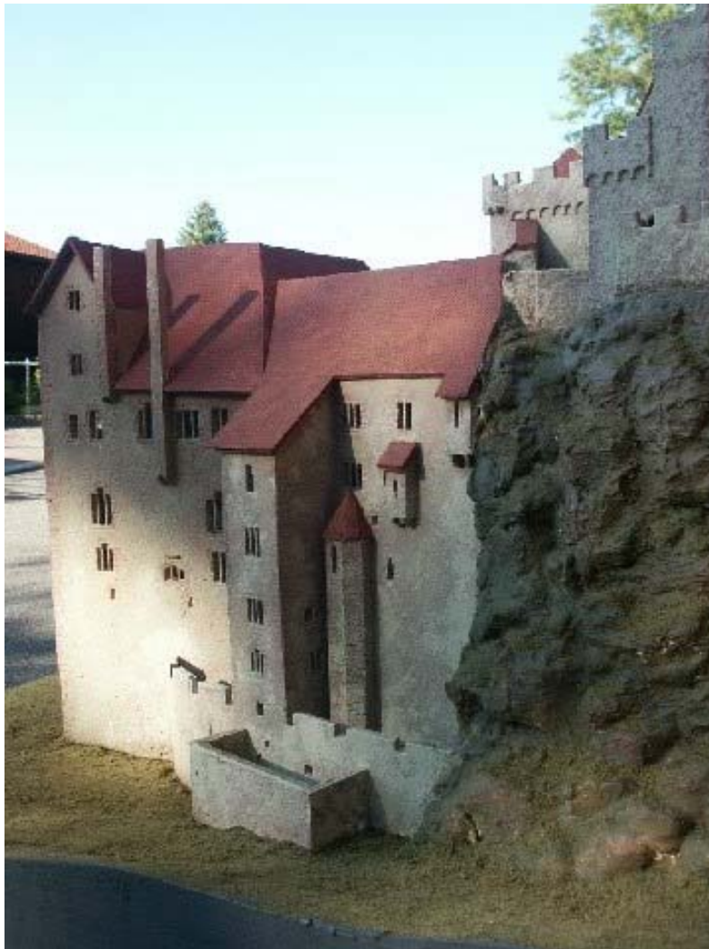
Modell des Bernhardsbaues von Südosten 13

Die Anlage wurde vermutlich durch Blitzschlag Ende des 16. Jahrhunderts zerstört. Heute ist die Ruine am Fuße des Nordschwarzwaldes ein beliebtes Ausflugsziel. Im Landesmuseum Karlsruhe befindet sich ein Modell der Ruine, welches durch Marco Keller und einem weiteren Burgenforscher erbaut wurde.