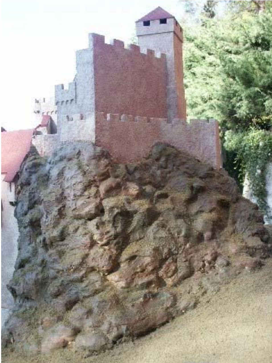
Modell der Kernburg von Osten gesehen