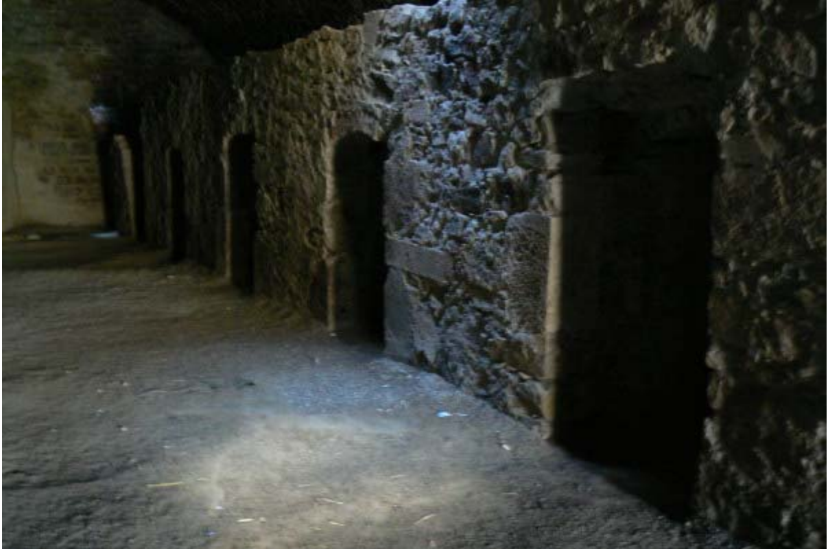
Zellen im Kellergewölbe

Der letzte, spätgotische Ausbau erfolgte unter Jakob I. Dabei wurde der Jakobsbau zwischen dem Bernhardsbau und dem oberen Burgfelsen errichtet. Die dort schon vorhandene Kapelle wurde umgebaut und ein Chorturm auf der Westseite errichtet. Ebenso ein steiler Treppenzugang von der Oberburg zum Jakobsbau, dessen Fragmente am Hohen Mantel der Oberburg noch sichtbar sind und heute ins Nichts führen. Auch ein Zwinger auf der Westseite am Fuße der Burg wurde vor einem dort neu in den Zwinger erbauten Ausfallspörtchen errichtet.