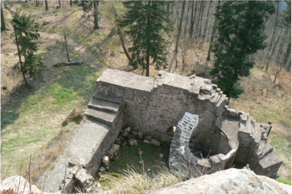
Blick von der Kernburg auf den Palas mit ehem. Treppenturm