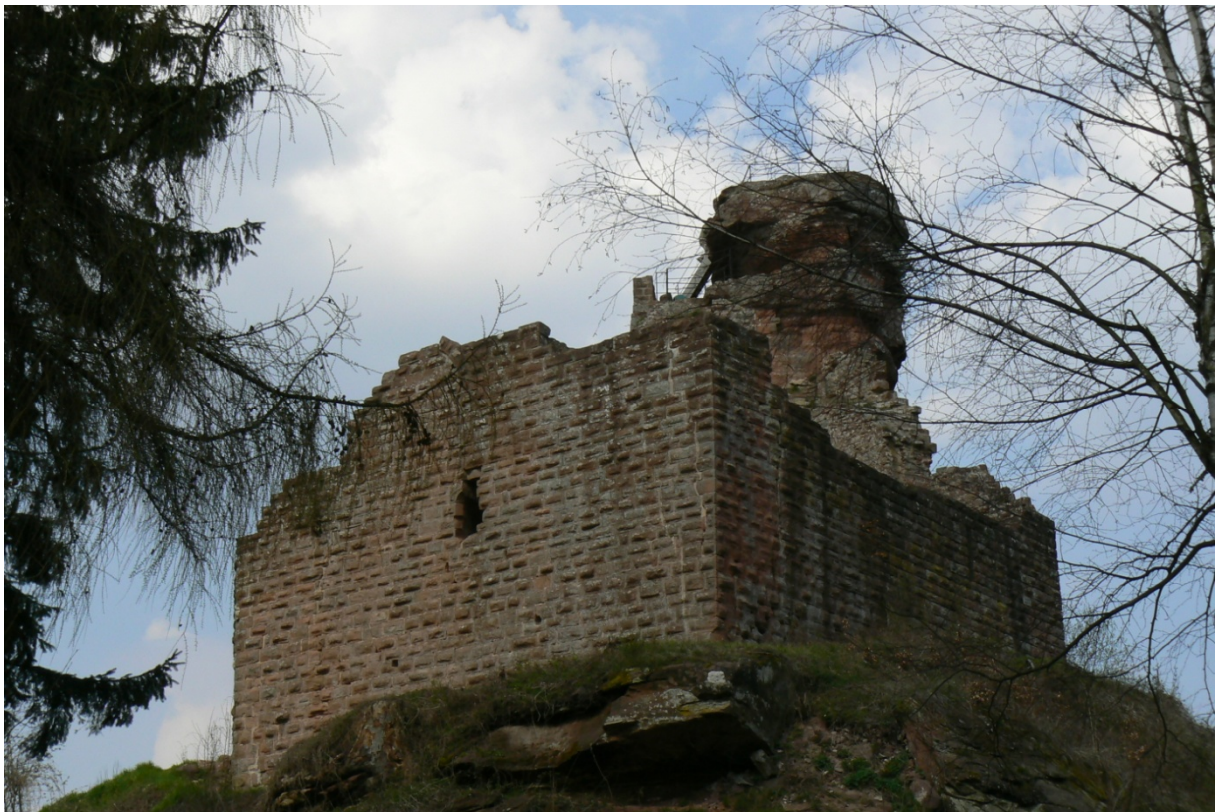
Südwestseite – Palas mit Kernburg im Hintergrund

Einige Kilometer hinter der französischen Grenze befindet sich eine der vielen sogenannten Felsenburgen der Pfalz. Besucher des Dahner Felsenlandes sollten diesen Abstecher unbedingt einplanen. Hoch über der Burg Fleckenstein 1 thront die Hohenburg auf 550 Meter über dem Meeresspiegel. In Sichtweite wurde sie von zwei Fleckensteiner Belagerungsburgen bedroht: Der kleinen Burg Löwenstein 2 und der Wegelnburg . 3