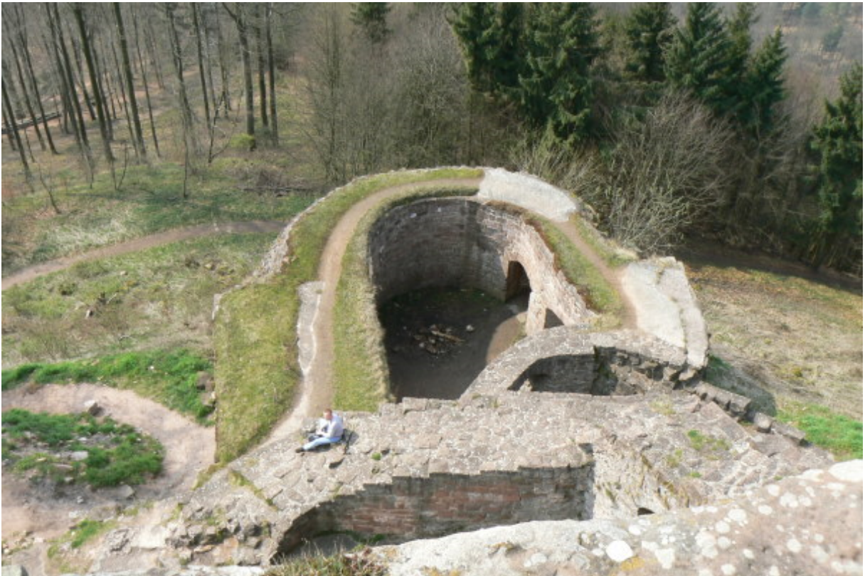
Blick von der Kernburg auf das Rondell