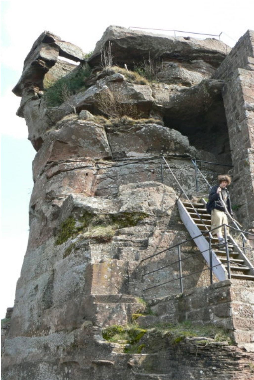
Aufgang hoch zur Kernburg

Ein schmaler Gang führt hoch auf die Plattform, wo keine Mauerreste mehr vorhanden sind. Eine Zisterne hoch oben auf der Plattform speicherte das lebensnotwendige Wasser für den einstigen Bergfried, welcher hier- vermutlich als fünfeckiger Turm- stand.