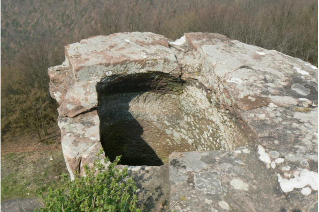
Zisterne oben auf der Kernburg