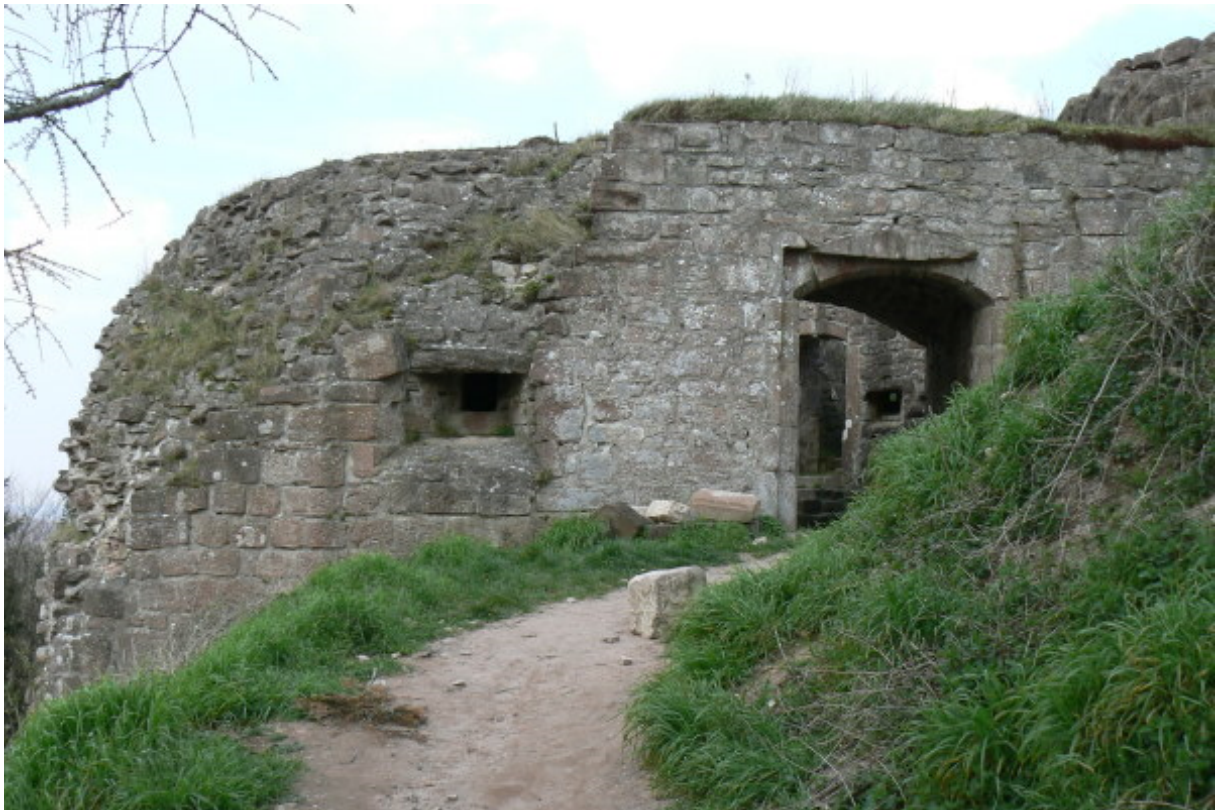
Rondell mit Eingangstor

Die größere Wegelnburg war bereits vorhanden und wurde zur Belagerung von der Nordseite verwendet. Die kleine Burg Löwenstein wurde aber vermutlich für diesen Zweck südöstlich der Hohenburg errichtet. Die Hohenburg wurde sozusagen „in die Zange genommen“. Solche Machtkämpfe gab es auch bei der Burg Eltz und deren Belagerungsburg Trutzeltz. Eine ähnliche Machtprobe gab es zwischen Burg Zwingenberg 5 und der darüber errichteten Fürstenstein 6 am Neckar.