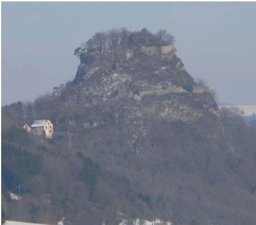
Blick vom Hohentwiel auf den Hohenkrähen

643 Meter hoch erhebt sich der schmale Vulkankegel des Hohenkrähen über dem Tal der Saub aus dem Hegau empor. Der Phonolithkegel selbst ragt aus der Landschaft wie ein hoch gemauerter Turm heraus und zieht die Blicke des von Norden kommenden Autobahnreisenden auf sich. Erst der zweite Blick fällt dann auf den wesentlich mächtigeren, südlich davon gelegenen Hohentwiel 1 mit seiner gleichnamigen Festung. Auf dem schmalen Fels des Hohenkrähen haben die einst schwindelfreien Erbauer ihre Burg errichtet, deren Ruinenreste sich romantisch in den Himmel erheben.