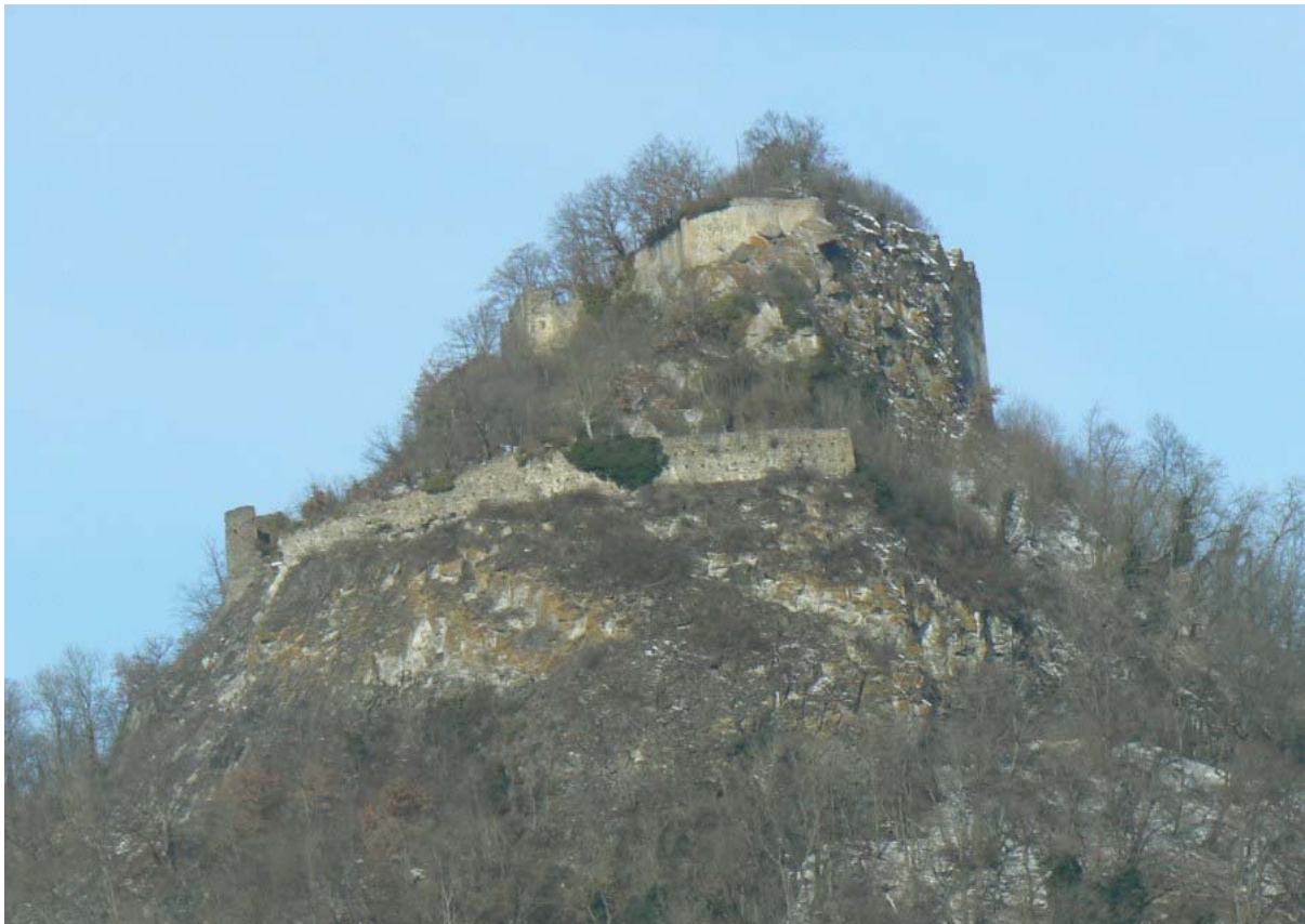
Ruine von Südosten gesehen- unten die „Mittelburg“, darüber die „Österreichische Bastion“

Die Mauerreste auf der Nordostseite stammen vom Palas. Hier sind noch Gewölbe begehbar. Von einem wesentlich tiefer in den Hang erbauten Zwinger, der „Mittelburg“, erfolgt hier ein steiler Aufstieg zum Burgtor. An der Südostecke wird die Mittelburg von der „Österreichischen Bastion“ der Kernburg überragt. Weitere Zwingermauern finden sich auf der Süd- und Westseite des Bergkegels. Dort sind zwei Zwinger durch einen Torturm verbunden. Die Vorburg liegt im abgeflachten Hangrand auf der Südwestseite. Hier stehen die zwei „Burghäuser“. Die Westseite war die einzige gefährdete Seite zur 600 Meter hohen, westlich gelegenen Anhöhe. Auf dem Bergplateau sind Reste von Zisternen sichtbar. Das Sammeln von Regenwasser war die einzige Möglichkeit, sich mit Trinkwasser zu versorgen.