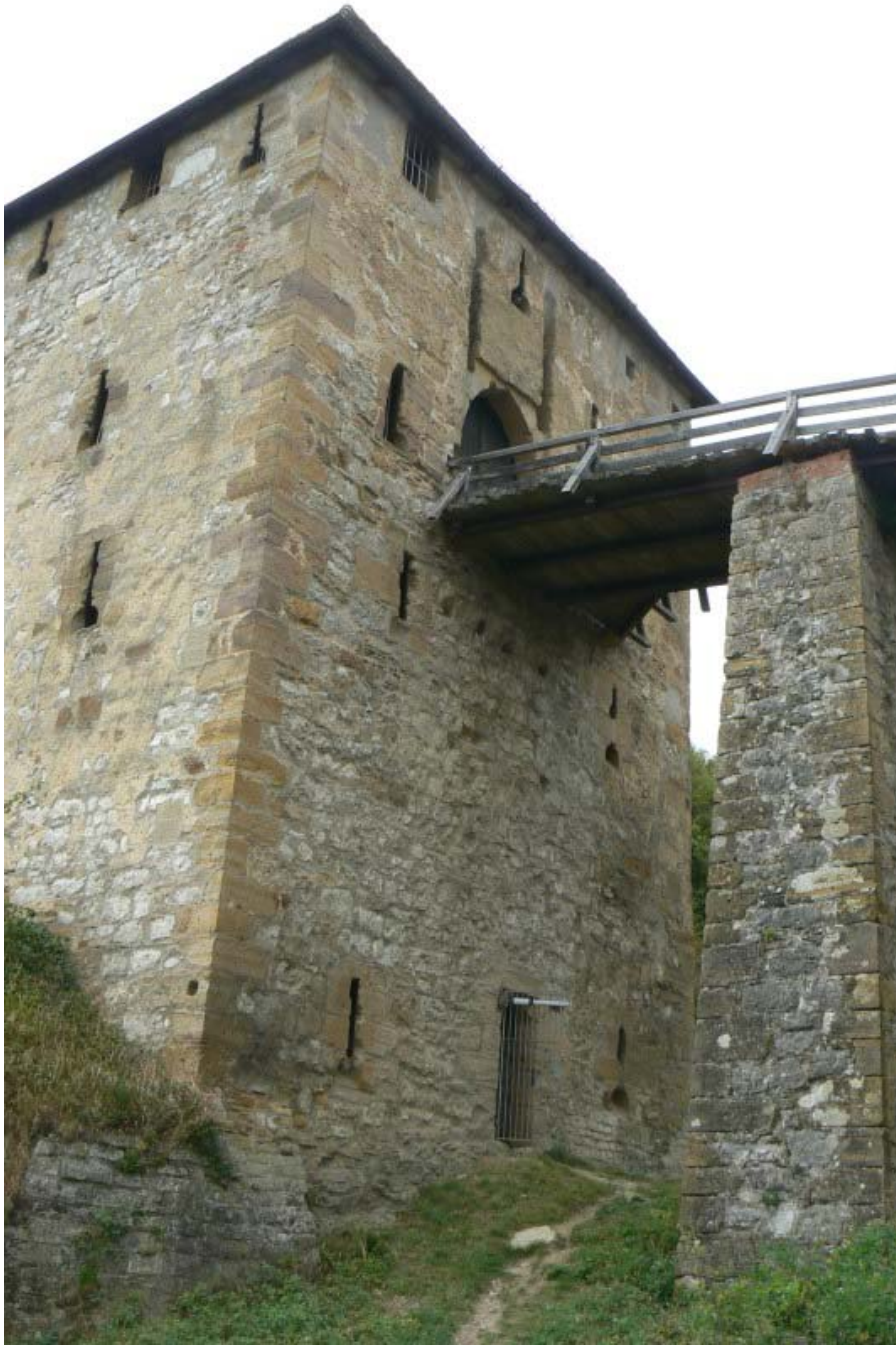
Torhaus vom Äußeren Zwinger gesehen

Der innere Zwinger verlief einst rund um die Kernburg, ist aber auf der Nord- und Ostseite nicht mehr vorhanden. Beachtenswert sind die kleinen staufischen Rundbogenfenster in der Südseite des Palas, welche sich nach innen hin verjüngen. Ebenso erwähnenswert sind die schönen Buckelquader mit Randschlag und Zangenlöchern, die vermutlich durch den Brand 1865 rotbraun verfärbt wurden. Auch ein hoher Eisenanteil des Sandsteines könnte diesen Effekt ausgelöst haben. Die Kernburg betritt man im Süden und erreicht den kleinen zwingerartigen fast dreieckigen Lichthof, an dessen Nordseite der Westbau mit Gewölbekeller grenzt.