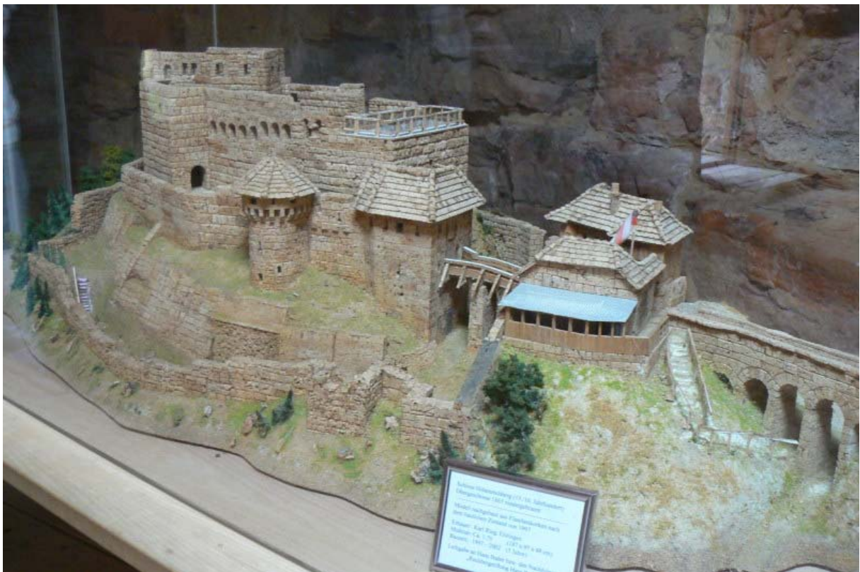
Modell der Bebauung im 15./16. Jahrhundert