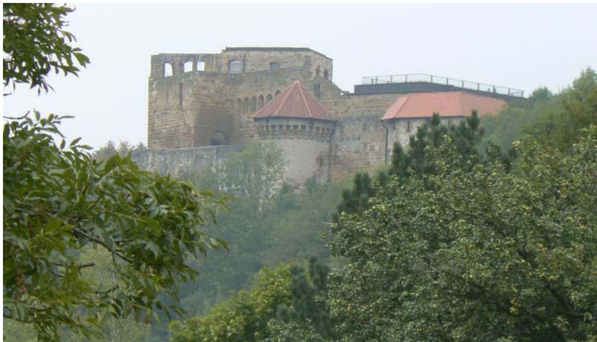
Burg vom Ort Hohenrechberg gesehen

Nördlich der Schwäbischen Alb ragen drei Bergkuppen aus der Landschaft imposant empor. Die drei Kaiserberge Hohenstaufen 1 , Hohenrechberg und Stuifen. Auf dem bewaldeten Bergrücken des Rechbergs dominiert an dessen höchster Stelle eine Wallfahrtskirche. Etwas tiefer, an der spornartig verlaufenden Westseite, erhebt sich die immer noch mächtige Ruine des Hohenrechberg. Zum Schutz der Reichsburg Hohenstaufen dienten mehrere Burgen, welche als Satelliten um die zentrale Burg positioniert waren, u.a. die Wäscherburg 2 und die östlich des Hohenstaufen gelegene Burg Hohenrechberg, auch teilweise Rechberg genannt.