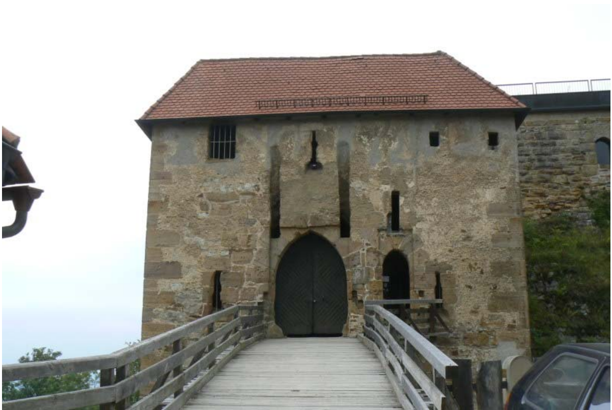
Torhaus von der Vorburg gesehen

Zugbrücken (eine große für Pferde und Wagen und eine kleine für Personen) bedient. Innerhalb des Torturmes, dessen Fundamente bis in den Graben reichen, waren einst drei Geschosse mit Gefängniszellen. Da alle Geschossböden aus Holz waren, konnte bei einem Ausbrennen des Turmes ein Angreifer diesen Torzugang nicht mehr verwenden.