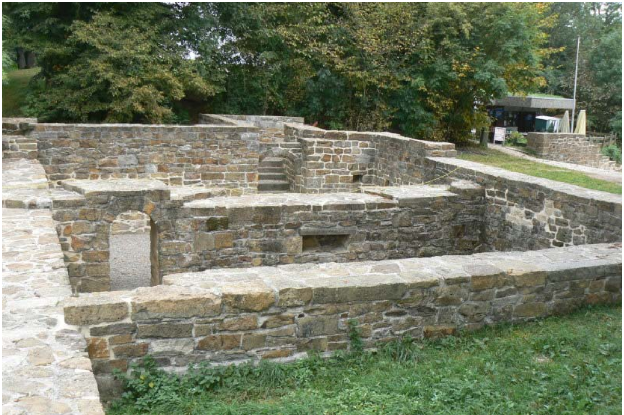
Gebäudereste auf der Nordseite

Um 987 taucht ein Graf Friedrich von Ostschwaben in den Chroniken der Geschichtsschreibung auf, dessen Sohn – auch ein Friedrich- um 1053 Pfalzgraf des Herzogtums Schwaben war. Durch Heirat kam er in Besitz der Gegend um Büren -heute Wäschenbeuren- das Gebiet um den Hohenstaufen. Seine Burg war entweder die Vorgängerburg der Wäscherburg 14 oder der Burren- heute ein Burgstall bei Wäschenbeuren. Sein Enkel wurde 1138 deutscher König und mit ihm und seinen Nachfahren Friedrich I. Barbarossa, Heinrich VI., Philipp von Schwaben, Friedrich II., Heinrich VII. und Konrad IV. glänzte die Herrschaft staufischer Könige und Kaiser bis 1254.