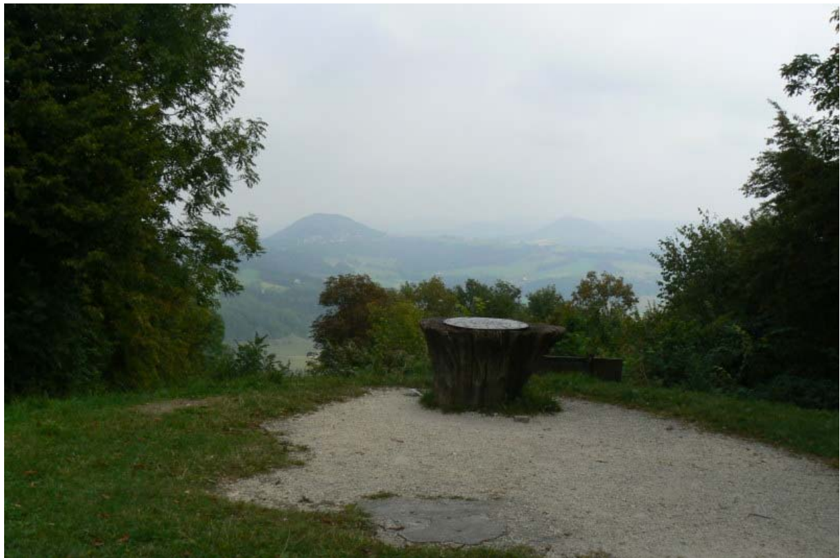
Ostspitze des Burgareals mit Blick auf Hohenrechberg und Stuifen

Nördlich der Schwäbischen Alb ragen drei Bergkuppen aus der Landschaft imposant empor. Die drei Kaiserberge Hohenstaufen, Hohenrechberg 1 und Stuifen. Auf dem kegelförmigen und heute bewaldeten Hohenstaufen stand einst die gleichnamige Gipfelburg des Stauer Kaisergeschlechtes. Von der Stammburg dieses einst bis nach Süditalien herrschenden Adelsgeschlechtes ist leider nur noch wenig sichtbares Gemäuer übrig geblieben.