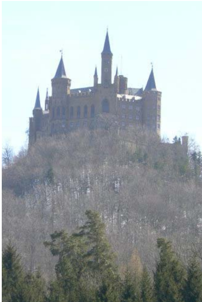
Hohenzollern von Norden gesehen

Von Tübingen erreicht man über die B 27 die Stadt Hechingen, bzw. von der A 81 Ausfahrt Empfingen (Ausfahrt 31) ist der Bergkegel des „Hohen Zoller“ mit der gleichnamigen Burg gut sichtbar. Südlich von Hechingen führt eine Straße zu Parkplätzen unterhalb der Anlage.