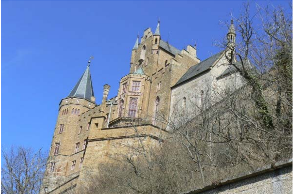
Garten-Bastei mit St. Michaels-Kapelle (rechts)

Kosten spielten bei diesen Bauten keine Rolle, romantische, verspielte Details in Verbindung mit von originalen Burgen und Festungen übernommenen wehrtechnischen Funktionen bieten dem heutigen Besucher eine märchenhafte, aber unwirkliche Kulisse 5 . Blickt man in die Ferne nach Norden über Württemberg im Schatten der mächtigen Mauern mit Ritterfiguren und Denkmälern vergangener Könige gekrönt, könnte man denken, dass hier Tolkien seine Ideen für die phantastische Festungsstadt „Minas Tirith“ für den Roman „Herr der Ringe“ 6 geboren hat.