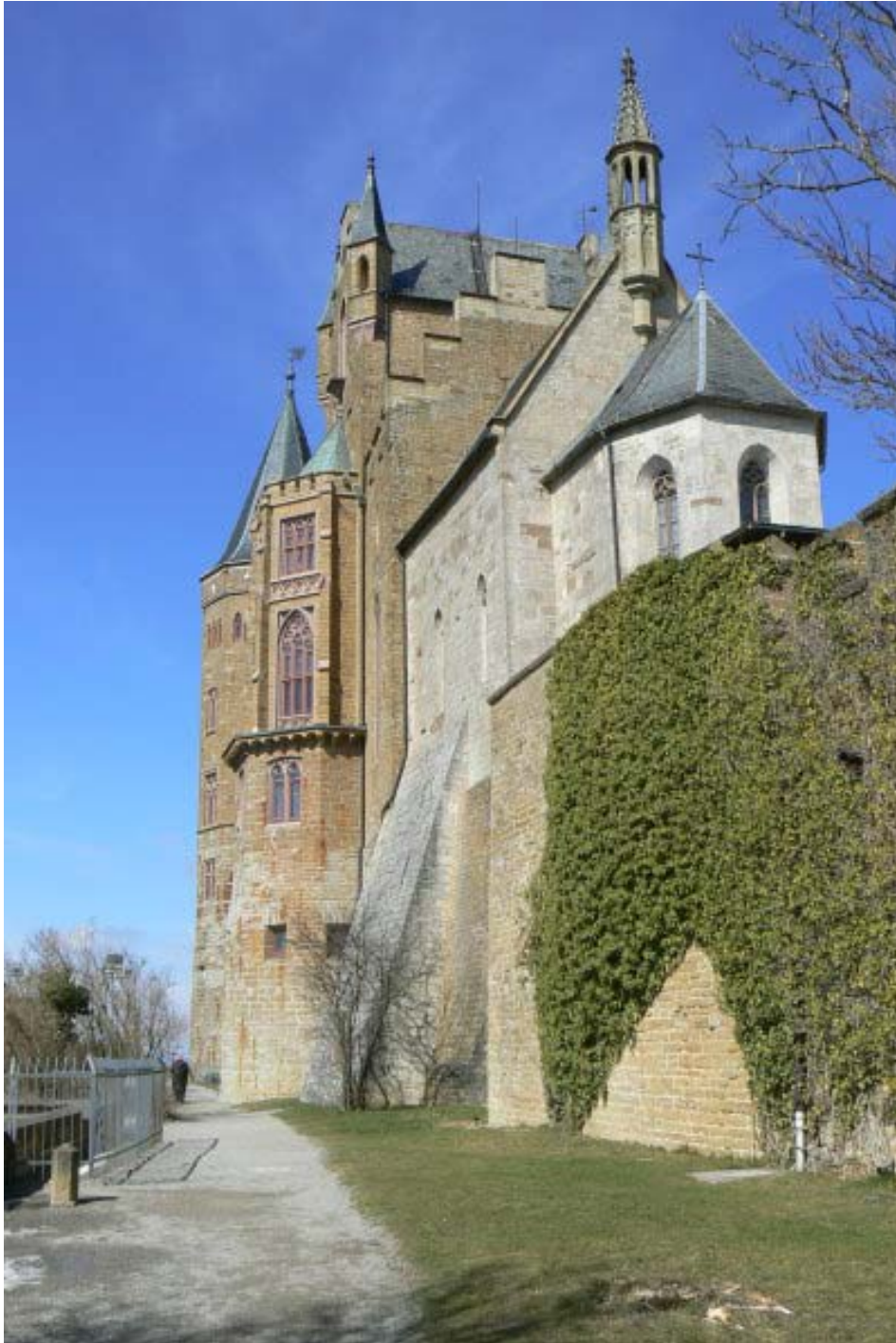
St. Michaels-Kapelle vom Zwinger aus gesehen

Der Besucher erreicht die heute existierende dritte Anlage über eine steil in Serpentina ansteigende Straße (vorbei am sogenannten Wasserturm mit Pumpanlage am Nordwesthang unter der Burg) und erreicht die 850 Meter über dem Meeresspiegel stehende Burg auf dem am Rande der Alb sich erhebenden „Hohen Zoller“.