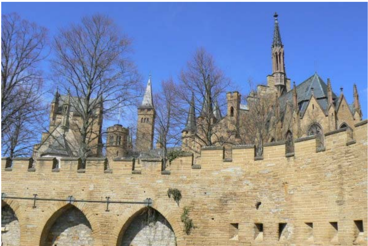
Blick auf die Kernburg von den Auffahrtsrampen

Von 1618-1623 wird der Hohenzollern zur Festung ausgebaut (zweite Anlage) und erhält die heute noch vorhandene zwingerartige Bastionsfestung. Es kommt zu weiteren Besetzungen durch Württemberg (1634) , Bayern (1635-37) und durch die Franzosen (1744-45). Danach fällt die Anlage in militärische Bedeutungslosigkeit. Der preußische Kronprinz Friedrich Wilhelm IV entscheidet sich 1819 für den Wiederaufbau der verfallenen Ruine seiner Vorfahren einzusetzen 14 und beginnt das Projekt als König . 1850 beginnt Prinz Wilhelm I. von Preußen mit dem eigentlichen großen Aufbau der Burg. Er weiht 1867 als König die neue Burg ein. Nach dem Zweiten Weltkrieg werden die sterblichen Überreste von König Friedrich Wilhelm I. und König Friedrich dem Großen bis zur Wiedervereinigung auf der Burg aufbewahrt. 1991 kehrten die beiden großen Könige zur letzten Ruhestätte nach Potsdam und Sanssouci zurück. Aufwändige Sanierungsmaßnahmen erfolgen Ende der 1990er Jahre, 15 u.a. werden Schäden des Erdbebens von 1978 beseitigt.