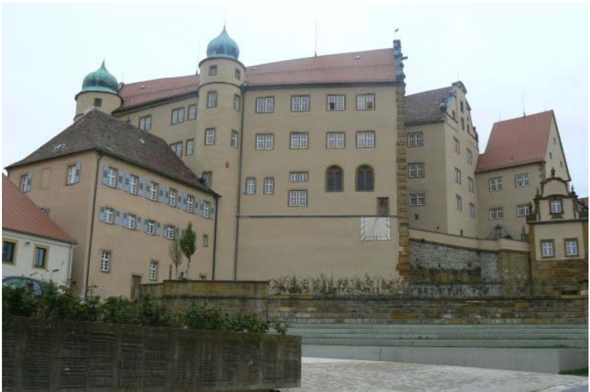
Hochschloss mit Westernachbau -rechts verfüllter Graben mit oberem Torhaus

Vom Jagsttal führt die Straße hoch zum nach Norden verlaufenden Bergsporn, welcher sich kuppenförmig an der Stelle der Schlossanlage über die Umgebung erhebt. Diese strategische Lage wurde einst genutzt, um eine von drei Seiten schwer anzugreifende Burg auf der Felskuppe zu erbauen. Der Ausblick auf die wichtige Fernhandelsverbindung vom westlich gelegenen Neckartal zum östlichen Nördlinger Ries war eine ideale strategische Position. Hier konnte man „kapfen“, d.h. Ausschau halten und die Lage in der Umgebung überwachen. Diese eventuell staufisch gegründete Burg zum „Kapfen“ war an höchster Stelle auf der Kuppe erbaut. Die alte Kernburg- später zum „Hochschloss“ umgebaut- ist noch in ihren Konturen erahnbar. Nördlich des heutigen Baukomplexes ist noch eine Zwingermauer mit Halbrundturm erkennbar, ebenso eine weitere vorgelagerte Zwingermauer, von der noch Reste erkennbar sind. Die Fundamente des Hochschlusses sowie die Grundmauern der Rundtürme und Teile des Kaplaneigebäudes (Grombergbau) mit integriertem Rundturm (Vogelturm), dürften aus der Anfangszeit der Burg stammen.