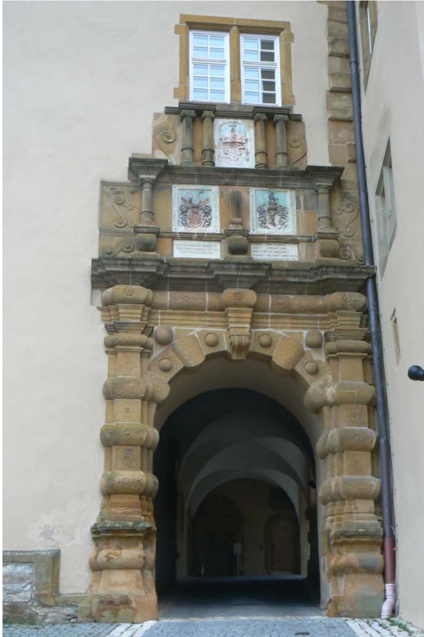
Tor des Westernachbaues

in den Zwischenhof, welcher vom mächtigen Giebel des Westernachbaues überragt wird. Der im Renaissancestil verzierte Treppengiebel und das wappengeschmückte Renaissancetor mit Bossenpilastern und schmuckreicher Sopraporte 5 lädt zum Eintritt in das Hochschloss ein.