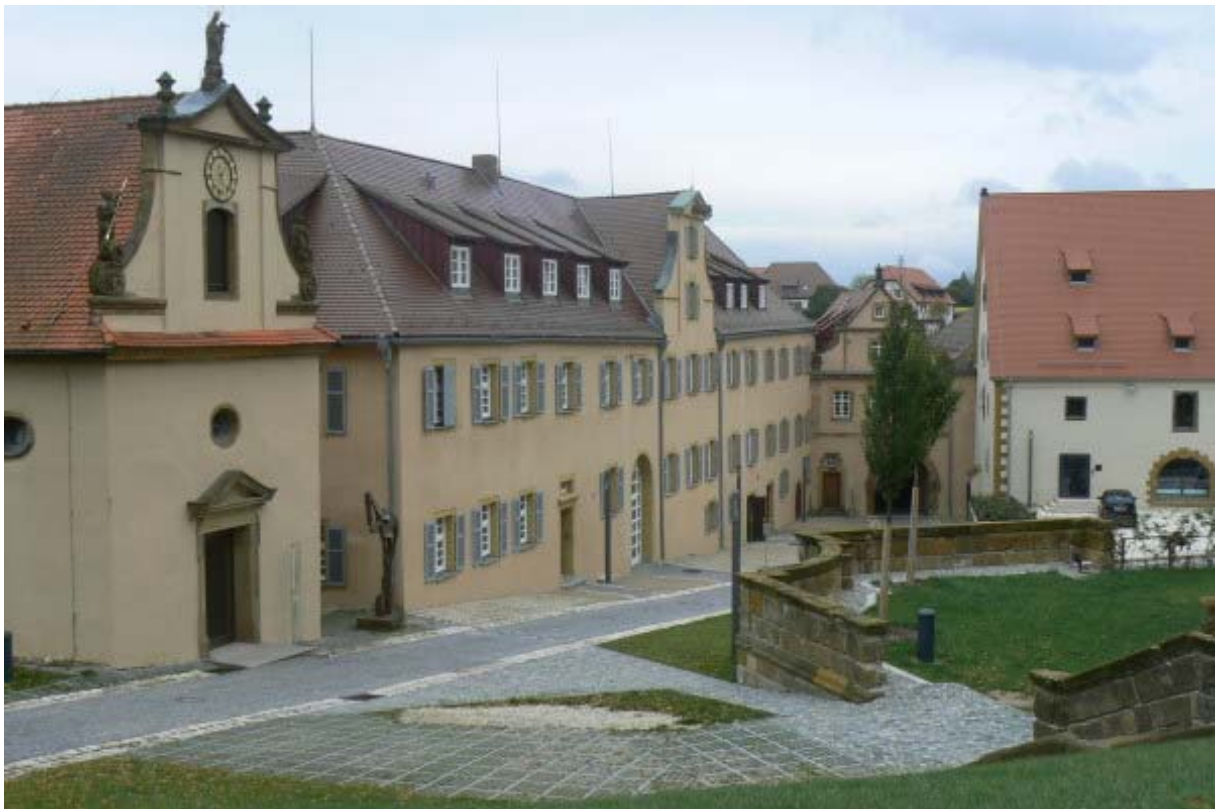
Unteres Schloss mit Lorenzkapelle, Forstamtgebäude und ehemaligem Bräuhaus (links)

Im Dreißigjährigen Krieg geplündert wurde die Kapfenburg 1634 wieder Sitz des Deutschen Ordens. 1805/06 ging die gesamte Anlage in den Besitz von Württemberg 14 über. Ab Ende des 20. Jahrhunderts wird die Kapfenburg als Heimatmuseum und dann als Musikakademie genutzt.