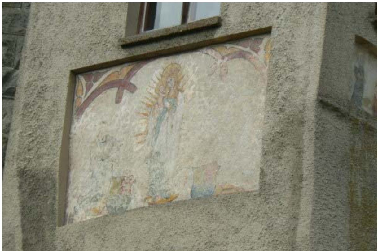
Außenwand der Kapelle

Die gesamte Anlage liegt wesentlich tiefer wie das südlich gelegene Gelände. Größe und Lage der Burg machten eine effektive Verteidigung eher unmöglich und das schwächte die militärische Bedeutung der Anlage. Auf der Ostseite, wo Reste von Wirtschaftsbauten erkennbar sind, wurde die Burg durch einen heute teilweise verfüllten Abschnittsgraben und einen Zwinger geschützt. Hier befindet sich auch der Zugang durch ein Gebäude zum Burghof. Weitere Gebäude befinden sich in Randlage auf der Ost- und Südostseite zwischen dem Eingang und dem Bergfried. Diese Gebäude, sowie die etwas aus der Mauer hervorragende Kapelle des Heiligen Laurentius, sind in die Mantelmauer der Burg integriert. An der Außenwand der Kapelle ist noch das verwaschene Abbild einer Marienfigur zu erkennen. Im Inneren der Kapelle wurden unter barocken Bildnissen spätgotische Fresken entdeckt und freigelegt. Die Fresken zeigen einen Bildzyklus aus der Zeit um 1250 bis 1280, der Zeit des Übergangs von der Spätromanik zur frühen Gotik. 11