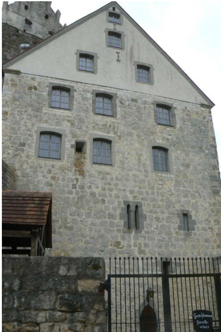
Palas 10 von der Hofseite gesehen