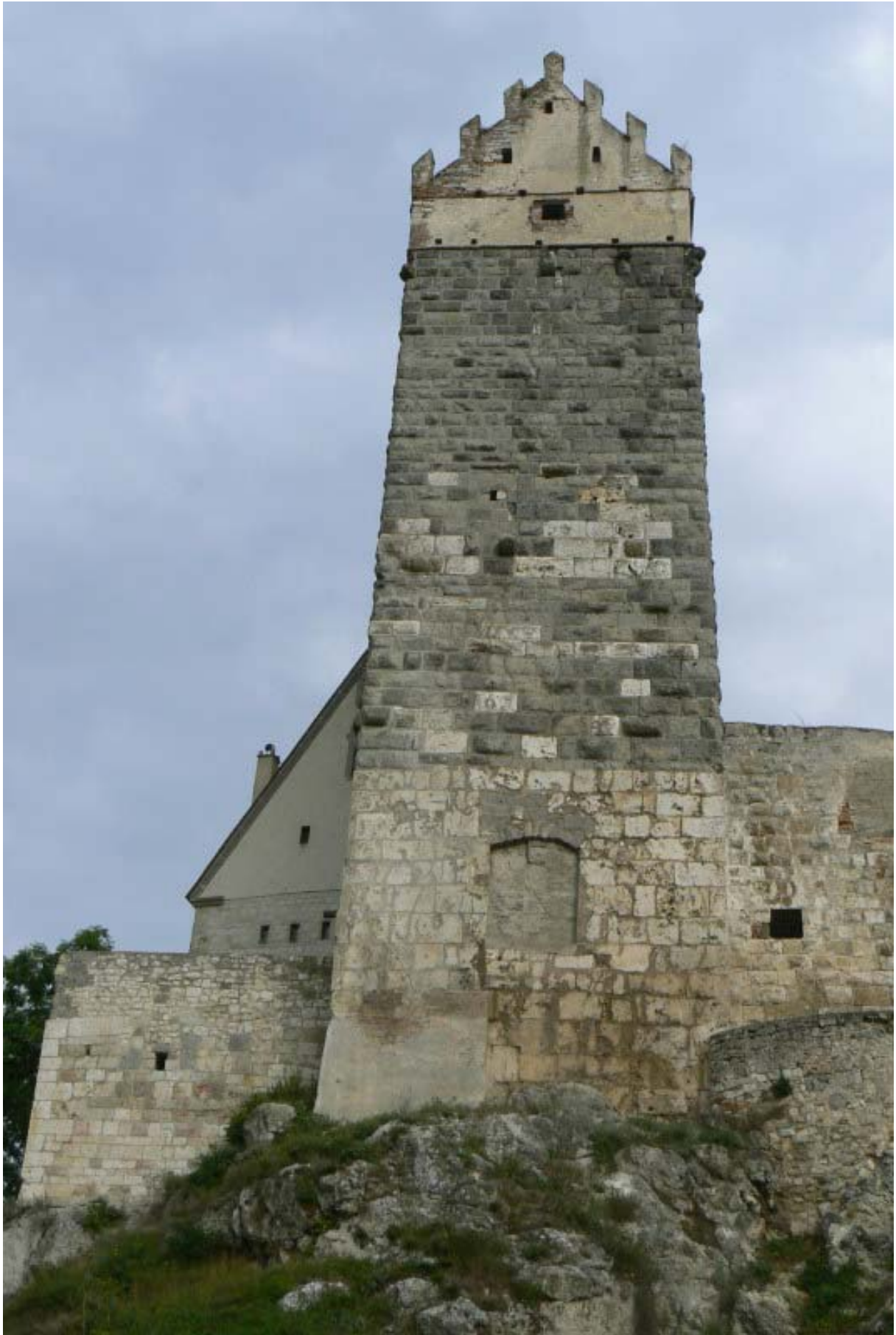
Südseite des Bergfrieds