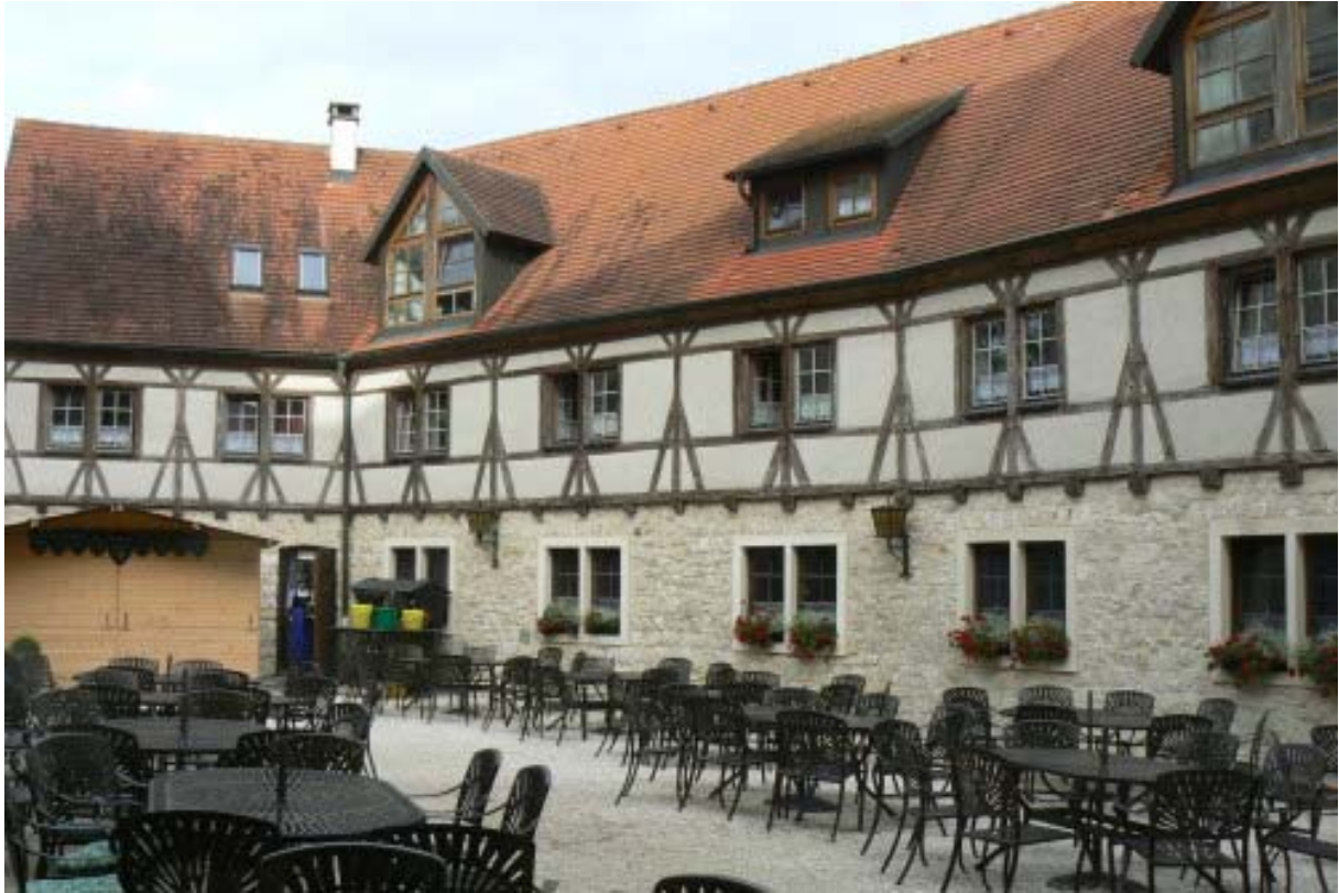
Hof mit Nordgebäude

Ausflugstipp: Abtei in Neresheim und Schloss Taxis 18