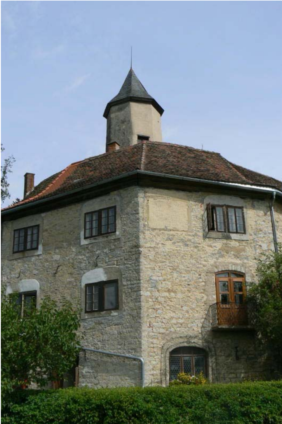
Südseite mit Treppenturm