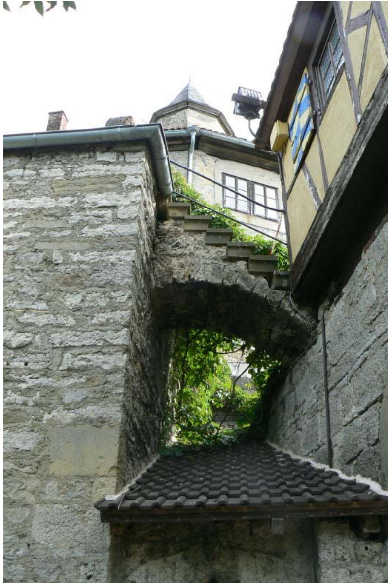
Detailansicht am Tor