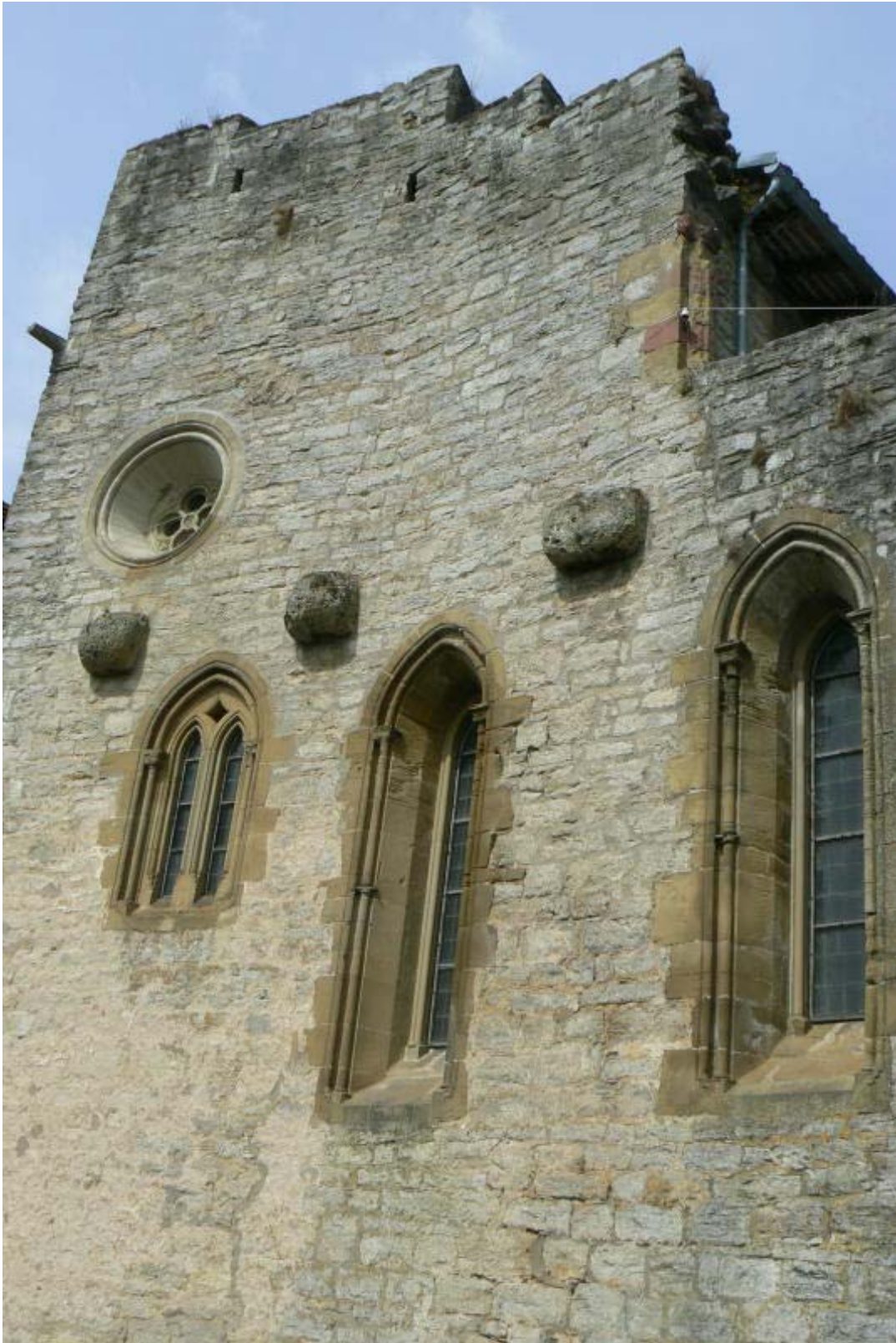
Außenmauer der Kapelle