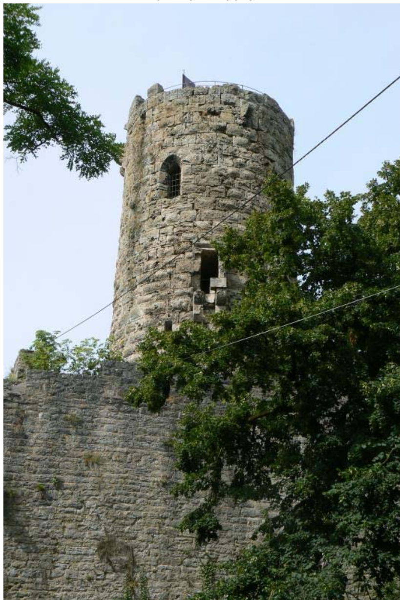
Bergfried und Schildmauer