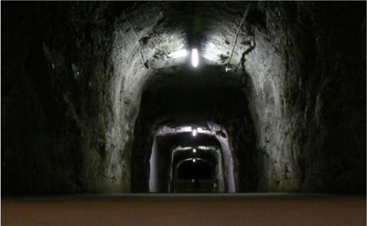
Gang durch das Bergwerk in ca. 200 Meter Tiefe 5