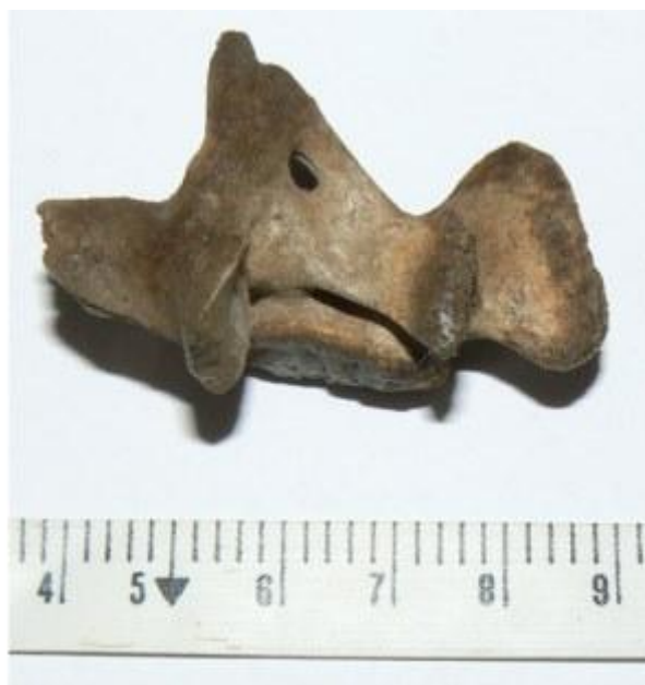
Knochenfragment (Lesefund) 15