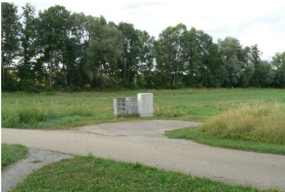
KZ-Areal von Südwest- vorne an den Stromverteilern befand sich etwa der Eingang mit dem Schild „Arbeit macht frei“ 14