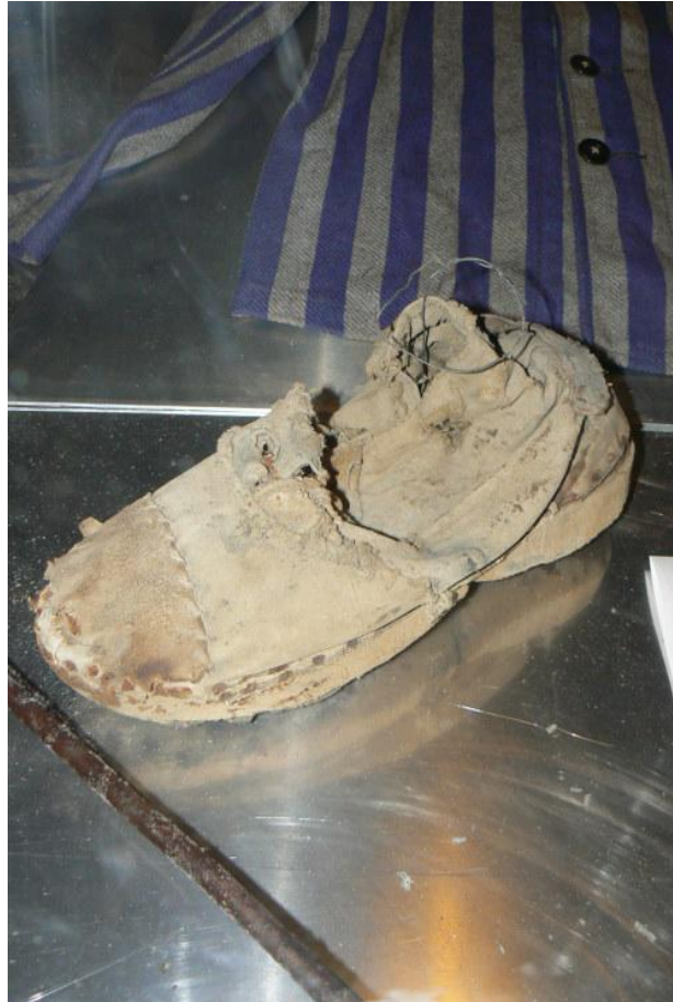
Holzschuh aus dem Bergwerk

Heute erinnern die Ausstellung im Bergwerk, ein Massengrab in der Nähe von Kochendorf (am Reichertsberg) sowie eine Gedenktafel am KZ an das Grauen vergangener Zeit.