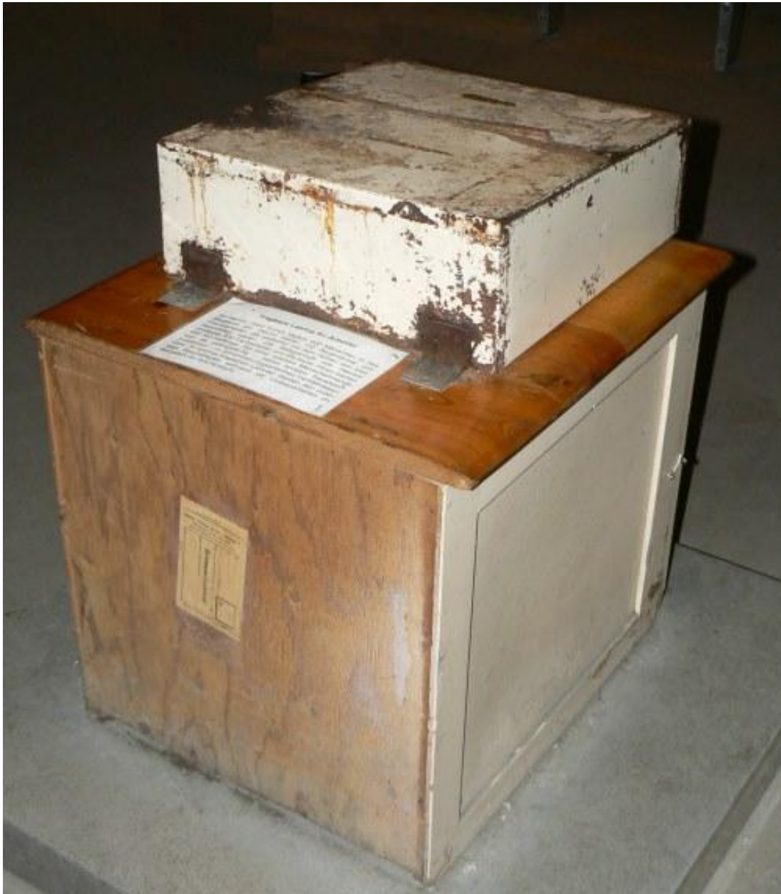
Tragbare Latrine für die Arbeiter im Bergwerk