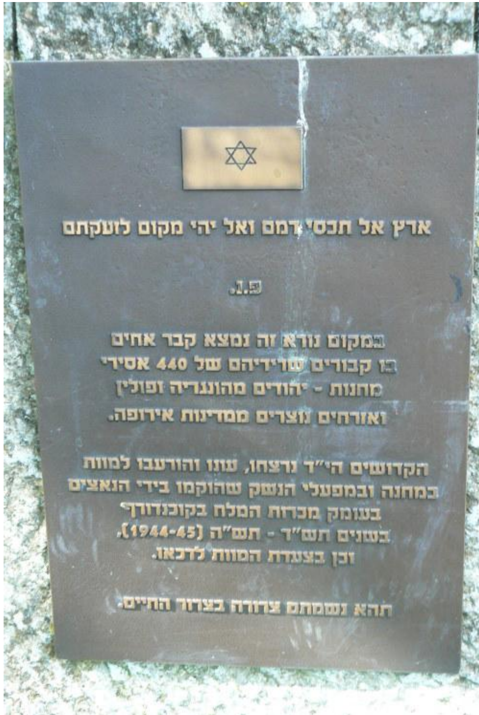
Eine der Gedenktafeln am Massengrab Reichertsberg am Rande des Ortsteiles Plattenwald 16

Le temps passe reste le souvenir a ceux disparus dans la tourment