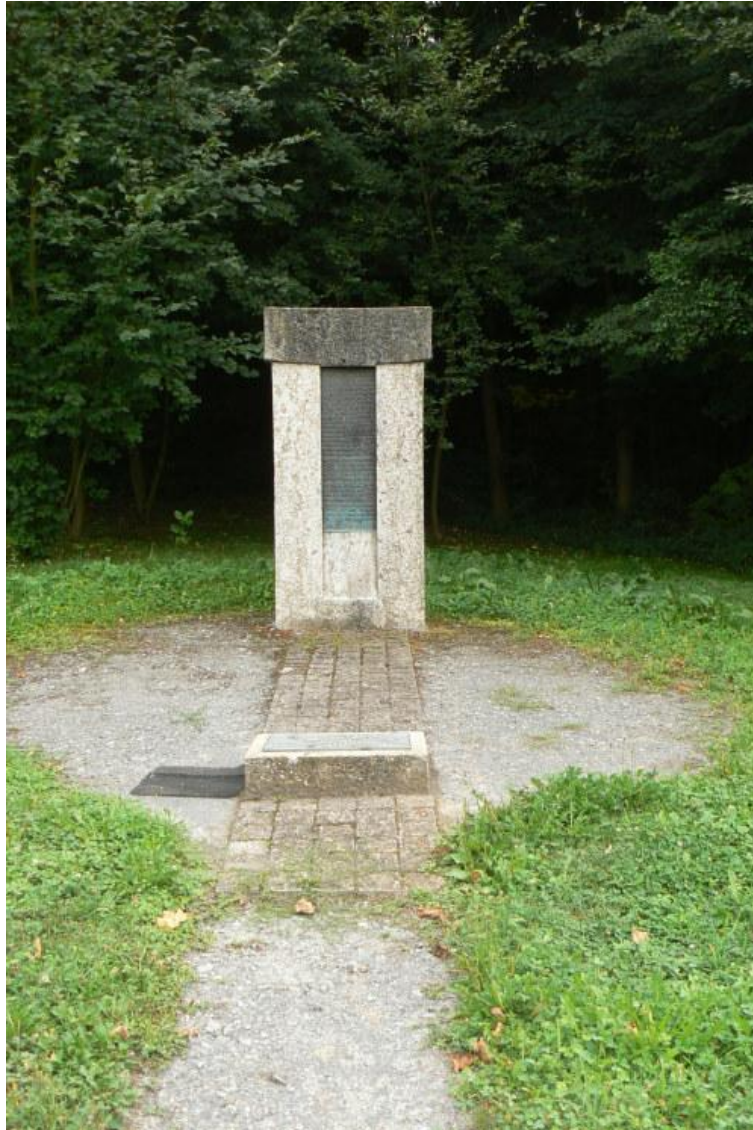
Gedenkstätte im Bereich der Lagerverwaltungsbaracken