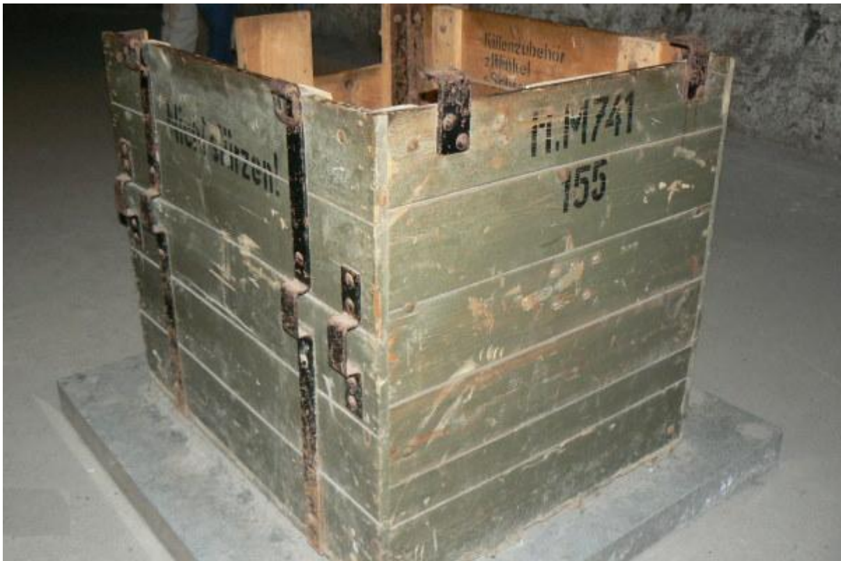
Kiste für Halbfertigteile, welche Heinkel für den Konkurrenten BMW weiterverarbeitete (Für Flugmotor BMW 801 J – einer der leistungsstärksten Motoren der deutschen Luftwaffe)

„Arbeitsgemeinschaft Getriebebau“ zusammenarbeiteten, verlagerten die Produktion ins Bergwerk. Einige dieser Firmen existieren heute noch als erfolgreiche Unternehmen, an andere erinnern noch Straßennamen in Heilbronn. Da ein Volltreffer des Kochendorfer Schachtes das Ende für die dortige Produktion und den Tod tausender Arbeiter bedeutet hätte, wurde 1944 das KZ-Kochendorf angelegt, um schwerpunktmäßig in dem Projekt „Eisbär“ den Schrägstollen und einen weiteren Schacht zu erbauen. 10