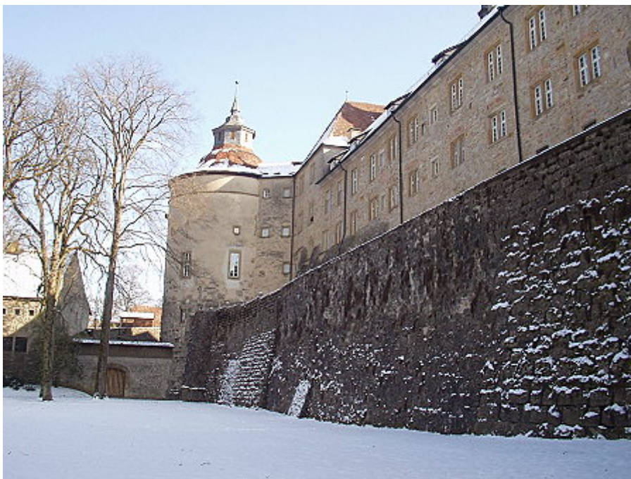
Nordseite mit Bettenturm