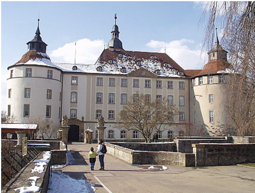
Ostseite mit Kapellen- und Bettenturm

Hoch über dem Jagsttal thront das mächtige Schloss Langenburg auf einem Bergsporn. Auf der Bergseite befindet sich - ähnlich wie bei der Hohenloher Waldenburg 1 - das gleichnamige Städtchen Langenburg, welches durch seine Stadtbefestigung strategisch vermutlich einst die Funktion einer Vorburg hatte.