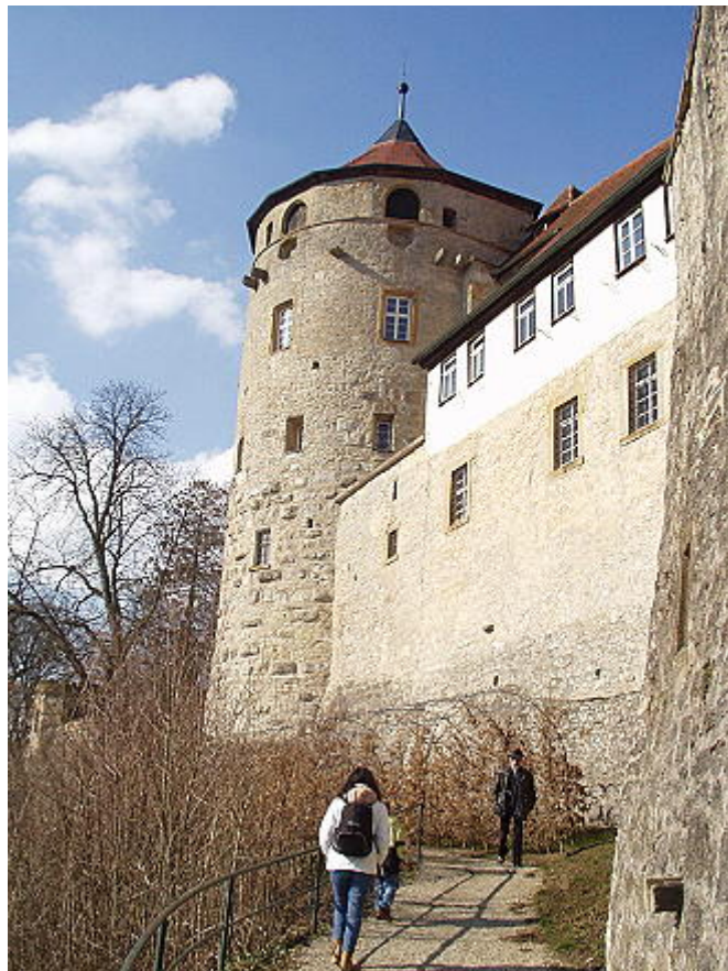
Südwestseite mit Archivturm

1226 wird Langenburg bereits als "castrum" erwähnt. 1234 wird die vorhandene Burg bereits zerstört, 1235 wieder aufgebaut 5 . Fleck vermutet, dass diese neu errichtete Anlage bereits die Größe der heute vorhandenen Schlossanlage hatte. Der nächste große Umbau, von Graf Wolfgang II um 1575- 1587 geplant aber erst unter seinem Sohn Phillip-Ernst 6 realisiert, wurde im Stil des Renaissance 1610 bis 1616 verwirklicht 7 . In dieser Zeit entstand auch der heute als Automobilmuseum genutzte Marstall – und Wirtschaftsbaus vor den beiden Gräben zwischen Schloss und Ortschaft. U.a. wurden mehrere Treppentürme im Hof errichtet und die Fassaden teilweise modifiziert. Ab 1756 erfolgte der spätbarocke Umbau des Ostflügels. 1963 wurde der Nord- und Ostflügel bei einem Brand stark in Mitleidenschaft gezogen. Durch einen sorgfältigen Wiederaufbau sieht der Besucher heute aber keine Schäden mehr.