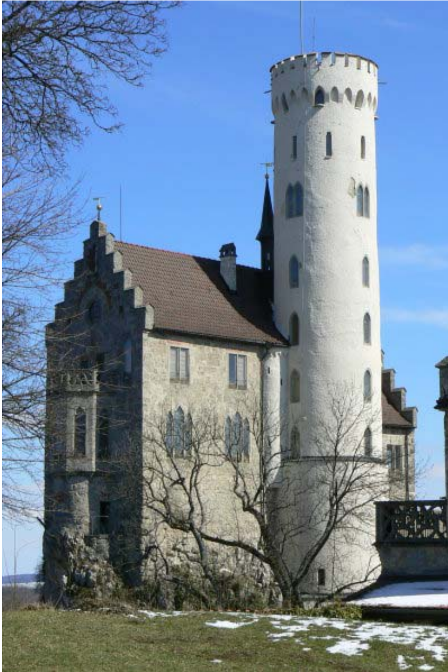
Hauptschloss mit Rundturm