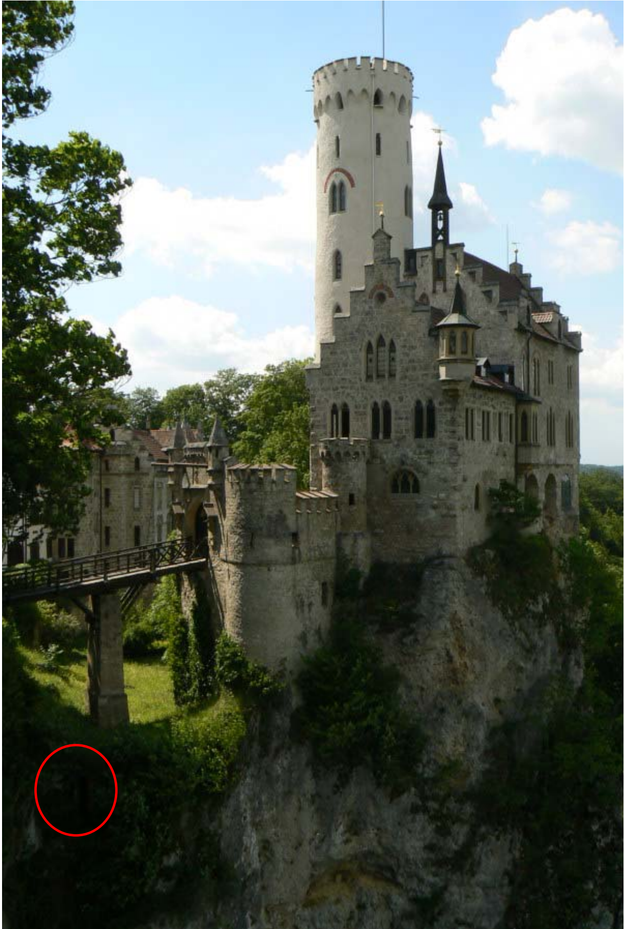
Südseite (roter Kreis zeigt den Ausgang der Fluchtpforte)