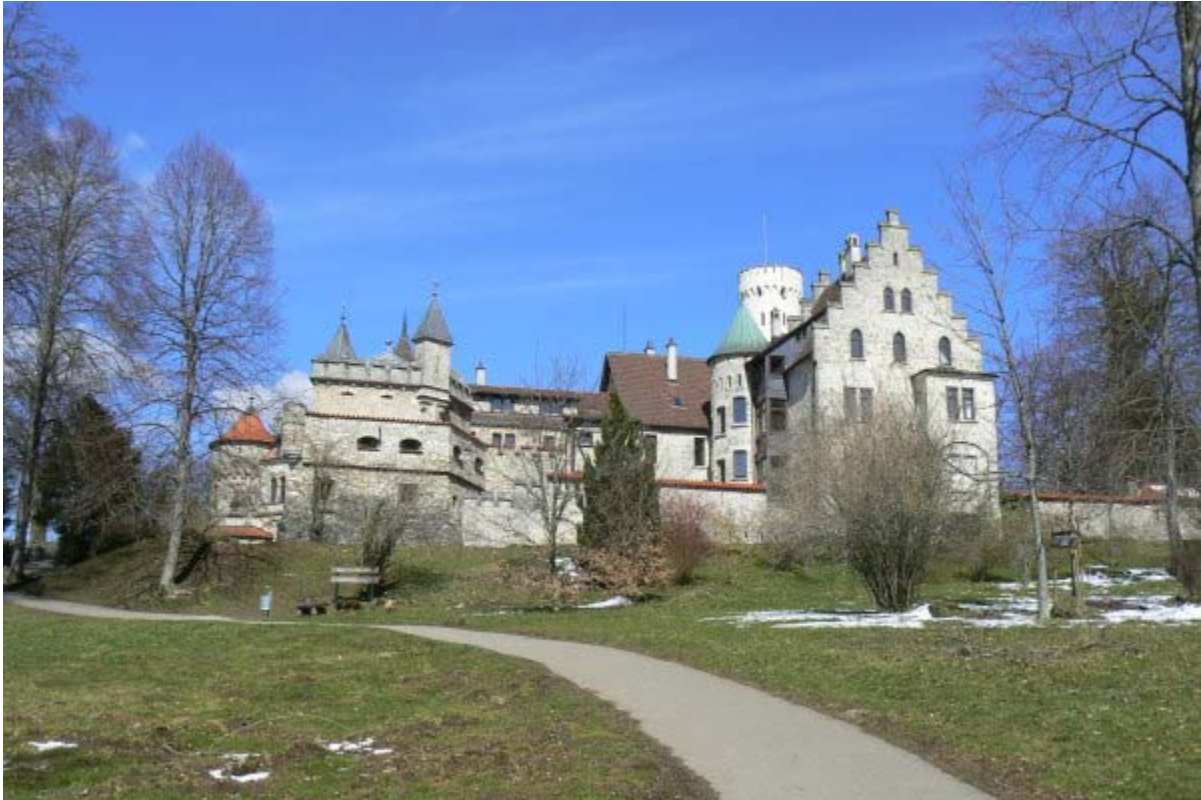
Eugenie-Bastion (links) Verwaltung, Ritterbau und Fürstenbau (rechts)

Kosten spielten bei diesen Bauten keine Rolle. Romantische, verspielte Details in Verbindung mit von originalen Burgen und Festungen übernommenen wehrtechnischen Funktionen bieten dem heutigen Besucher eine märchenhafte aber unwirkliche Kulisse. Der kühn hoch aufragende Fels verstärkt diesen Eindruck ins Romantische. 5 Ziel war bei diesem Neubau „eine deutsche Ritterburg im edelsten Stil des Mittelalters zu erbauen, die an Kühnheit der Lage, Festigkeit der Bauart und Bequemlichkeit im Inneren, gepaart mit edler Schönheit, Schloss Eberstein und selbst das berühmte Hohenschwangau übertreffen sollte 6 “. Interessant, dass der Grundriss des Hauptschlusses dem Grundriss der Kernburg des wenige hundert Meter südöstlich gelegenen Alt-Lichtenstein ähnelt. Auch hier wurde ein Rundturm (Bergfried) mit einem palasartigen Wohnbau auf engstem Raume kombiniert.