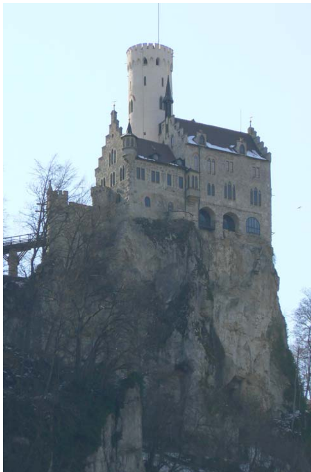
Lichtenstein im Morgennebel vom Tal aus gesehen

Von Reutlingen aus erreicht man über die B 312 das südlich gelegene Örtchen Lichtenstein über dem sich auf der Südwestseite am Rande der Felswand das Schloss Lichtenstein märchenhaft unwirklich erhebt. Vom Tal aus ist das Schloss ausgeschildert und mit dem PKW kann die Anlage auf dem Bergplateaus erreicht werden.