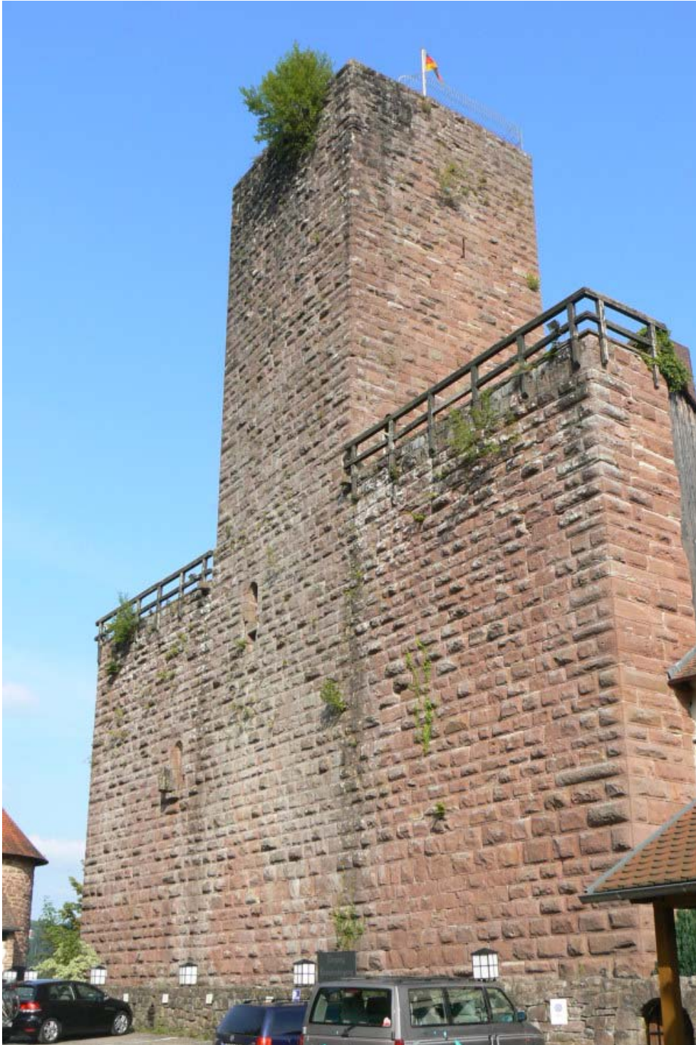
Schildmauer und Bergfried

Auf der Ostseite sind noch schöne Fensterfronten des alten Ritterhauses erkennbar. Naheher zeichnete Ende des 19. Jahrhunderts ein romantisches Bild der alten Burg, auf dem noch die ruinösen Reste der Wohnbauten gut erkennbar sind. Er beschreibt noch den Zugang vom östlichen Ritterhaus mit seinen gekuppelten Fensterfronten aus der zweiten Hälfte des 13. Jahrhunderts (Spätromantik/Gotik) durch eine Wendeltreppe auf den Wehgang der Schildmauer. In der Schildmauer führen zwei