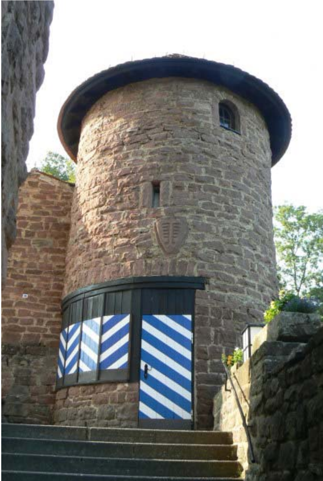
Eckturm am Zwinger