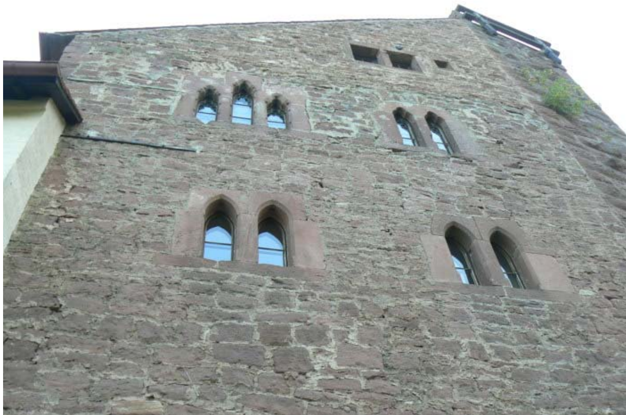
Fensterfronten des Ritterhauses

Hoch über Bad Liebenzell und dem Nagoldtal erhebt sich der mächtige, rötlich schimmernde Bergfried der Burg Liebenzell auf einer Spornterrasse zwischen dem Nagold- und Längenbachtal. Da sich die Anlage mitten im Hang des Schlossberges befindet, musste sie gegenüber der höher liegenden Bergseite stark befestigt werden.