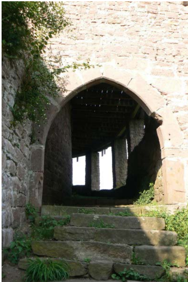
Zugang zum Zwinger

In älteren Urkunden taucht ein „Oppidum cell“ auf. Ob es sich dabei um die Burg handelt, ist nicht geklärt. Liebenzell wurde einst nur „Celle“ (von Klosterzelle) genannt. Die erste Burg soll von den Grafen von Calw erbaut worden sein. 1196 kam die Burg als Erbe der Herzogin Ute – Tochter des Grafen Gottfried von Calw an die Grafen von Eberstein 10 . 1250 tauchen die Herren von Liebenzell erstmals in einer Urkunde aus Maulbronn auf. Der fromme Ludwig von Liebenzell übergab die Burg 1272 an den Deutschen Ritterorden. Bereits ein Jahr später kauften die Markgrafen von Baden 11 die Burg für 1200 Mark Silber. Die Witwe Rudolf des I. von Baden starb dort 1284. Herzog Friedrich von Württemberg erwarb die Burg im Jahre 1603, welche dort schon sehr verfallen gewesen sein soll. 1692 zerstörten die Franzosen im Pfälzischen Erbfolgekrieg die Anlage. Ab 1953 wurde das Burgareal wiederhergestellt und bebaut.