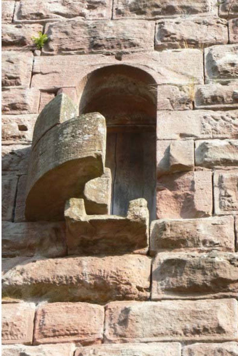
Abort in der Schildmauer

Öffnungen zum Halsgraben. Diese waren Aborterker, deren Reste der ringförmigen Öffnungen sind nach unten hin noch erkennbar. Erwähnenswert ist noch der kleine runde Turm an der Ecke des Zwingers auf der Nordostseite.