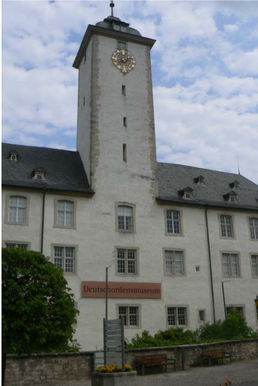
Bläserturn und westlicher Schlossgraben