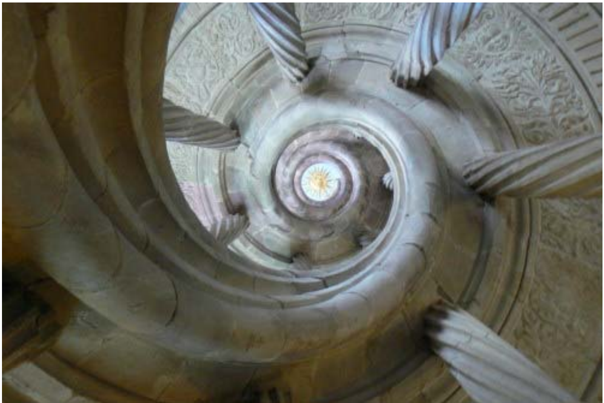
Berwarth-Treppe von unten

Alle Gebäude wurden entkernt, im Stil der Renaissance eine harmonische Front geschaffen und alle Stockwerkshöhen des in Jahrhunderten zusammengestückelten Gebäudekomplexes angeglichen.