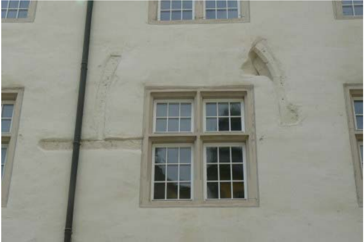
Fenstergewände im Innenhof

In der Barockzeit ab 1626 wurde der Gebäudekomplex zum Schloss erweitert und umgebaut. Die weitläufigen Flügel auf der Nordostseite der alten Kernburg – das „Äußere Schloss“ - mit dem großen parkähnlichen Hof, entstanden in dieser Zeit, bzw. später, und wurden als Verwaltungs- und Wirtschaftsgebäude genutzt. Ältere, dort vorhandene Gebäude wie das Kanzlei- oder Archivgebäude von 1558/71, wurden in die Gebäudefront integriert.