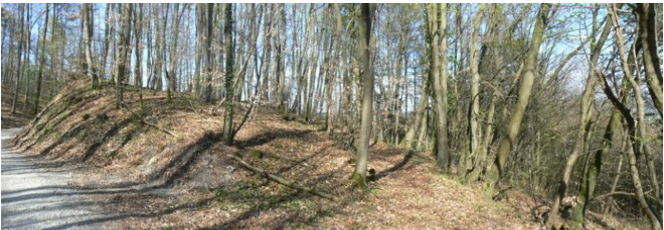
Burgareal von Süden. Links der Halsgraben

Für den Wanderer fast nicht erkennbar führt hier der geschotterte Waldweg durch einen Hohlweg. Am Messpunkt der Verfasser auf dem Hohlweg (9 Grad 2' 44" E/49 Grad 21' 49" N), der einst der sichelförmige Halsgraben war, wird das kleine, ovale Burgareal von der höher gelegenen Bergseite abgeschnitten.