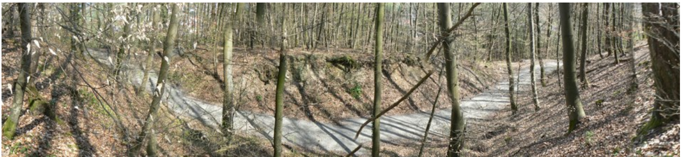
Panoramaaufnahme des Burgareales aus Westen gesehen

Die Quellenlage für eine Burg Mörtelstein ist sehr dürftig. Sie gehörte sicher zu den Besitzungen Obrigheims und war in enger Verbindung mit der Burg Landsehr, der ehemaligen Burg in Obrigheim (Mettelnburg), der Burg Neuburg 9 und der ehemaligen Burg in Asbach 10 . Im 12. Jahrhundert taucht im Raum Obrigheim ein edelfreies Geschlecht der Herren von Obrigheim auf. Ab 1222 wurden die Obrigheimer staufische Ministerialen der Wimpfener Kaiserpfalz 11 . 1316 wurde Obrigheim mit Diedesheim und Mörtelstein von Kaiser Ludwig dem Bayern an Konrad von Weinsberg 12 verpfändet. Weitere Besitzerwechsel folgten danach. Die Burg in Obrigheim wurde letztmalig 1479 erwähnt und fiel eventuell 1504 dem Landshuter Erbfolgekrieg zum Opfer 13 .