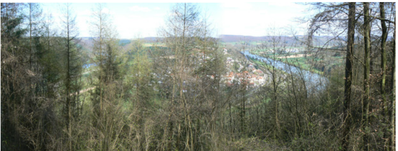
Neckarschleife von Binau

Durch bewaldete Höhen schlängelt sich der Neckar nördlich von Heilbronn als Grenzfluss zwischen den Regionen Kraichgau und Odenwald. Die Natur hat bei dem Ort Binau eine der schönsten Neckarschleifen entstehen lassen. Die Fahrt auf der Burgenstrasse 1 zwischen Heilbronn und Heidelberg 2 führt vorbei an vielen romantischen Burgen und lässt den Autofahrer auch diese halbkreisförmige Neckarschleife passieren. Vorbei am ältesten Atomkraftwerk Deutschlands in Obrigheim und der am Neckarhang im Wald versteckten Burg Dauchstein 3 , umrundet hier die Strasse den Ort Binau. Gegenüber versteckt sich auf einem bewaldeten Bergsporn die einstige kleine Burg Mörtelstein.