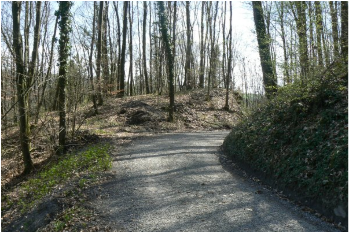
Burgareal von Norden gesehen

Die einstige Burg ist mit der weiter südlich gelegenen Burg Landsehr 5 und der Burghalde bei Hochhausen 6 vergleichbar. Auch andere ehemalige Kleinburgen wie Flinsbach 7 oder der Teufelskopf bei Dielheim 8 zeigen, dass es Unmengen solcher kleiner, heute längst verschwundener und teilweise vergessener Burgen gab.