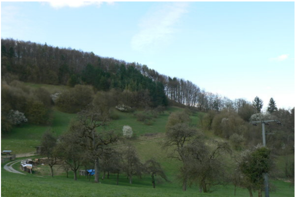
Bergsporn von Süden gesehen

Ein steinerner Torbogen mit der Jahreszahl 1606 ist in der Dorfmitte in einer Scheune verbaut. Der kannelierte Bogen aus rotem Sandstein, der mit mehreren Rosetten verziert ist, soll laut Gerüchten eventuell von der alten Burg stammen. Dies ist aber eher unwahrscheinlich. Die damals vorhandene kleine Burganlage- eher ein Wartturm zur Überwachung des Neckars- wird sicher nicht solche aufwändig bearbeiteten Elemente gehabt haben, sondern eher hauptsächlich aus Holz und/oder Fachwerk errichtet worden sein. Die Ortschronik des Bürgermeisters Karl Ludwig Senk, welche sich mit den Jahren 1681 bis 1855 befasst, erwähnt keine Burg oder Ruine.