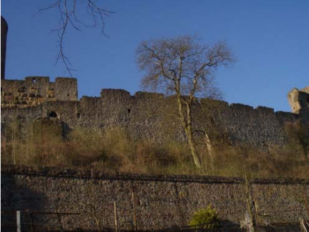
Südseite des ehemaligen romanischen Palas