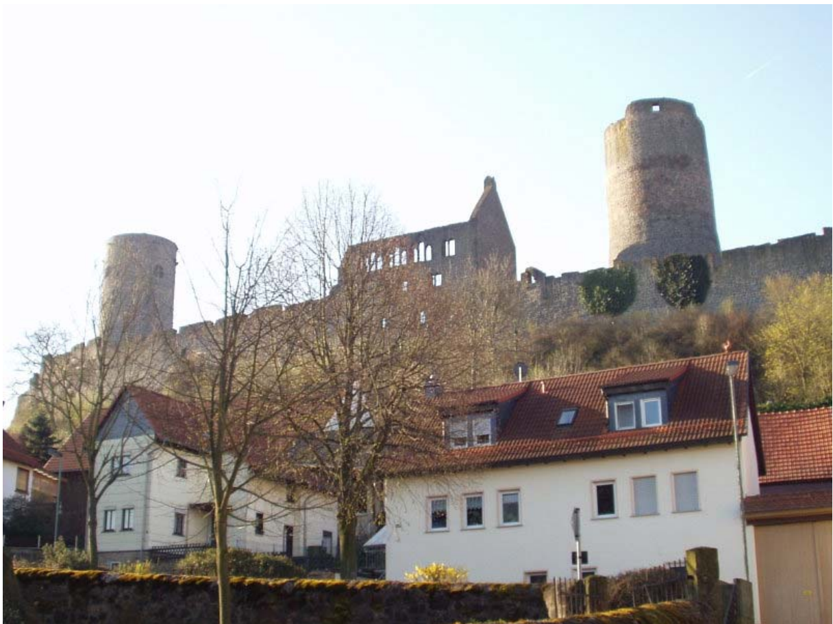
Burganlage von Norden

Wie ein Wahrzeichen erhebt sich die Burganlage zwischen den Autobahnen A5 und A 45 in der Nähe des Gambacher Kreuzes. Weithin sichtbar sind die beiden Rundtürme und beherrschen die umliegende Landschaft. Von Frankfurt und Gießen schnell zu erreichen, lohnt sich ein Besuch dieser außergewöhnlichen Anlage.