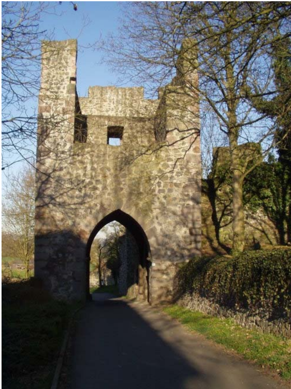
Torturm am südlichen Zwinger

Die Herren von Falkenstein errichteten den nördlichen gotischen Palas nach 1255/70, welcher ihren Namen trägt. Antonow vermutet einen Vorgängerbau an der Stelle des Falkensteiner Palas. Im Dreißigjährigen Krieg wurde die Burg zerstört