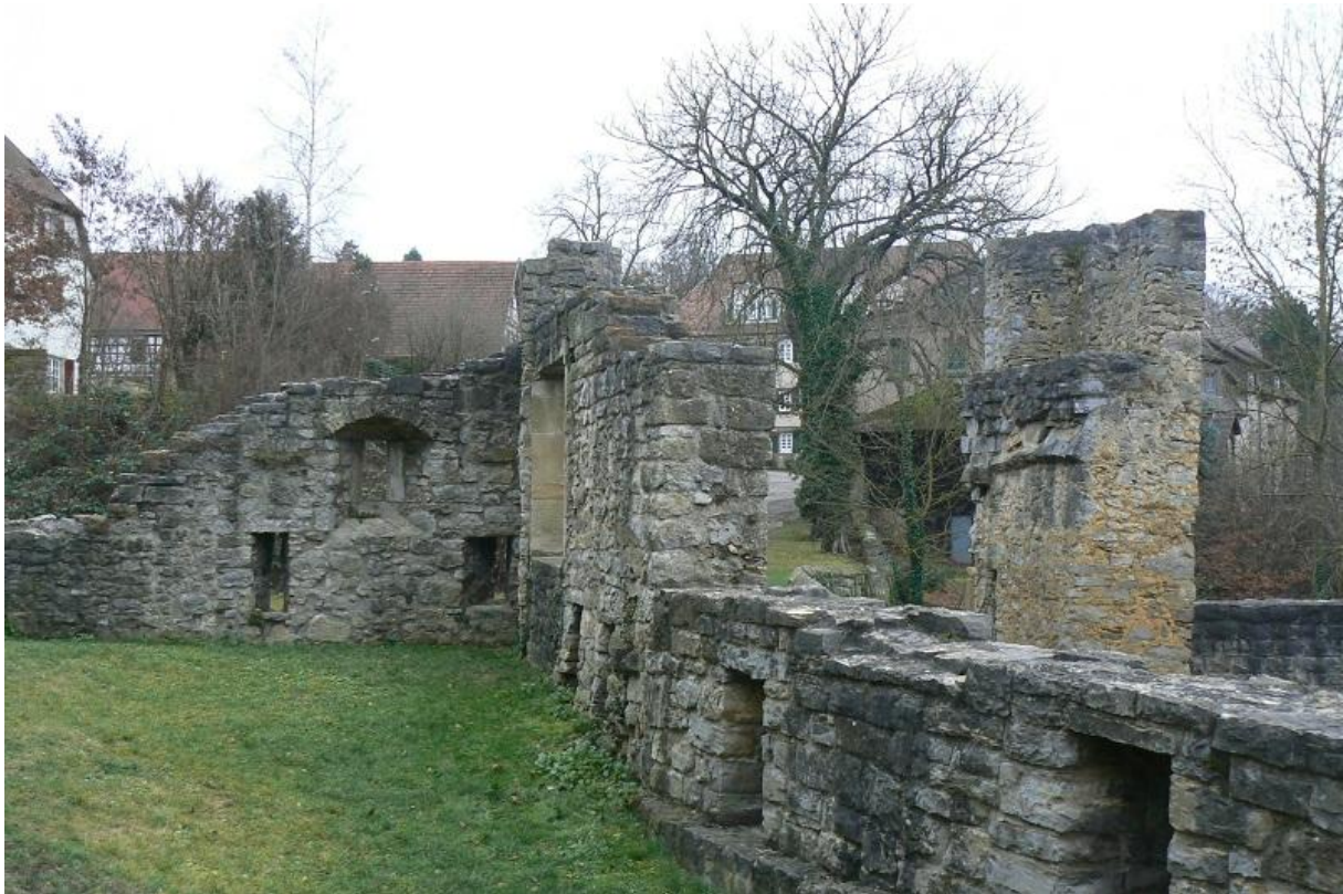
Zwingermauer und Osttor

Nur zwei Steinpfeiler sind noch von der Toranlage vorhanden, durch die man die einstige Vorburg betritt. Auf der Südseite fällt der Bergsporn ins Tal der Glems steil ab. Der Hof der Vorburg wird hier von einer Zwingermauer begrenzt. An der Südwestecke befindet sich das einzige intakte Gebäude, welches über einem Gewölbekeller steht. Dieser kann über ein Tor auf der Ostseite betreten werden.