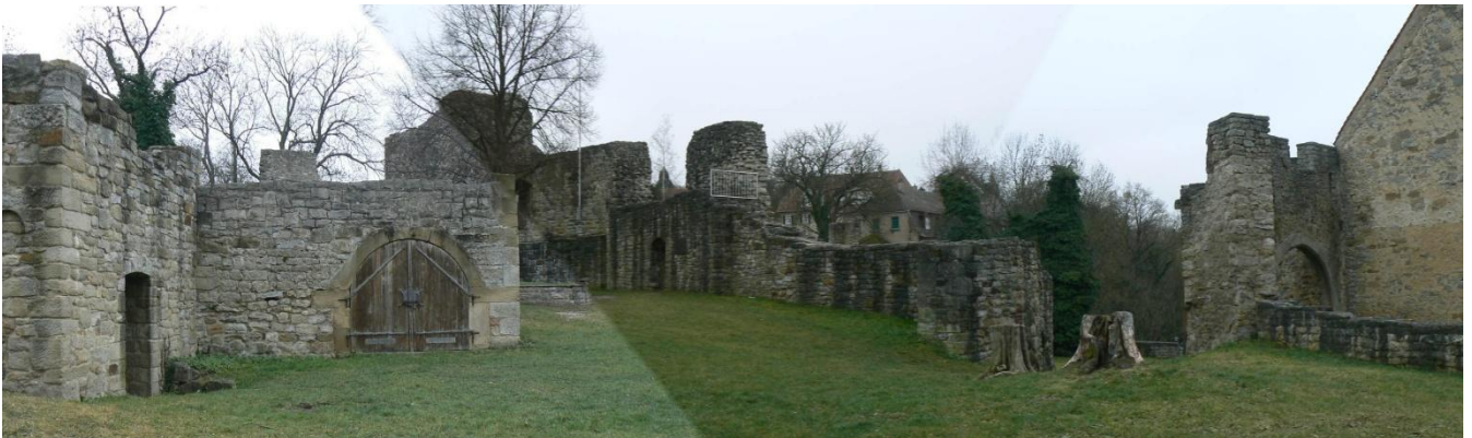
Blick von der Westseite auf die Kernburg

Durch dieses Tor betritt man die leicht erhöht liegende Kernburg. Auf der Nordseite befindet sich unter einem kleinen Erdhügel der Rest der Trinkwasserzisterne. Daneben steht noch das Erdgeschoss eines Flankierungsturmes über dem steil abfallenden Hang des Spornes, unter dem sich ein 5 Meter tiefer Keller befindet, welcher einst durch eine kleine Luke geöffnet werden konnte. Daneben steht das Fundament des rechteckigen Palas, unter dem sich noch ein Kellergewölbe befindet. Auf der Westseite neben dem Tor zur Kernburg führt der Rest eines Torhauses in den westlich vorgelagerten Zwinger, dessen Mauern noch teilweise erhalten sind. Der Weg führt zur Spornspitze hinunter ins Tal der Glems. Da die Spornspitze im Gegensatz zu den Flanken flacher abfällt, befindet sich hier noch der Rest eines Vorwerkes, welches vermutlich aus einer Wallanlage bestand. Reste des Walles sind noch erkennbar.