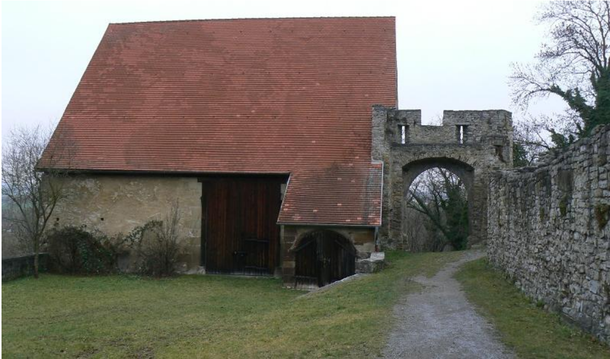
Gebäude und Westtor