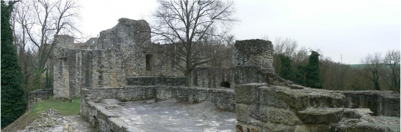
Palas und Schildmauer von Nordwesten