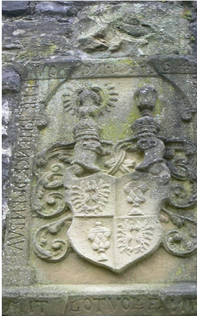
Wappen der Nippenburger in der Kernburg