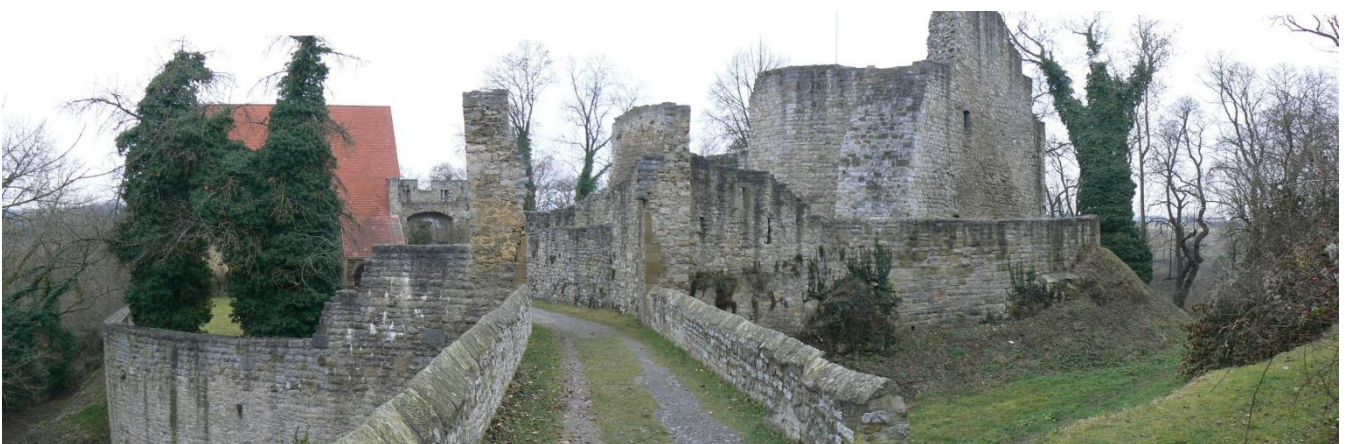
Blick von der Ostseite

Die mittelalterliche Burgruine wurde erhalten und integriert sich romantisch in die jüngere Schlossanlage. Solche Ensembles finden wir auch bei anderen Anlagen, bei denen die alte Ruine nicht überbaut oder abgerissen wurde. (z.B. bei Schloss und Burg Neuenbürg a bei Pforzheim und Schloss und Burg Ehrenberg b am Neckar).