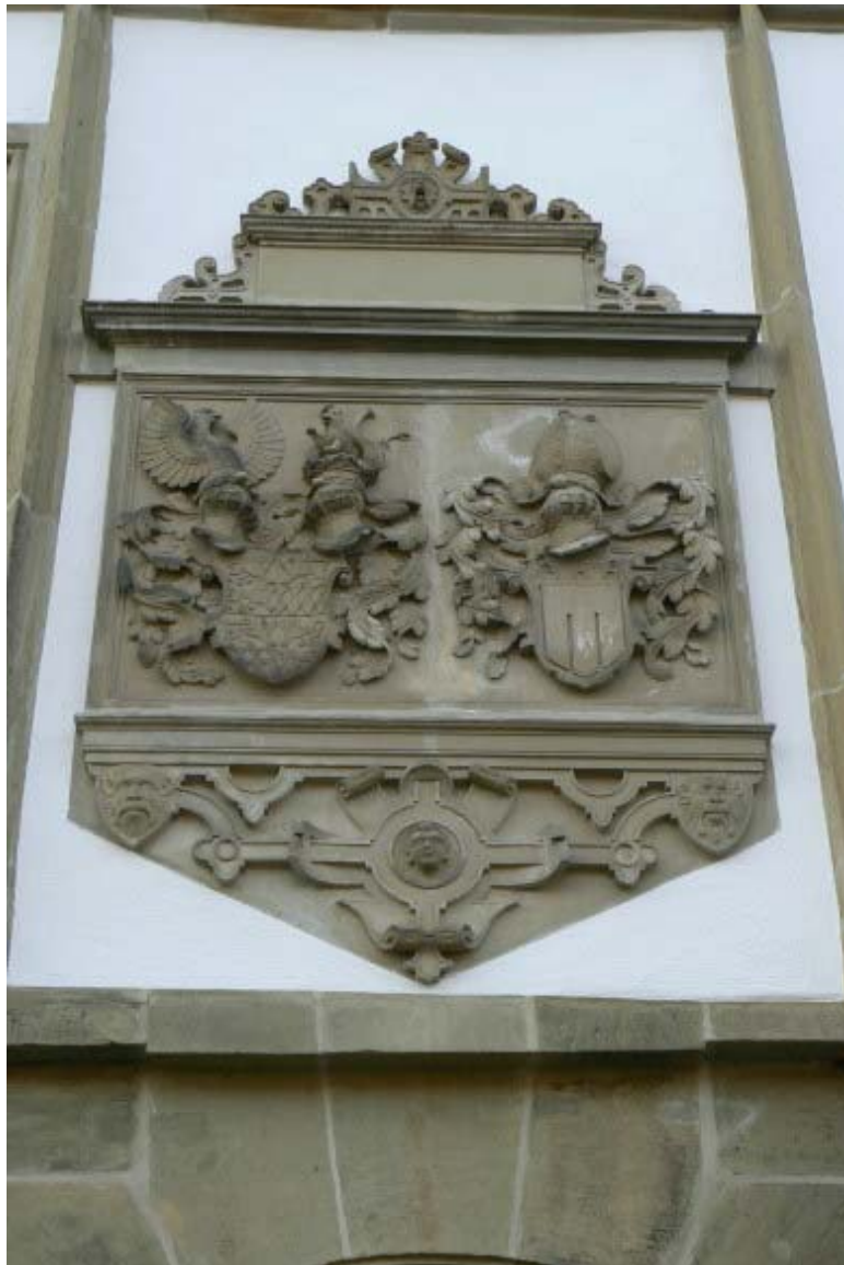
Wappen der Herren von Hohenlohe und Tübingen 13

Empfehlenswert ist die Besichtigung des Schlosses Neuenstein über die Ausfahrt 41 Neuenstein 12