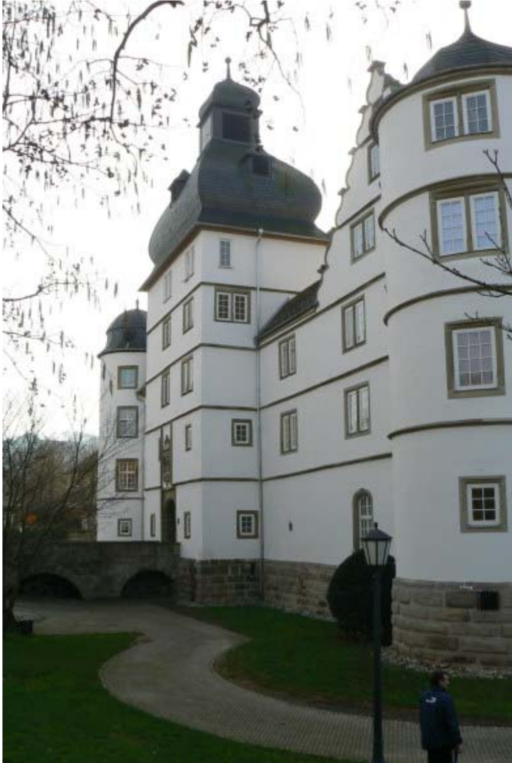
Ostseite mit turmartigem Torbau und Graben