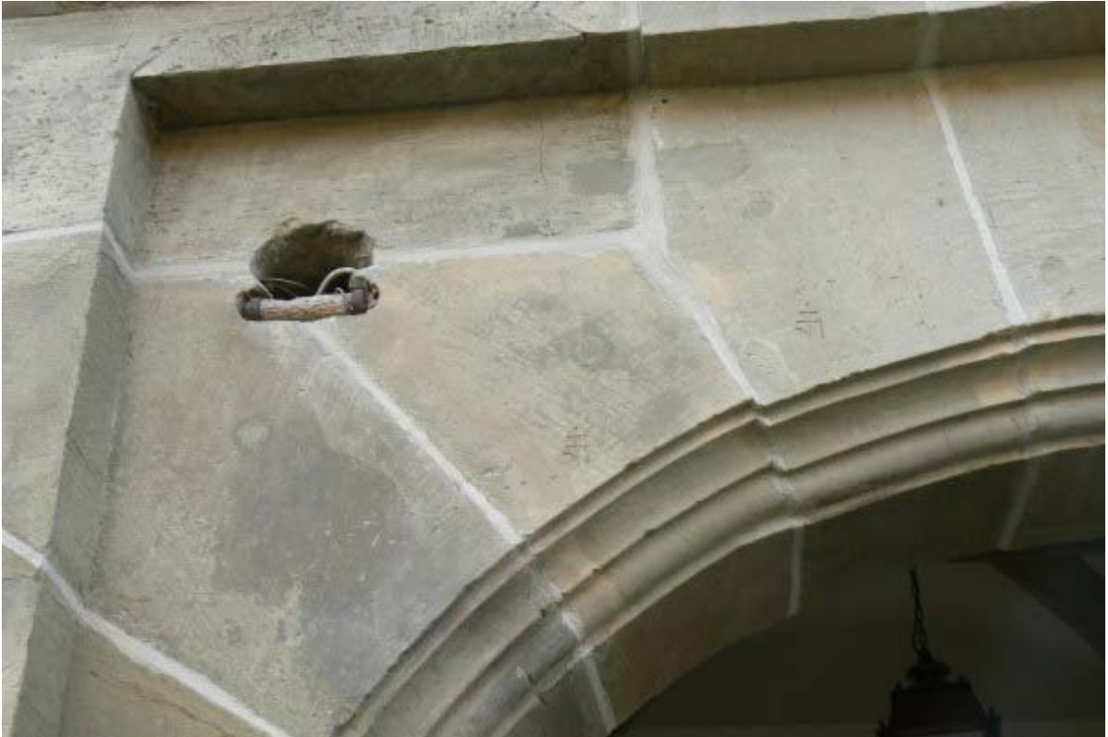
Rollenvorrichtung der früheren Zugbrücke