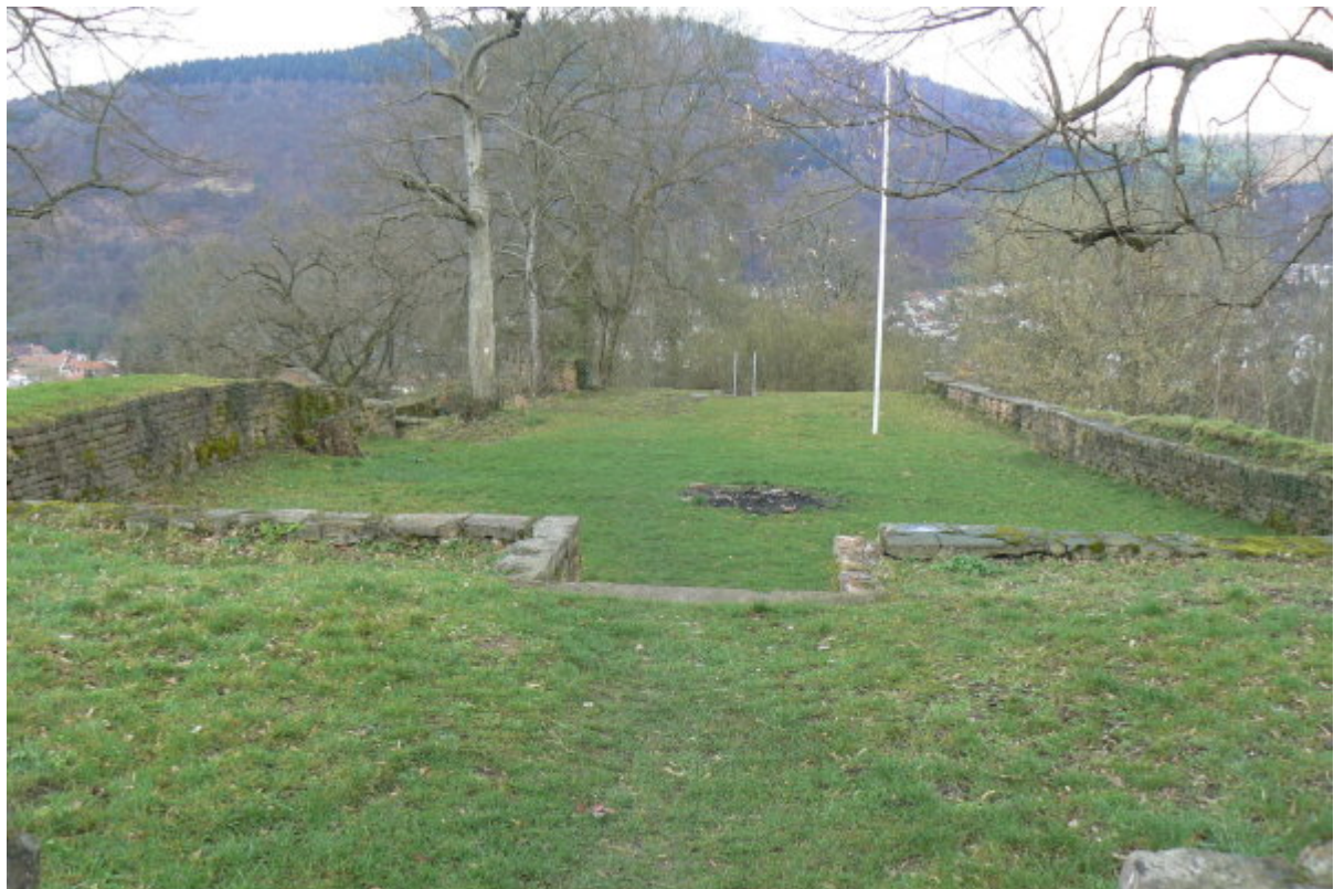
Burggelände- Blick nach Norden

Wenige Kilometer flussaufwärts von Heidelberg liegt die Stadt Neckargmünd am Neckar. Südlich des Ortskernes erhebt sich auf dem nördlichen Sporn des Hollmutrückens die Ruine Reichenstein zwischen den Bäumen. Verbunden mit einem Besuch Heidelbergs oder einer Wanderung durchs Elsenz- oder Wiesenbachtal lohnt sich der Besuch dieser ruhig gelegenen Ruine.