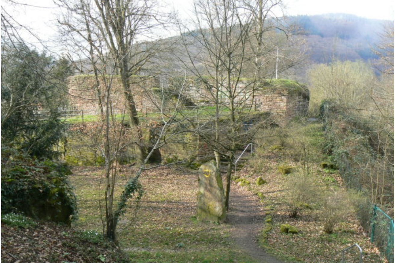
Halsgraben- Blick nach Norden

breite Burggelände wurde durch das Kurpfälzische Museum ein Profil erstellt. Es wurden auf dem Burggelände zwei Schuttschichten (jeweils 0,2- 0,3 Meter stark) mit Sandsteintrümmern und Bruchstücken von Mönch-Nonne-Ziegeln und Fragmente von Hüttenlehm festgestellt. Auch mehrere hundert Scherben wurden sichergestellt, welche vom Alter in den Zeitraum zwischen dem späten 12. und 14. Jahrhundert datiert wurden. Eine Entstehung der Burg um Beginn des 12. Jahrhunderts wird angenommen. 7