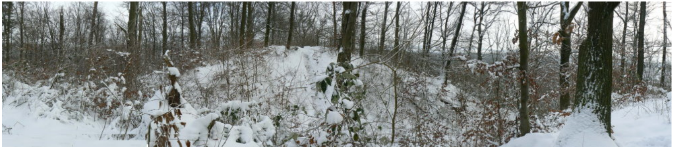
Burghügel und Halsgraben on Richtung Osten gesehen