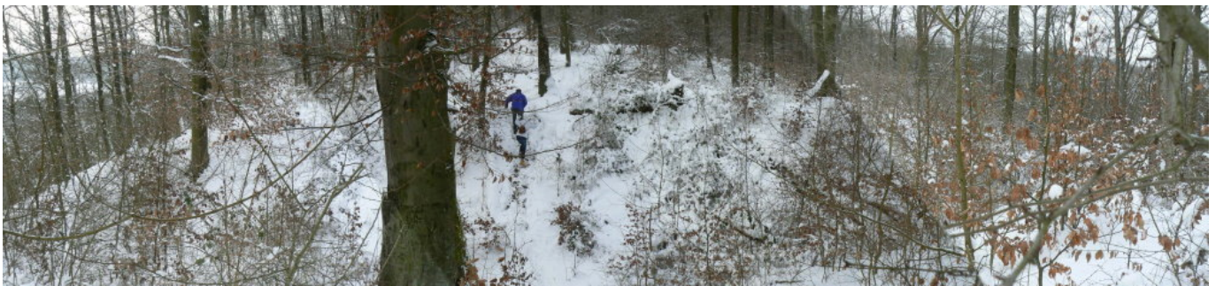
Halsgraben vom Burghügel in Richtung Westen gesehen

Das ehemalige Burggelände weist auf eine häufig vorkommende Kleinanlage mit Graben, Turm und kleinem Gebäude hin. Auf der Nordseite verläuft der Hohlweg des Rennweges am Burggelände vorbei zum Bergrücken. Zwischen dem Rennweg und dem Burggelände zweigt ein weiterer Hohlweg ab. Kunze vermutet hier den ehemaligen Rennweg, welcher aufgrund des Halsgrabens weiter nördlich verlegt wurde. Plausibel wäre hier aber auch den Zugang zum Burggelände zu vermuten.