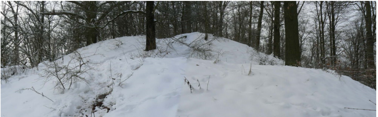
Plateau an der Ostspitze von Osten gesehen

Seine strategische Lage ist aber nahezu ideal. Der schmale Sporn mit abfallenden Hängen bot sich für den Bau einer Wehranlage an. Die Aussicht nach Süden und Osten geht bis zum Horizont. Nach Norden ist der Michaelsberg mit der ehemaligen Burg Obermagenheim k als Nachbar vorhanden und direkt nördlich unterhalb des Spornes beginnt der Rennweg als Hohlweg seinen Aufstieg auf den nach Westen verlaufenden Stromberg. Diese uralte Wegverbindung war auch im Mittelalter strategisch wichtig und verläuft weiter auf dem Bergrücken bis nach Sternenfels ins Kraichgau hinein. Im Verlauf des Weges befinden sich zwei weitere Burgen: Ruine Blankenhorn und der Burgstall Weiler l . Beim Aufstieg am Osthang der Spornspitze erreicht man kurz vor der Spornspitze eine schmale Terrasse, welche das Burggelände an der Nordostspitze umgibt und vermutlich der Standort eines einst um das Burggelände verlaufenden Palisadenzaunes war. Diese Terrassierung ist nur teilweise erhalten und größtenteils vermutlich erodiert.