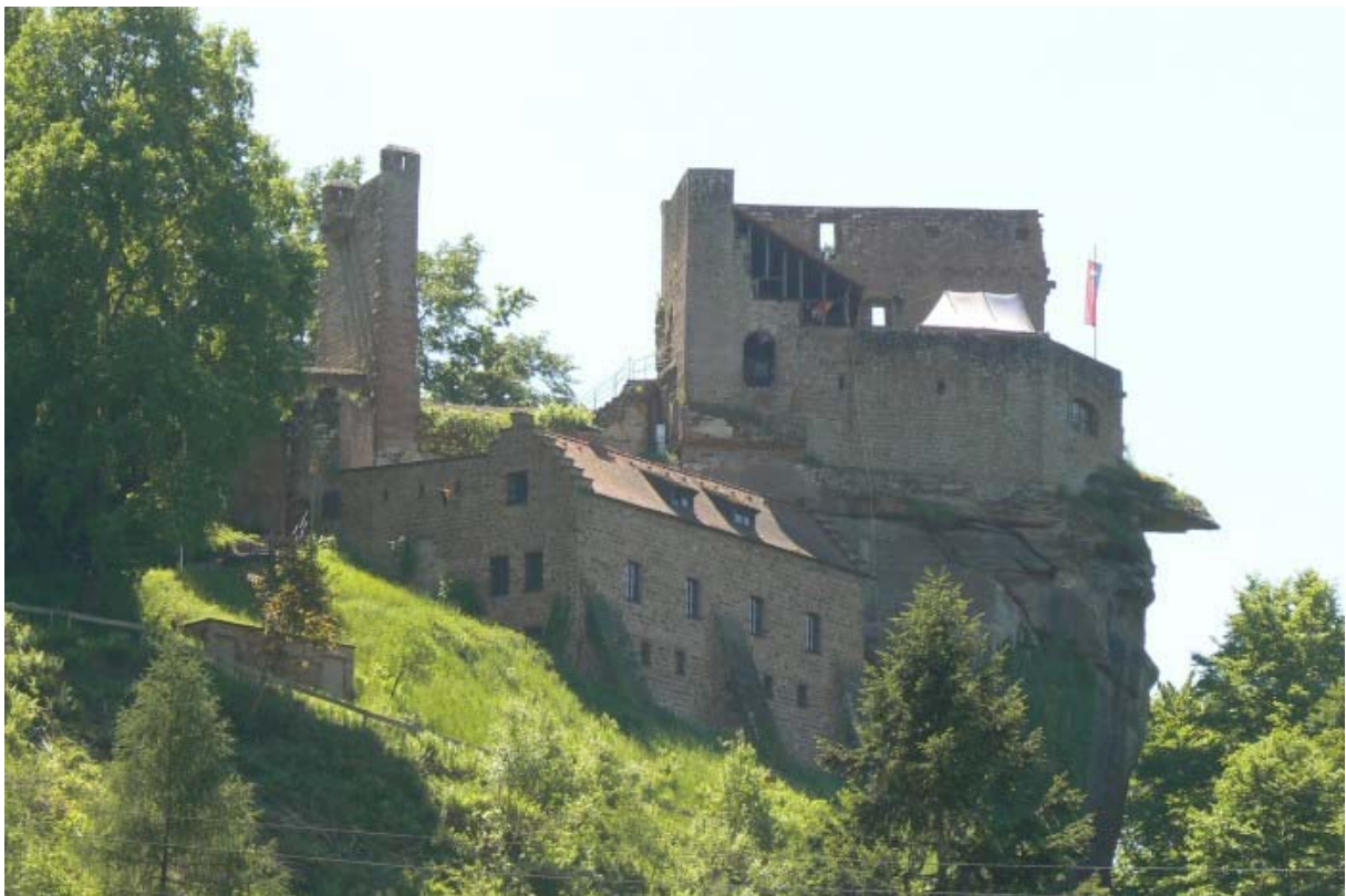
Blick vom Tal hoch zur Burg

In dem von Wald gesäumten Elmsteiner Tal ragen über den Ansiedlungen mehrere Burgen, teilweise auf bizarr anmutenden Felsnasen, empor. Nicht nur die Burg Alt-Erfenstein 1 und Burg Erfenstein 2 am Westhang des Tales, sondern auch die Burg Spangenberg am gegenüberliegenden Osthang. Hier bewachen zwei feindliche Grenzburgen ihre Besitzungen: Leiningener Grafen auf der einen, das Bistum Speyer auf der anderen Seite.