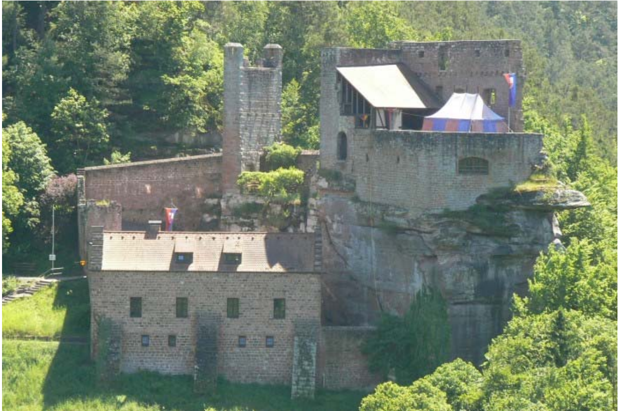
Spangenberg von der gegenüberliegenden Burg Erfenstein gesehen