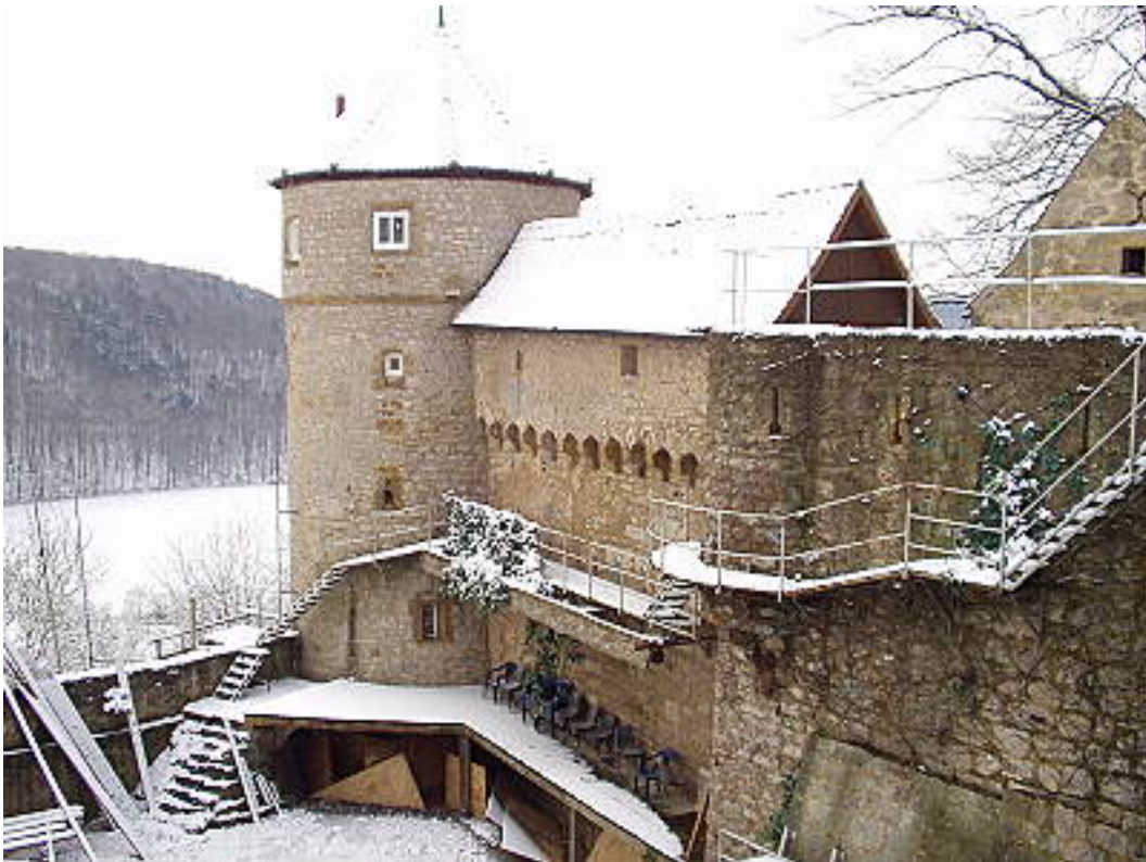
Südlicher Flankierungsturm der Vorburg

einen weiteren (heute in der nördlichen Hälfte aufgefüllten) Graben getrennt. Die südliche Ecke des Zwingers der Kernburg wird zum Graben hin von einem Eckturm (Archivturm) flankiert. Der Zwinger umgibt die gesamte Kernburg und wird durch 3 weitere Türme (u.a. der Brigittenturm) verstärkt. An der Nordostecke des Zwingers befindet sich eine kleine Kapelle 4 . Geschützt wurde die kleine Kernburg durch eine 13 Meter hohe, ca. 19 Meter lange und 2,6 Meter dicke romanische Schildmauer 5 . Diese Schildmauer steht in Verbindung mit dem an deren Nordecke sich befindenden rechteckigen, außen mit Buckelquadern verzierten Bergfried. Schildmauer und Bergfried deckten einst die sich dahinter befindenden Fachwerkgebäude 6 und schützten diese. Ein Blick in den engen Hof zeigt heute noch die drangvolle, düstere Enge in denen die mittelalterlichen Bewohner in solchen kleinen Anlagen hausten.