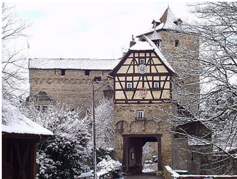
Torhaus mit Bergfried und Schildmauer

Von der Autobahn A 6 erreicht man den Ort Kocherstetten, über dem auf einem Bergsporn die mittelalterliche Burg thront, über die Ausfahrt 42 Künzelsau. Von hier führt die B 19 nach Künzelsau, von dort weiter nach Osten über die Landstraße in Richtung Langenburg fahren.