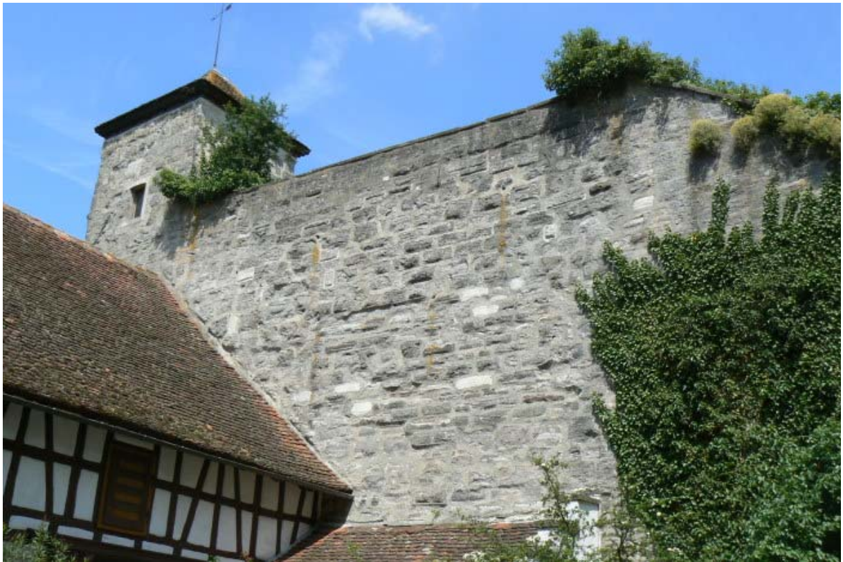
Hofseite der Schildmauer mit Nordturm

vollständig umgeben, welche im Osten an den Graben und im Süden an den etwas tiefer gelegenen Wirtschaftshof – die einstige Vorburg- grenzt. Die Gebäude des rechteckigen Wirtschaftshofes sind neueren Datums, wir lassen sie deshalb hier unbeschrieben. Die Zwingermauer schützt im Osten die mächtige, ca. 13 Meter hohe und 4 Meter dicke Schildmauer 7 , welche zur Grabenseite mit staufischen Buckelquadern verkleidet ist. Im Areal zwischen den Mauern befindet sich ein Brunnen, welcher heute von einem Schuppen überbaut ist. Die 30 Meter lange Schildmauer, welche in der Mitte einen schwachen Knick aufweist, wurde um 1650 mit zwei Türmchen an deren Ecken verziert. Auf der Nordseite steht ein Eckturm und auf der Südseite ein Rundturm, welcher in die rechteckige Toranlage hineinragt und mit dieser verbaut ist.