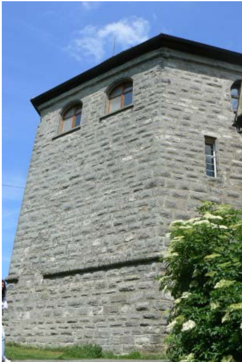
Westseite Palas mit Gesims

Norden erreicht man den Zwinger mit schönem Ausblick nach Norden. An der Nordwestecke des Zwingers befand sich eventuell einst ein bastionsartiger Bau. Folgt man dem Zwinger nach Westen, erreicht man die Westspitze der Burganlage. Auffällig ist hier das quer verlaufende Gesims im Palas, in welchem Antonow 8 süditalienischen Einfluss erkennt. Eine Pforte führt an die Westspitze des Bergspornes, die aber keine mittelalterliche Bebauung mehr aufweist, jedoch eine mittelalterliche Nutzung vermuten läßt. Im Zwinger selbst dominiert die der heiligen Magdalena geweihte Burgkapelle aus dem 17. Jahrhundert (1632 genannt), welche vermutlich auf mittelalterlichen Fundamenten errichtet wurde. Diese Kapelle wurde 1994 renoviert und war noch in den 1980er Jahren als verfallen beschrieben worden 9 .