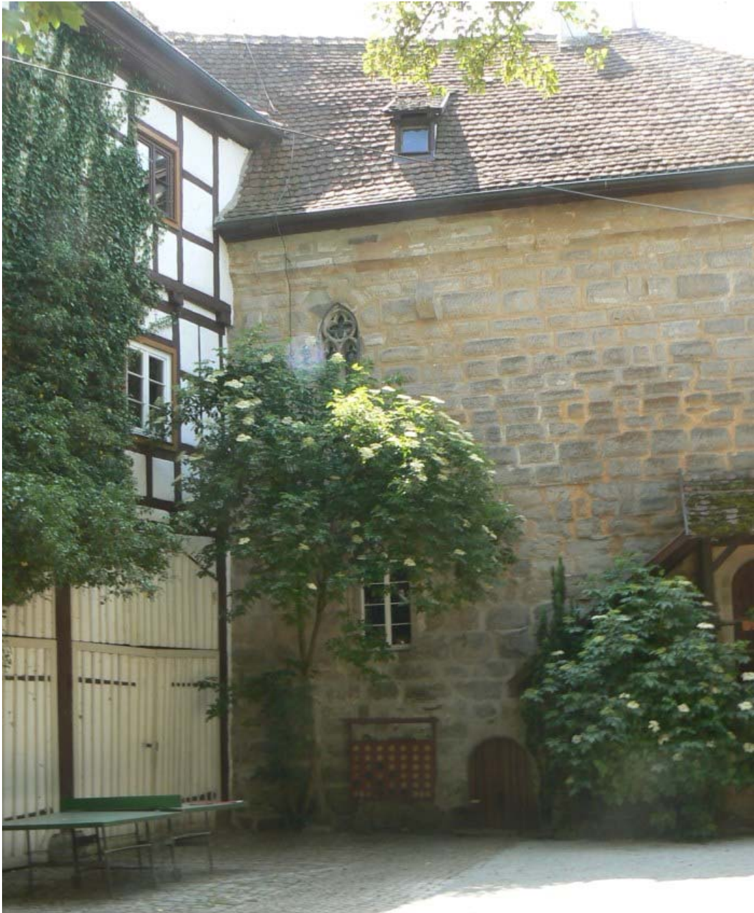
Palas mit Maßwerkfenster im 2. Stock

Kreuzgewölbe überdeckte Halle. Im zweiten Stock des Palas befindet sich auf der Hofseite ein Spitzbogenfenster mit schöner Maßwerkfüllung.