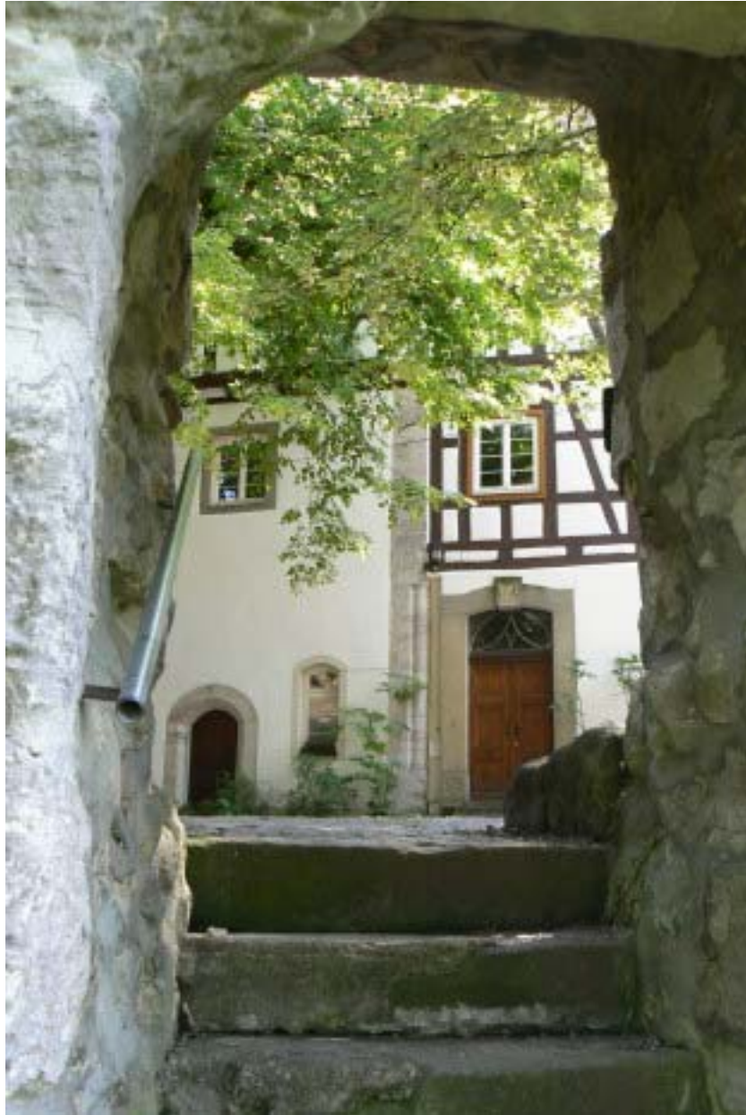
Blick in den Hof vom Nordzwingler