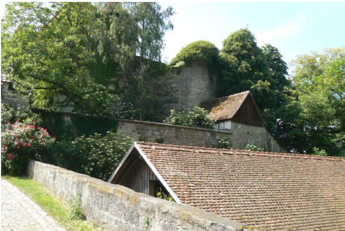
Zwinger und Schildmauer von Osten

Südöstlich des Ortes Bühlertann erhebt sich auf einem spornartig nach Westen verlaufenden Bergrücken die Schildmauerburg Tannenburg. Leider durch viel Vegetation versteckt, wird ihr wehrhafter Charakter auf den ersten Blick nicht sichtbar. Die kleine staufische Befestigung mit erstaunlich dicker Schildmauer ist im Kern aber noch hervorragend erhalten und mit den kompakten Schildmauerburgen Amilshagen 1 , Leofels 2 im Hohenlohe oder Blankenhorn 3 im Unterland und der Burg Stolzeneck 4 am Neckar vergleichbar. Die Anlage und deren heutige Besitzer bieten die Möglichkeit, einmal Urlaub nicht nur auf dem Bauernhof, sondern auf einer richtigen hochmittelalterlichen Burg zu machen.