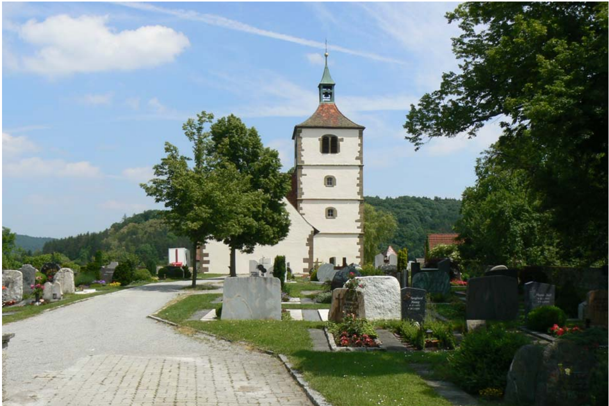
Martinskirche von Westen gesehen

Auf einem Bergkegel nördlich von Vellberg befindet sich heute an höchster Stelle die spätgotische Martinskirche mit dem westlich davon gelegenen Friedhof. Natürlich geschützt vom tiefen Tal der Bühler im Süden und vom Aulenbach im Osten und Norden, bot der Bergstock mit ca. 5,2 ha Fläche Platz für eine eventuell schon in vormittelalterlicher Zeit genutzte Großbefestigung bzw. Kultstätte. Steile Hänge bilden ein im Grundriss verschobenes Rechteck. Funde aus der Bronzezeit lassen eine vorgeschichtliche Besiedlung vermuten. Hier soll einst ein fränkischer Königshof gestanden haben. 822 wird die Kirche „basilica sancti martini“ im „Castrum Stochamburg“ als Würzburger Besitz erwähnt. Diese Kirche soll bereits 741