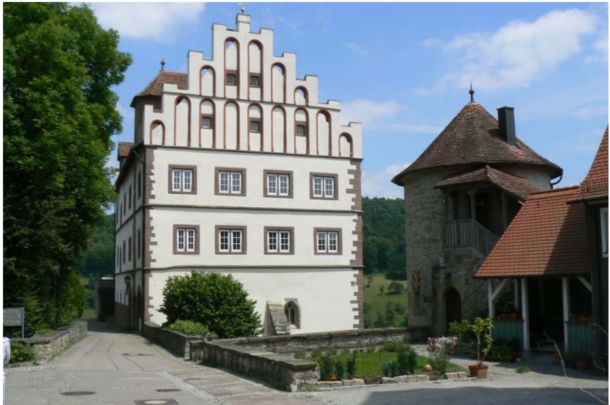
Schlossgebäude und Kanzleiturm (rechts)

Durch den Graben entstand ein ca. 40 Meter breites und 70 Meter langes Areal, welches zur Spornspitze hin schmaler wird. Das heutige Schloss befindet sich an der Südwestecke direkt neben dem Halsgraben. Das dreigeschossige Steingebäude mit einem trapezförmigen Grundriss wird von auffälligen Staffelgiebeln verziert.