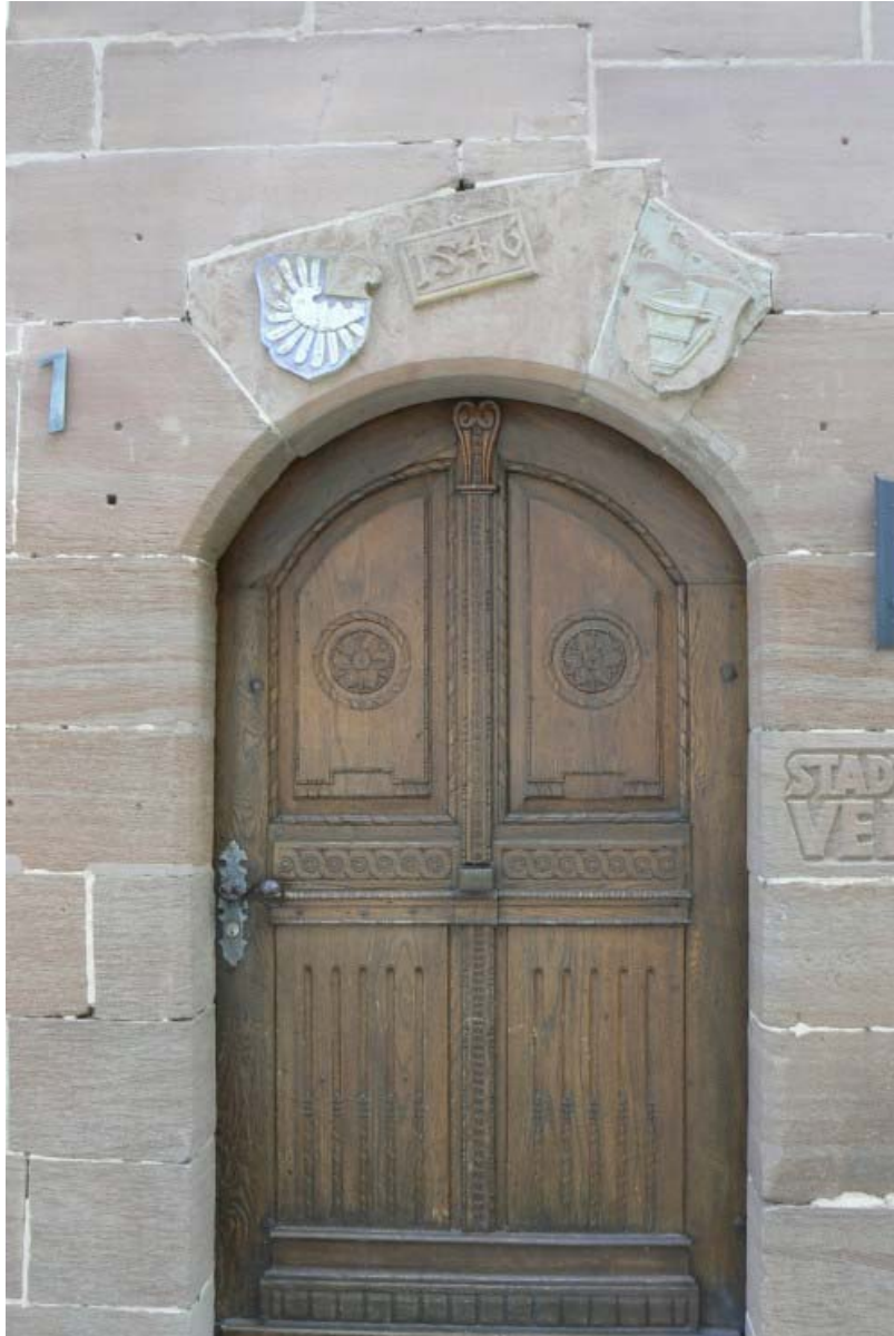
Eingang mit Allianzwappen

Neumodisch überbaut führt hier eine Treppe auf ein tiefer gelegenes Niveau, dem sogenannten einstigen „Burghof“. Hier dominiert der halbrunde Rest der Bastion, welche einst mit heute verschütteten Kasematten unterhöhlt war. Dieser Bastion scheint ein weiterer halbrunder Zwinger vorgelagert gewesen zu sein. Die Reste sind von Gestrüpp überwuchert und unter der Bastion gut sichtbar erhalten. Von der Bastion führt ein rampenartiger Weg nach Westen hinunter in den Zwinger. Durch einen Vorbau führt hier ein dreitüriges Tor direkt in den Zwinger unter den runden Geschützturm, welcher die Nordwestecke der Burg und gleichzeitig das Tor zur Stadtmauer beschützte. Dieser mehrstöckige Geschützturm kann von oben und von unten über Treppen betreten werden.