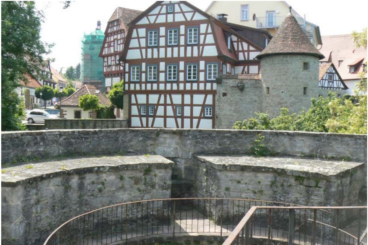
Blick vom Geschützturm über den Halsgraben auf die Stadt