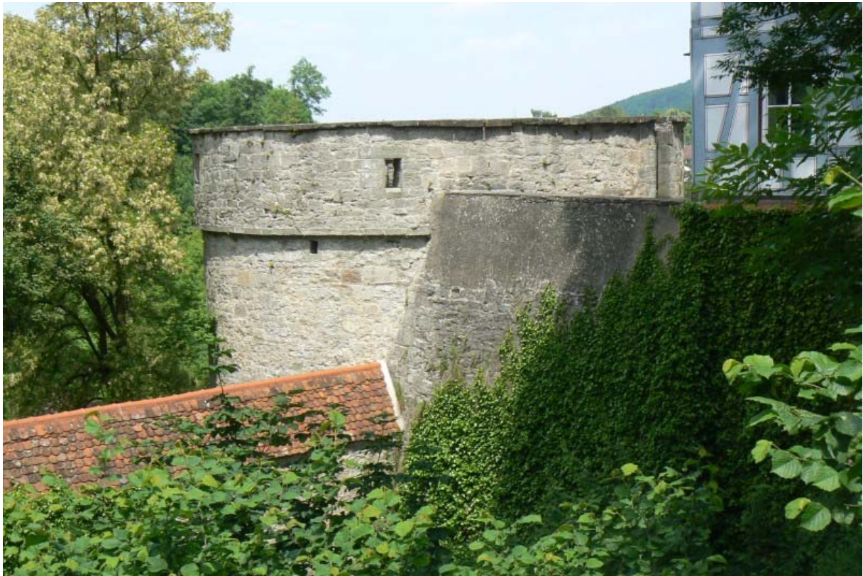
Geschützturm von der Stadt gesehen

Ab diesem Zeitpunkt berichten Urkunden immer wieder von einem „Unteren Haus“ und einem „Oberen Haus“. Bis 1480 kauften die Vellenberger die fremden Besitzanteile wieder zurück und vereinigten den Burgbesitz erneut. Bereits 1466 begannen die Vellenberger die Burg weiter zu befestigen. Die Befestigung der Burg und des Ortes war zu Beginn des 16. Jahrhunderts abgeschlossen. 1481 wurde zwischen den 6 Vellenberger Besitzern ein Burgfrieden vereinbart und die nächsten sechs Jahre ein Investitionsrahmen zum Ausbau der Befestigungsanlagen festgelegt. Diese Befestigungswerke hielten vielen Angriffen stand, wurden aber kampflos im Jahre 1523 bei der „Absberger Fehde“ vom Schwäbischen Bund eingenommen. Das Schlossgebäude Wilhelms von Vellberg wurde zerstört, da dieser dem Absberger Raubritter Wilhelm von Absberg Unterschlupf gewährt hatte. Zwischen 1543 und 1546 9 wurde das Schlossgebäude neu errichtet. Renaissanceformen sucht man vergeblich, die Staffelgiebel wirken mit ihren Pfeilern und Rundbogen spätgotisch. 1592 starben die Vellberger mit Konrad von Vellberg aus. Das Erbe fiel zu Teilen an Hohenlohe und die Stadt Hall. Die Stadt Hall erwarb 1598/1600 den Hohenloher Teil und Vellberg wurde bis 1802 als reichsstädtisches Landamt verwaltet.