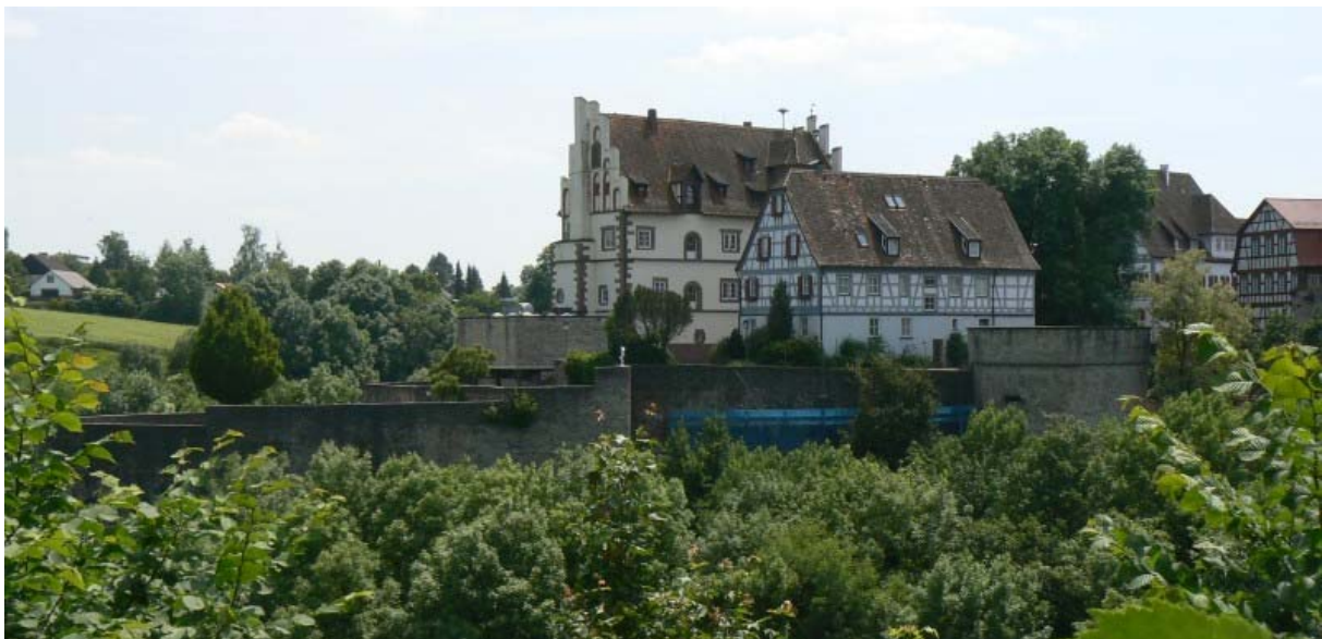
Schloss Vellberg von der Stöckenburg gesehen

Malerisch schön thront das Hohenloher Städtchen Vellberg über einer Schleife des Flusses Bühler. Schloss und Altstadt bilden dabei ähnlich wie im nördlich gelegenen Kirchberg an der Jagst 1 oder der hohenloheschen Waldenburg 2 eine harmonische und verteidigungstechnische Einheit. Mit Gräben, Zwingern, Bastionen und Ecktürmen und einem rundum laufenden unterirdischen Wehrgang geschützt, macht dieser Ort heute noch einen wehrhaften und mittelalterlichen Eindruck im Grün der ihn umgebenden Natur. Den Wanderer locken die malerischen, renovierten Gassen und Gebäude und die weitläufige Landschaft der Limpurger und Ellwanger Berge.