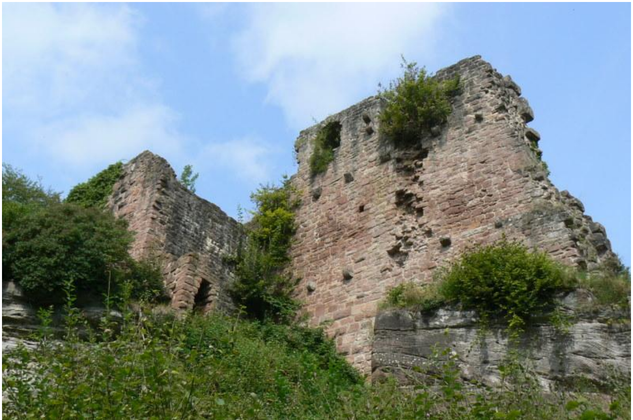
Bergfried (links) Gebäudemauer der Kernburg (rechts)

Ein Grillplatz lädt hier den Besucher zum Verweilen ein. An der Zwingermauer erkennt man auf der Ostseite den Rest eines eckigen Halbschalenturmes. Der Weg führt weiter um den Burgfelsen auf die Südostseite. Steil und heute ohne Mauerring fällt hier der Berg ab. Eine Schenkelmauer führt hier noch talwärts nach unten.