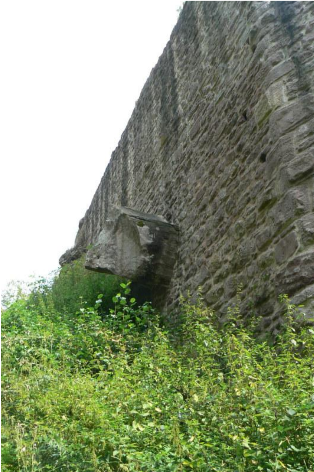
Fels in der Südmauer der Kernburg

Burgfelsens symbolisierte. 2 Weniger wehrhaft ist die Situation jedoch auf der Angriffsseite.