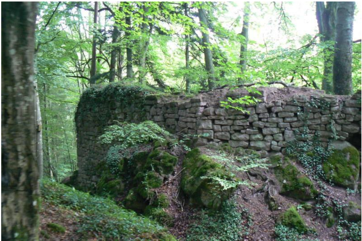
Erster Vorburgturm über der Waldeck

Um 1600 wurde die inzwischen württembergische Burganlage als „verschleifter Burgstall“ beschrieben, welcher die Franzosen zwischen 1688 und 1692 den Rest gaben und die Burg völlig zerstörten. 1896 wurde die Waldeck erstmals restauriert und gesichert. 11