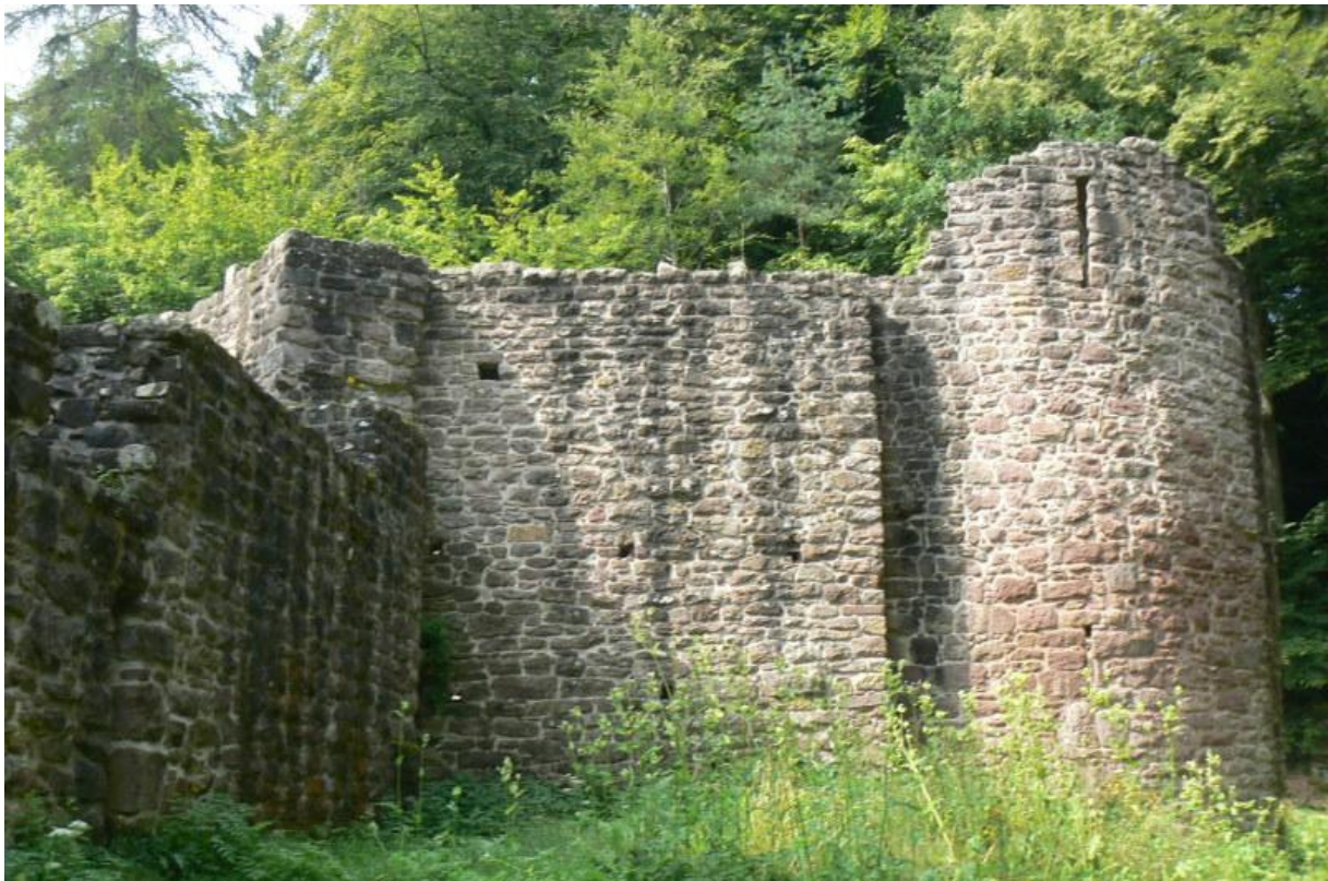
Westecke mit Rondell

Zwischen den vielen Kurorten des Nordschwarzwaldes thront gut versteckt im Wald die Burgruine Waldeck auf einem Bergsporn über dem Nagoldtal. Auf drei Seiten vom Tal umgeben, wurde die Burg mit der weitläufigen Vorburg auf dem engen Felsgrat erbaut. Die einzelnen Segmente der Vorburg bilden mit der Hauptburg auf der breiteren Bergspornspitze eine Burgengruppe und Verteidigungseinheit.