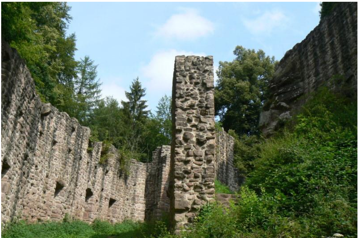
Südwestzwinger und Burgfelsen (rechts)

Durch eine Pforte betritt der Besucher den Halsgraben vor der Burg. Von hier führt eine Treppe hoch zur Vorburg. Als erste Verteidigungsanlage stand hier ein turmartiges Gebäude, welches mit einem Abschnittsgraben gesichert wurde. Einige Meter weiter erhebt sich ein Felsklotz, auf dem auch einst ein Turm stand. Der Weg führt weiter auf dem Grat und erneut folgt ein größerer Felsklotz, der durch zwei Gräben geschützt war. Schutthügel und behauene Steine weisen auf eine größere wehrhafte Bebauung hin. Die bis zu 4 Verteidigungsanlagen waren vermutlich autark und nicht miteinander verbunden und erinnern an die Felsenburgen der Pfalz (z.B. Drachenstein , Altdahn oder Tanstein 4 ).