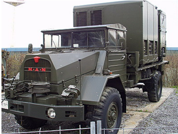
Der mobile Feuerleitstand auf einem MAN-LKW