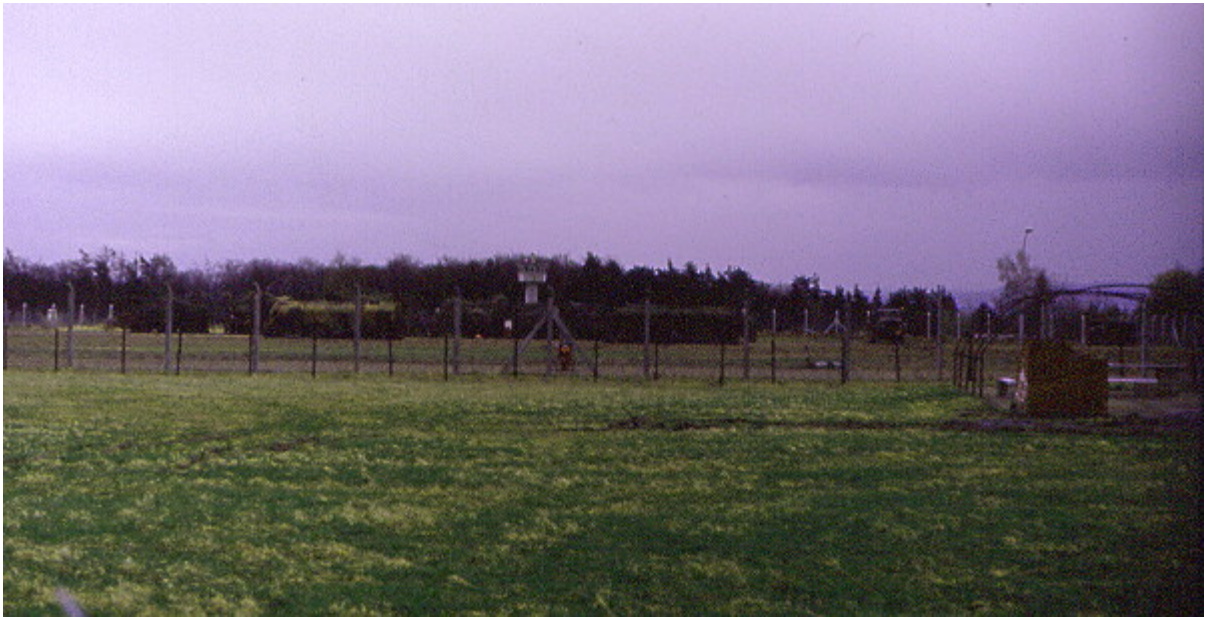
Mittlerer Teil der Waldheide- weiter rechts (südlich) passierte das Unglück im Bereich des "Montage- und Übungsbereiches"

Einer der damals sehr jungen GIs erzählte, dass die US-Army nach dem Unglück ihm die Aufgabe übertrug die Identifikation der einzelnen Leichenteile der bei der explosionsartigen Verpuffung zerrissenen Körper zu organisieren. Auf den Umstand, dass einer der Toten sein Freund war wurde dabei keine Rücksicht genommen. Relativ unsensibel war auch die Nachbetreuung der teilweise schwer traumatisierten Beteiligten. Diese fand praktisch nicht statt und auch nach der Entlassung aus dem Armeedienst haben einige der Beteiligten fast 20 Jahre nach dem Unfall diesen psychisch noch immer nicht verarbeitet.