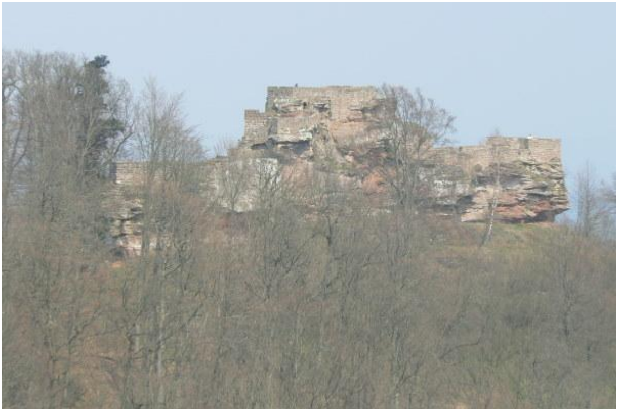
Burg von Süden gesehen

Alternativ kann der Zugang von Frankreich vom Parkplatz der Burg Fleckenstein über Burg Löwenstein und die Hohenburg erfolgen. Somit hätte man vier Burgen auf einen Streich erkundet.-Eine lohnenswerte Wanderung!