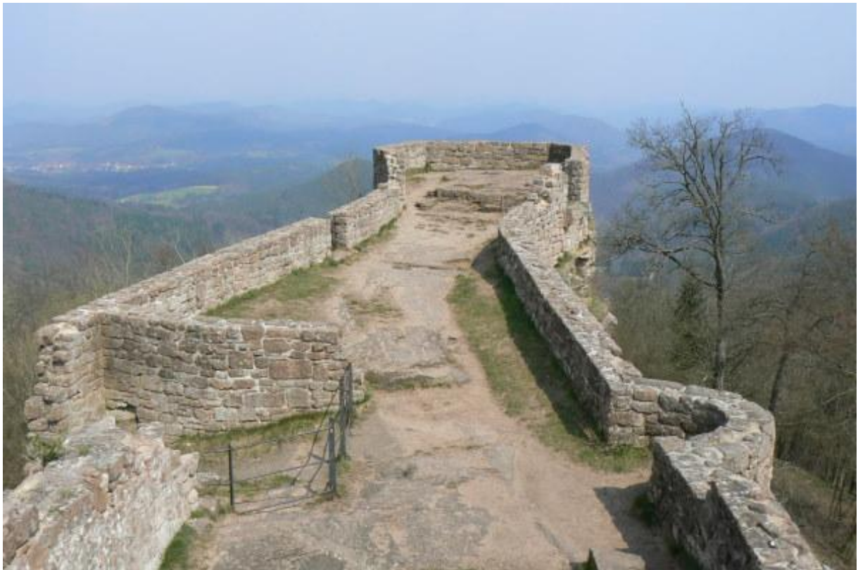
Nordostseite der Burg

Wie die Felsenburgen 3 Fleckenstein 4 , Wasigenstein 5 oder der Drachenfels 6 wurden auch hier die natürlichen Begebenheiten optimal genutzt und nicht nur der östliche Rand einer länglichen Bergkuppe bebaut, sondern auch der sich dort befindende Felsgrat als Fundament einer Burg verwendet. Von der gefährdeten Angriffsseite, der Südwestseite, erreicht man die wie ein Schiffsbug in den heutigen Wald ragende Burg. Auf der Nordseite unterhalb des Felsgrates befindet sich die Vorburg mit den Resten eines Torzingers. Durch mehrere Tore konnte die Burg betreten werden, welche früher komplett von einer Zwingermauer umgeben war.