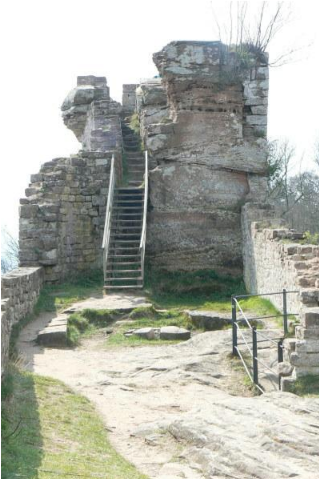
Oberburg von Nordosten gesehen

den Fels der Oberburg ein Gebäude angebaut. Reste einer weiteren Zisterne befinden sich an der „Bugspitze“ dieses steinernen Schiffes über dem Wald. Auch von dieser Seite führt eine Treppe in die Oberburg.