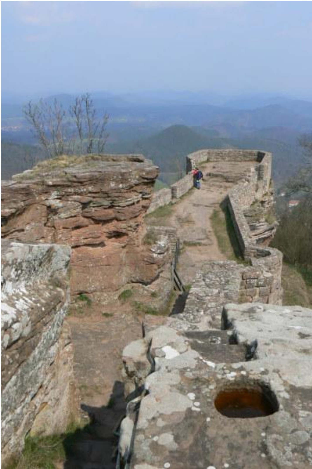
Blick von der Oberburg nach Nordosten in den deutschen Teil der Pfalz