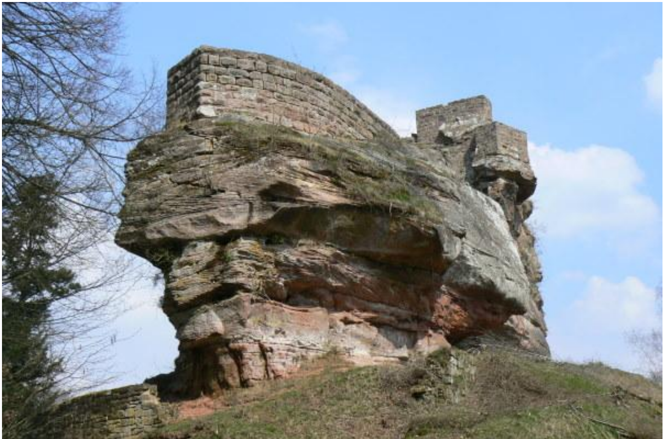
Wie der Bug eines steinernen Schiffes wirkt die Südwestspitze der Burg

Nur wenige hundert Meter nördlich der deutsch-französischen Grenze thront die Felsenburg 1 auf einer 572 Meter hohen, bewaldeten Bergkuppe und erhebt sich wie ein steinernes, gestrandetes Schiff –einer mittelalterlichen Arche Noah gleich- als höchste Burgruine der Pfalz. Früher, Jahrhunderte lang vom Blut deutscher und französischer Soldaten getränkt, ist die Grenze heute unsichtbar und macht die Burg zu einer europäischen Burg- von Frankreich und Deutschland barrierefrei zu erreichen!