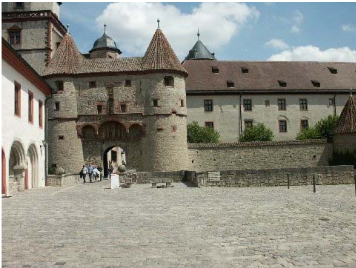
Scherenbergertor- Zugang zum Kernschloss

Unübersehbar überragt die mächtige Festung Marienberg die Stadt Würzburg und den Main und macht dem Namensteil „Burg“ in Würzburg alle Ehre. Einst keltische Befestigung, später Burg, dann Burgschloss, wurde die Anlage zur Festung ausgebaut und kann mit anderen süddeutschen Festungen wie der Wülzburg 1 , Plassenburg 2 , Hochburg 3 , Hohenneuffen 4 und Hohenasperg 5 verglichen werden.