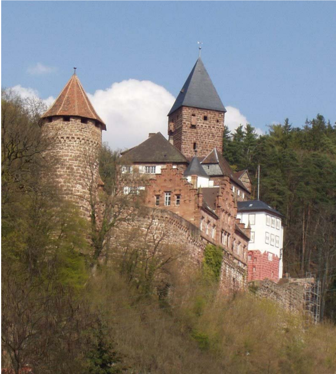
Schauseite von Westen