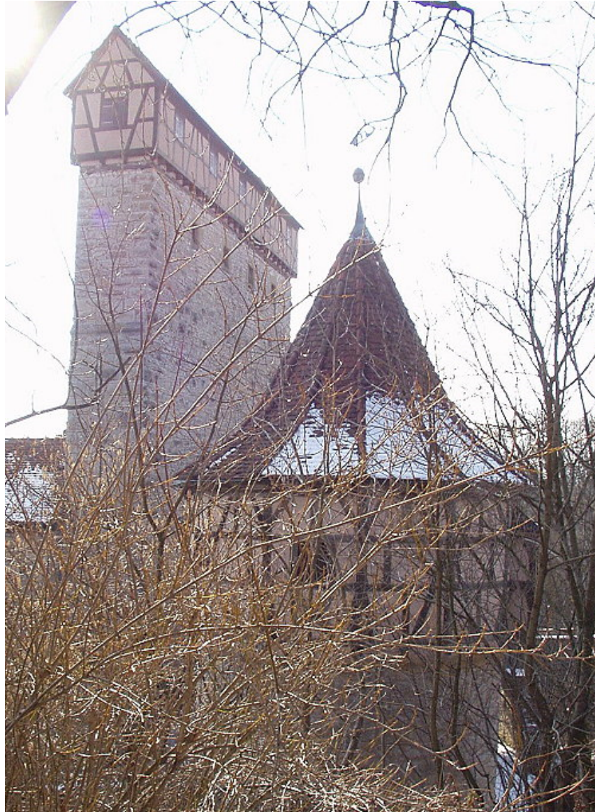
Nordostseite mit Eckturm am Zwinger