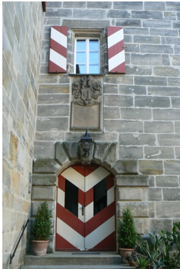
Zugang im Innenhof