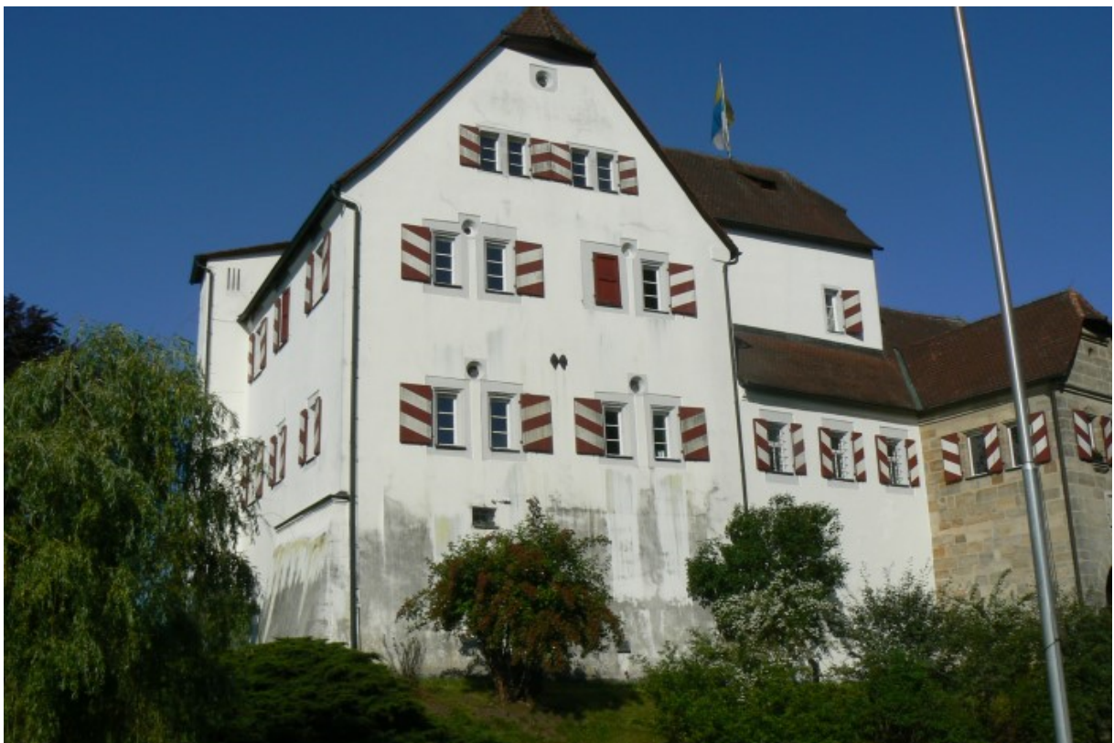
Blick von Osten

Eine typische Kleinadelsburg findet man im Tal der Pegnitz nördlich von Nürnberg. In sehr vielen ländlichen Orten finden wir diese Adelssitze, welche die Kulturlandschaft nicht nur wie hier in Franken, sondern auch in allen anderen Regionen Deutschlands prägten. Oft im Mittelalter politisch und strategisch völlig unbedeutend bereichern sie das heutige Ortsbild.