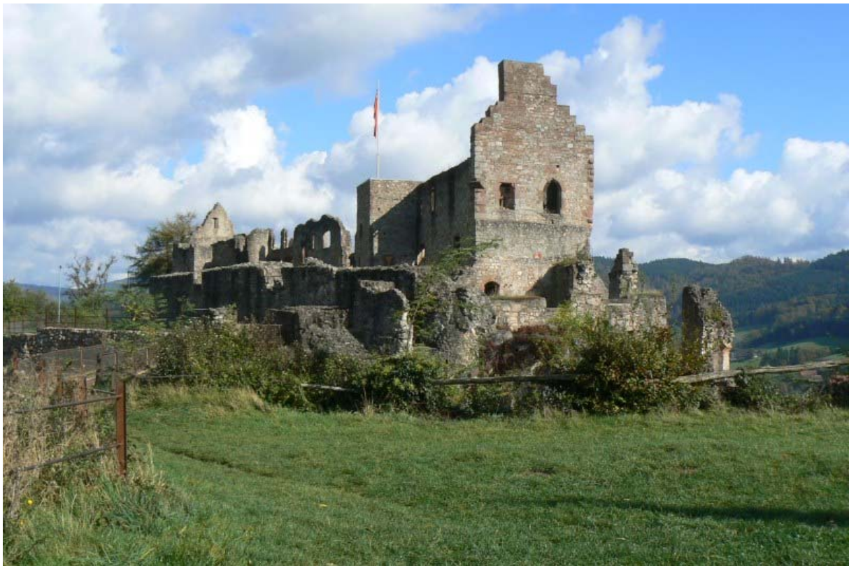
Blick vom südlichen Bollwerk auf die Kernburg

Der Kern der einst stärksten Burg der Region 6 , welche nach vollem Ausbau zur Festung in Baden nur vom Schloss Heidelberg 7 an Größe übertroffen wird, befindet sich auf der Felsterrasse.