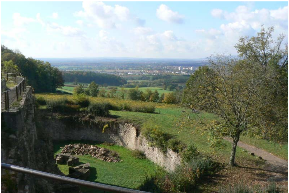
Bollwerk (links) mit vorgelagertem Graben, Reste des Rondells und Bastion. Blick nach Süden