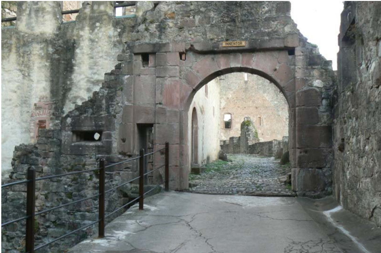
Inneres Tor mit Mannloch (links)

Wasserbehälter und das Innere Burgtor integriert wurden. Durch die Einführung der Artillerieschüsse wurden diese Ausbauten nötig. Die Kernburg wurde in insgesamt fünf Ausbaustufen erweitert. Ein Zwinger umgibt die Kernburg, welcher auf der Ostseite vom ruinösen Herbsthaus und der Burgvogtei begrenzt werden. Im Norden des Zwingers wurden mehrere Bauwerke (u.a. Langer Bau, Pfisterie) errichtet. Dort wird die Spitze der Anlage von einem Rondell flankiert. Auf der Westseite der Kernburg schützten ein Burggraben, eine mächtige Mauer und ein Vorwerk die Burg. Die südliche Seite wurde durch das Bollwerk, einen bastionären Flankierungsturm und einem nur noch in den Grundmauern erhaltenen Rondell geschützt. Auch hier zieht sich der gemauerte Burggraben um die Südseite. Das noch gut erhaltene Bastionärsystem aus sieben Bastionen (Bastion Baden, Hachberg, Rötheln, Sausenburg, Diana, Rudolph und Badenweiler 8 ) mit dem Eingang über das westliche Rothgattertor mit einstiger Zugbrücke ist auf Luftbildern beeindruckend. Die Bastionen sind heute noch als Erdformationen erhalten. Die Steine der Bastionen und Kurtinen 9 sind leider nicht mehr wie z.B bei der Wülzburg 10 erhalten.