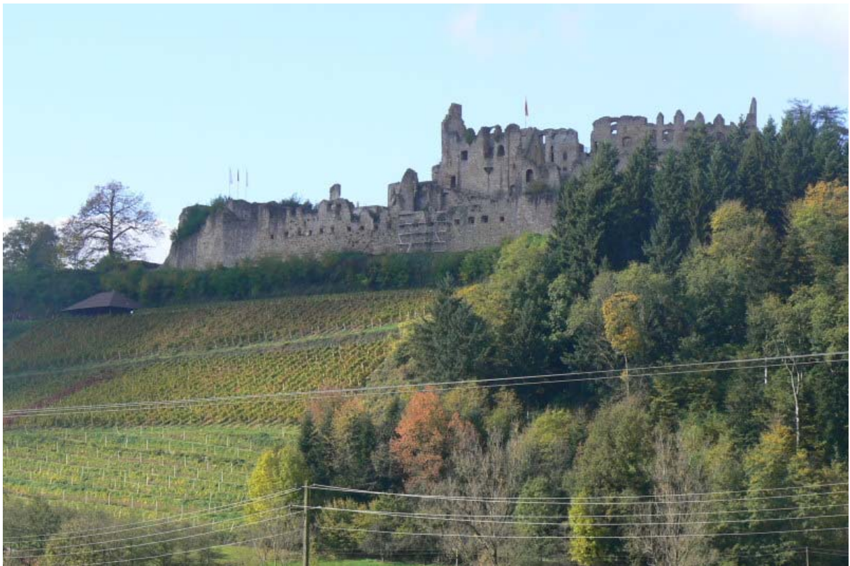
Festung von Osten

Von der Autobahn A5 Karlsruhe-Basel fährt man zur Hochburg, auch Hachburg genannt, über Emmendingen nach Osten in Richtung Windenreute. Ab hier ist die Ruine auf einem Bergrücken sichtbar. Die Straße führt Richtung Sexau über den Bergrücken 1 . Am Weiler Hochberg befindet sich ein Parkplatz, von dem man in 10 Minuten die leider schlecht ausgeschilderte Festung zu Fuß erreicht.