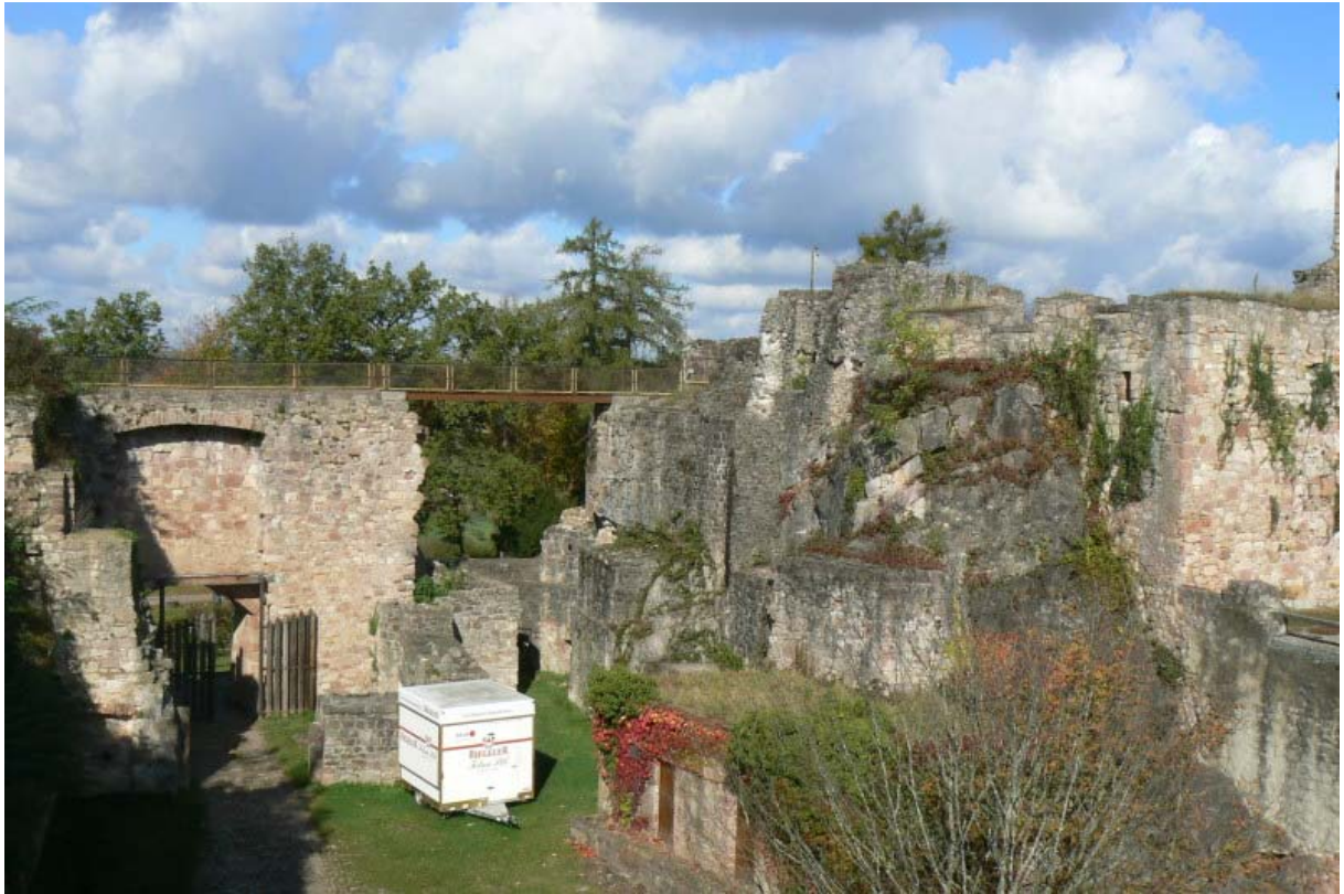
Unterer Burghof mit Gießhübeltor