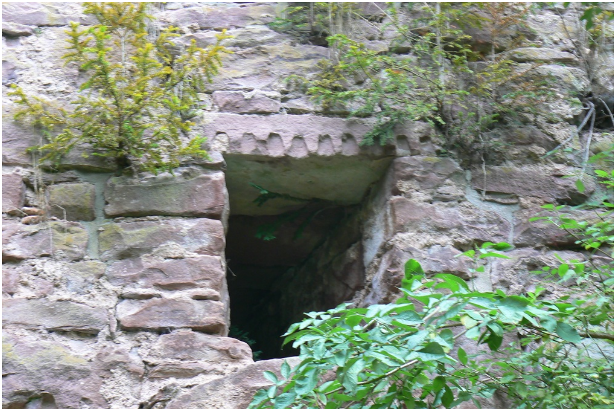
Innenseite einer verzierten Scharte in der Kernburg

In der Zwingermauer befinden sich auf der Halsgrabenseite 5 Schießscharten, 3 befinden sich auf der Südseite und noch 4 weitere auf der Westseite. Die Scharten sind größtenteils als hohe Bogenscharten d ausgeführt und schließen auf eine Bauzeit vor Einführung von Feuerwaffen. Die siebeneckige Kernburg, deren Ringmauer 2 Meter dick, ist betritt man auf der Südseite durch einen Rundbogen. Der Zugang wird von zwei Mauerstücken flankiert. Eventuell befand sich hier ein Torzwinger (Barbakane e ). Im heute ebenen, grasbewachsenen Hof soll einst ein großes Gebäude an der Ostseite am Bergfried gestanden sein. Heute ist nur ein Mauerzug vor dem Bergfried sichtbar. Sicher ist, dass ein Gebäude auch an der Nordostecke gestanden haben muss. Dort sind zwei große Fensterfronten in der Ringmauer der Kernburg integriert. Ebenso befindet sich ein Konsolstein eines Stockwerkes in der Mauerecke. 5 Bogenscharten befinden sich auf der Ost- und Nordseite der Ringmauer. Eine davon (auf der Ostseite) ist durch Ausbruch vergrößert. Die anderen Bogenscharten wurden von innen im unteren Bereich vermauert. Zwei der zur Hofseite wie ein Fenster ausgeführte Scharten sind oben im Gewände verziert.