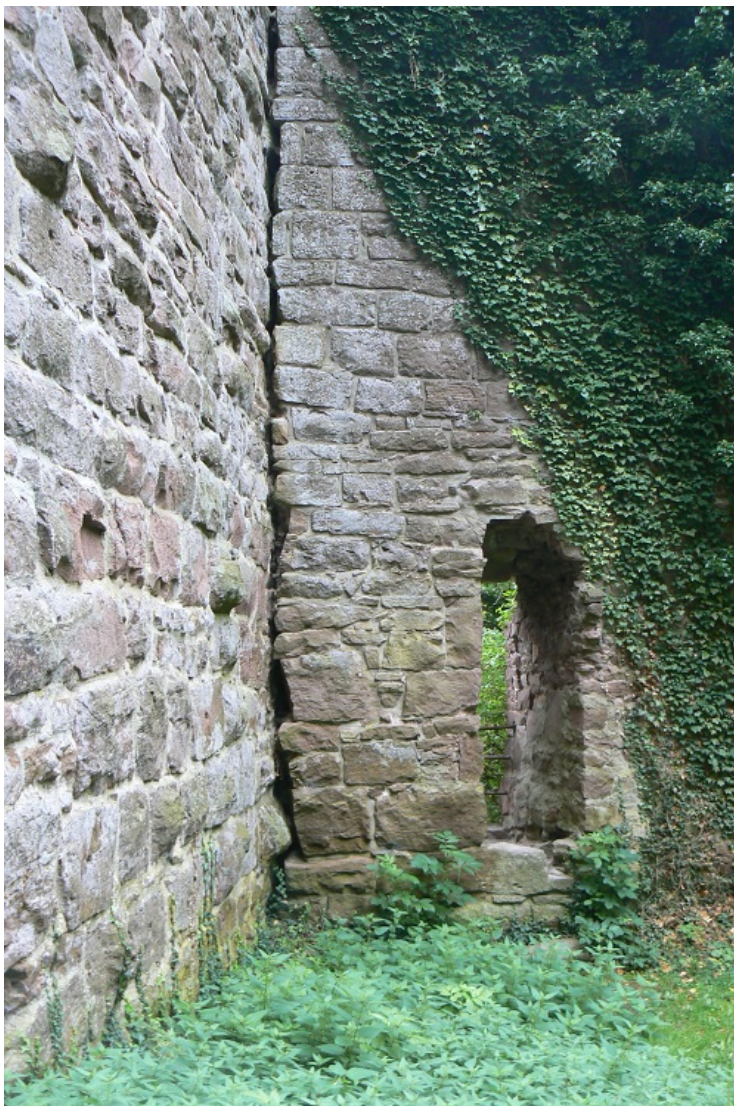
Außenmauer der Kernburg am Bergfried (links)

Der Bergfried selbst ist wie die gesamte Burg aus rötlichem Sandstein errichtet. Auffällig ist beim Bergfried die Ausführung mit unterschiedlich großen, schichtweise verlegten und hammerrechtem Mauerwerk. Etliche davon sind Buckelquader, teilweise mit kissenförmigen Bossen. Der rundbogige, gewölbte Eingang befindet sich auf der Kernburgseite in 19 Metern Höhe. Die Mauerstärke beträgt 2 Meter, auf der Ostseite sind es ca. 2,7 Meter. Sicher ist, dass die Bauzeit des Bergfriedes nicht dieselbe wie die der Kernburgringmauer ist. Die Übergänge zwischen Bergfried und Mauer zeigen eine Nut. Die Forscher sind sich noch nicht einig, ob vorher die Ringmauer-auf der Ostseite schildmauerartig erhöht –stand und der Bergfried später „eingebaut“ wurde, oder ob erst der Bergfried (mit einer zeitgleich erbauten Mauer auf der Ostseite) stand und die Ringmauer danach angebaut wurde. Sicher ist, dass der Zwinger (und eventuelle zwingerartige Vorburgenbauten auf der Westseite) späteren Baudatums sind.