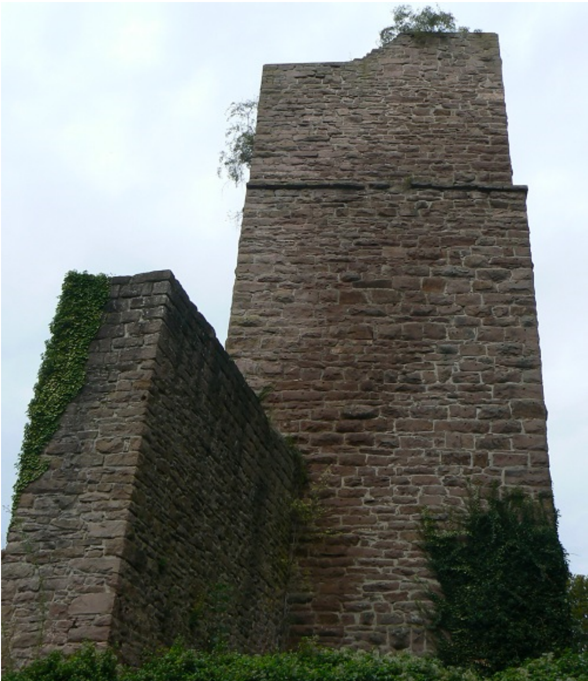
Südseite des Bergfriedes

Diese Friese finden wir an vielen anderen Bergfrieden. Teilweise wird dadurch eine spätere Erhöhung des Turmes angezeigt. In diesem Fall muss es sich, wie bei anderen Bergfrieden und Türmen staufischer Bauzeit, um ein optisches Element handeln. Wir finden solche Friese u.a. am Brunnenturm des Trifels gh , bei der süditalienischen Burg Castel del Monte i oder an dem Turm der Hinterburg der Burg Neipperg j bei Heilbronn. k