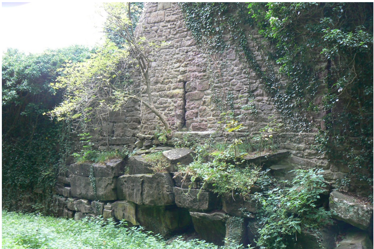
Zwingermauer auf der Halsgrabenseite

Der Weg führt unterhalb der Burg auf der West- und Südseite vorbei durch einen ehemaligen Zwinger auf die Ostseite. Hier wird das Burggelände von der Bergseite durch einen in den Felsen geschroteten Halsgraben abgetrennt. Heute teilweise zugeschüttet, verläuft hier nun ein breiter Waldweg. Der Zugang in den inneren Zwinger erfolgt hier auf der Nordostecke. Die ca. 1,2 Meter dicke Zwingermauer aus kleinen Steinquadern umgibt die gesamte Kernburg. Ein Abschnitt dieser Zwingermauer, direkt vor dem Bergfried zum Halsgraben auf dem Felsen errichtet, wird auf dieselbe Bauzeit wie der Bergfried datiert. An dieser Stelle wird der Zwinger durch eine an den Bergfried grenzende Quermauer unterbrochen. Daneben befindet sich an der Südostecke des Zwingers ein großer Fensterdurchbruch zum Halsgraben. Vermutlich ist dieser Durchbruch späteren, neuzeitlichen Baudatums, da dieser verteidigungstechnisch unsinnig gewesen wäre.