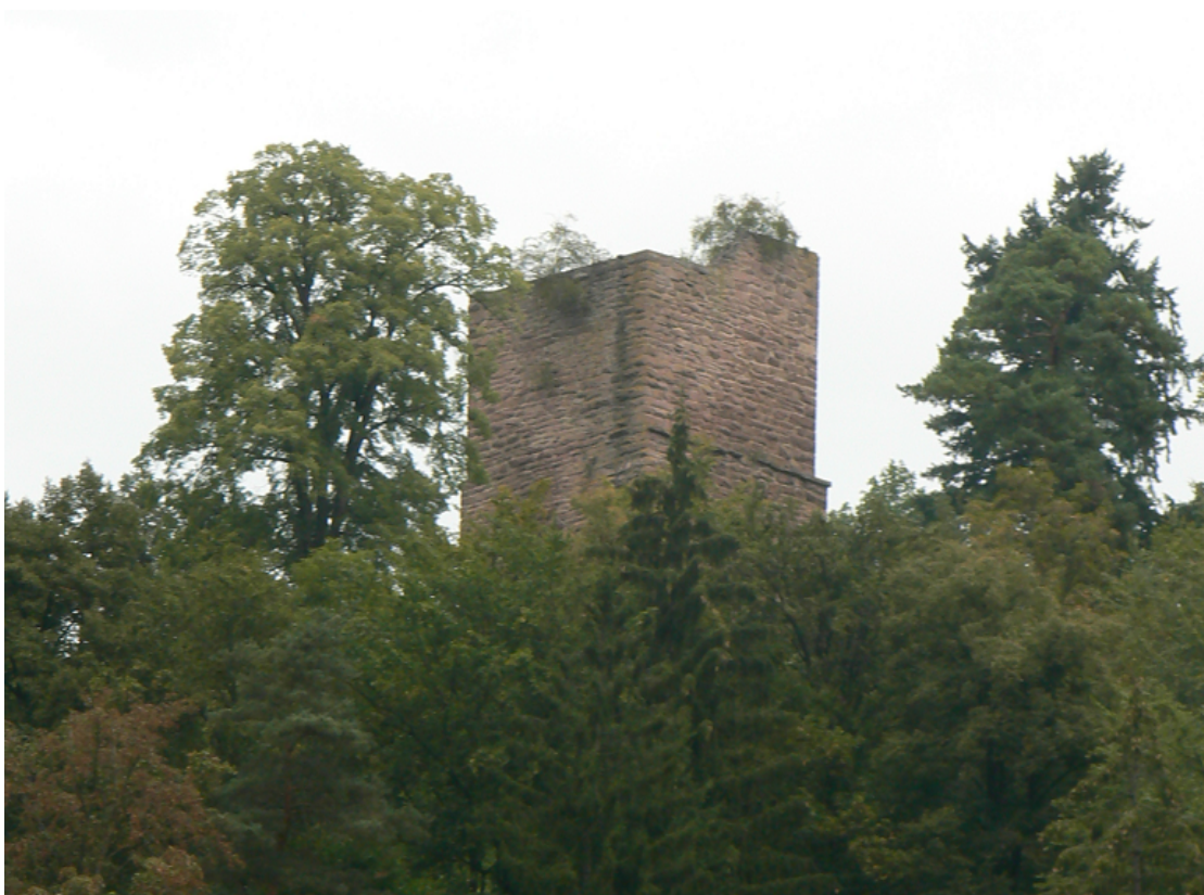
Blick von der anderen Talseite

Auf einem Bergsporn über dem Würmtal ragt der Bergfried der Ruine Liebeneck aus dem dichten Wald. Der Pforzheimer Ortsteil Würm befindet sich einige Kilometer weiter nördlich des Spornes. Das wildromantische Tal der Würm a windet sich durch eine so genannte „Blockwildnis“. Große Sandsteinbrocken liegen hier bizarr zwischen dichtem Mischwald. In der Nähe der Ruine wurde einst ein Eisen- und Schwerspatbergwerk betrieben. In den heute verschlossenen Gängen finden derzeit Fledermäuse Schutz.