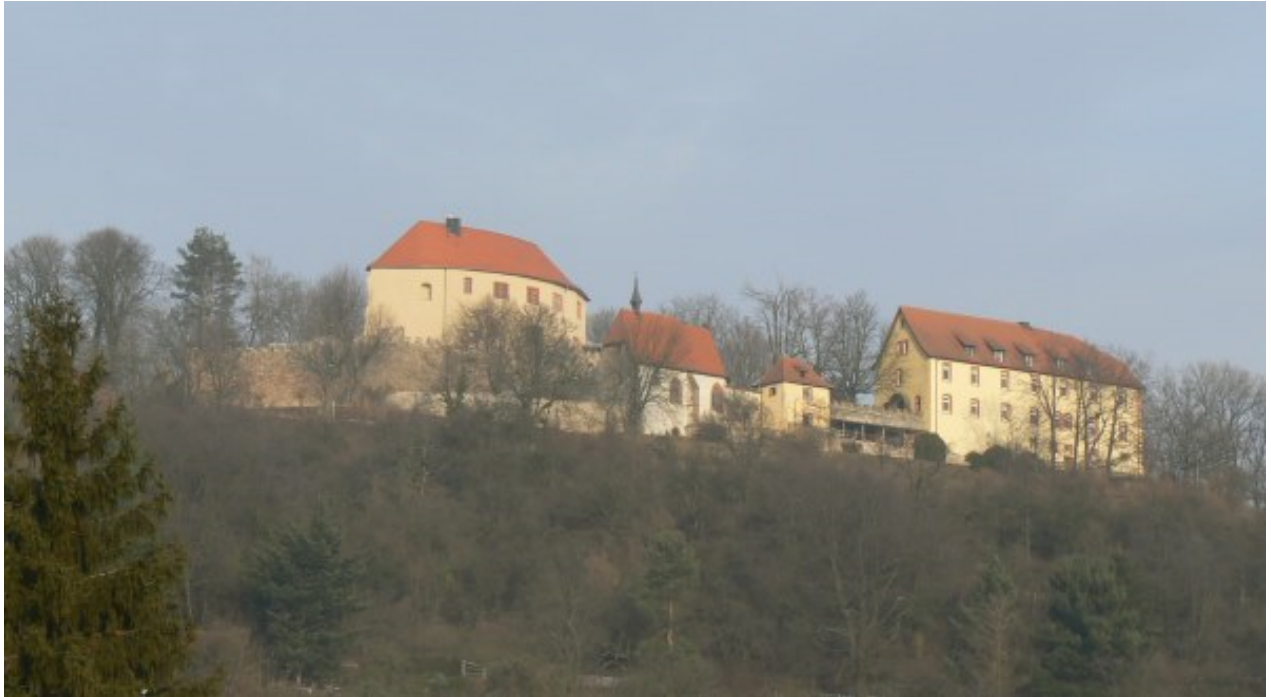
Schloss Reichenstein: links Kernburg, Mitte Kapelle in der Vorburg (rechts)