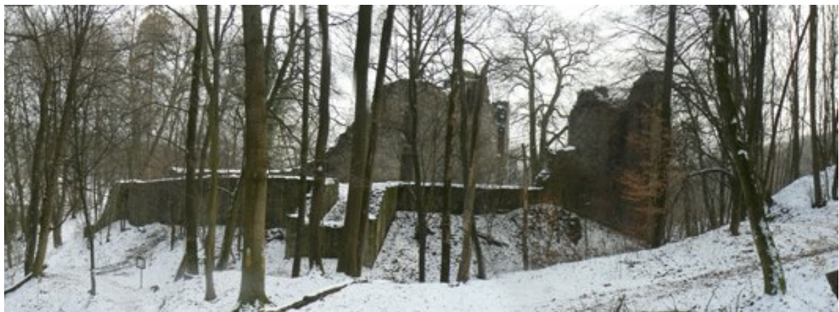
Brückenturm (Mitte) und Mühlenturm (rechts)

In einem nördlich von Reichelsheim gelegenen Seitental verstecken sich die düsteren Gemäuer der Ruine Rodenstein. Von hohen Bäumen beschattet, bietet die alte Burg einen wildromantischen Anblick. Fern der Zivilisation beginnt der Besucher von alten Zeiten zu träumen. Lage und Flair dieser Burg erinnern an die auch im Odenwald liegende Burg Wildenberg 1 . Die steinernen Turmreste und verwinkelten Mauerzähne regten seit Jahrhunderten die Phantasie der Menschen an, und viele Geschichten und Sagen ranken sich um die Burg. Im Mittelpunkt steht dabei der Ritter Rodenstein. Zu Lebzeiten ein schöner Kämpfer, treibt es den nun ruhelosen Geist des Ritters mit seiner Rotte spukend durch die Täler. Mal betrunken, mal aggressiv, taucht er in den umliegenden Orten auf und lehrt die Bauern das Fürchten.