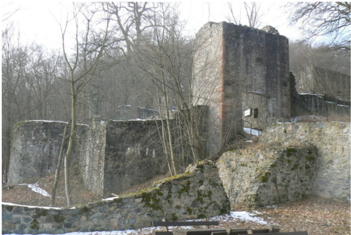
Blick vom Lindengärtlein auf den östlichen Torturm, links das Geschützrondell

Grundriss zeigt auch auf der Nordostseite einen Graben. An dieser Stelle erhebt sich vor der Burg ein Plateau, welches die Sicht zum tieferen Hang verhindert. Vermutlich wurde dieses Plateau erst später aufgeschüttet oder war mit einer heute nicht mehr vorhandenen Befestigung bebaut, welche auch durch den Graben von der Zwingermauer der Burg getrennt war. Der Besucher betritt die Burg vom ansteigenden Berg aus in Richtung des einstigen Burgweilers und heutigen Hofgutes. Vor dem Burgtor befindet sich linker Hand am Hang der Rest eines steinernen Vorwerkes („Lindengärtlein“ genannt). Der noch teilweise erhaltene wappengeschmückte Torturm (Mitte 14. Jahrhundert) führt in den südlichen Zwinger, welcher unterhalb der Kernburg liegt und als Vorburg verwendet wurde. Unterhalb der Vorburg befindet sich ein weiterer Zwinger mit Geschützrondell, welcher der jüngste Bauabschnitt (nach 1500) ist.