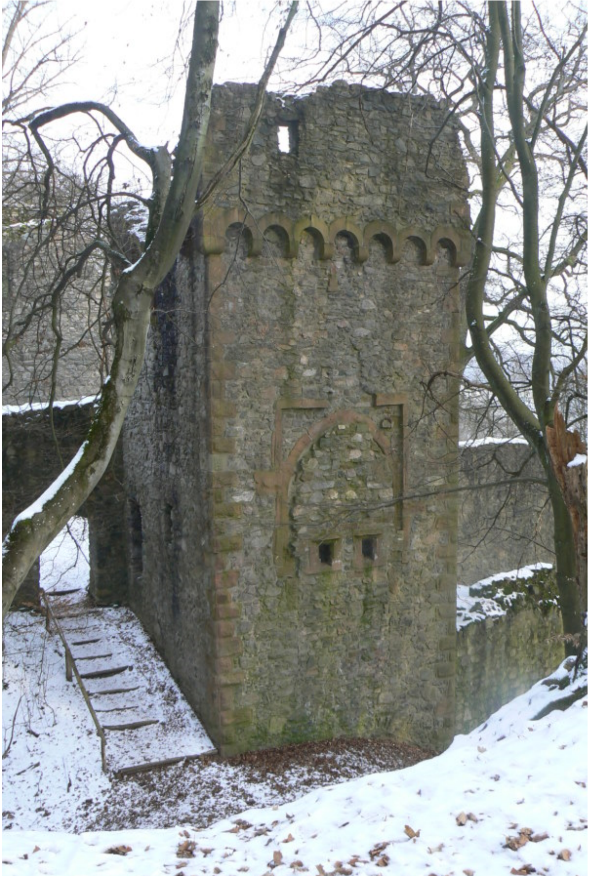
Mühlenturm mit vermauertem Tor