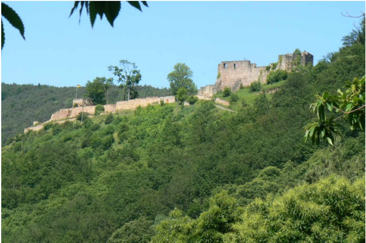
Wolfsburg von Osten

Nicht nur die automobilen Volkswagenstadt hat eine Wolfsburg, welcher sie ihren Namen verdankt. Auch hier am Rande des Pfälzer Waldes wurde auf einem nahezu ideal gelegenen Bergsporn die Wolfsburg erbaut, welche zwei Täler in die Pfalz überwacht und einen ungehinderten Zutritt verhinderte.