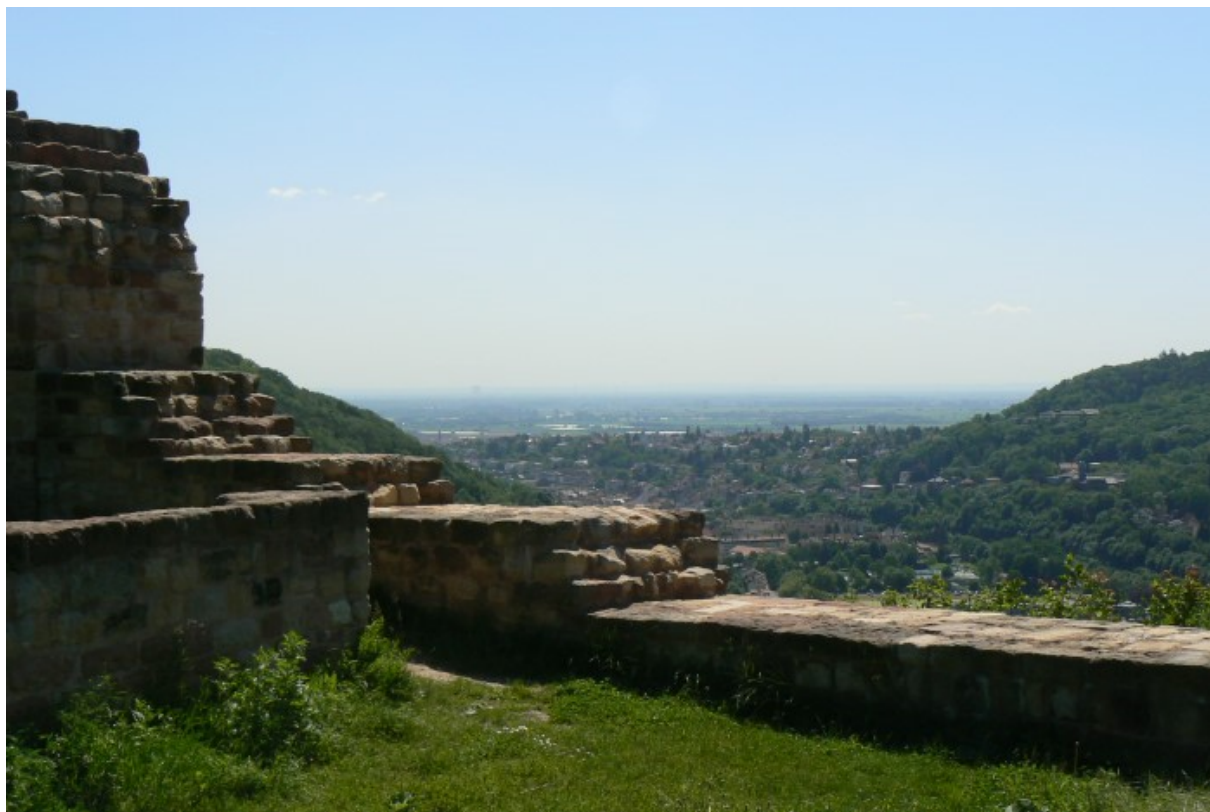
Blick ins östlich gelegene Rheintal