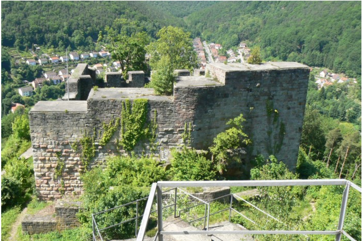
Schildmauer von der Bergseite gesehen

häufig im Süddeutschen Raum 2 (z.B. Burg Amlishagen 3 oder Burg Tierberg 4 im Hohenlohe)