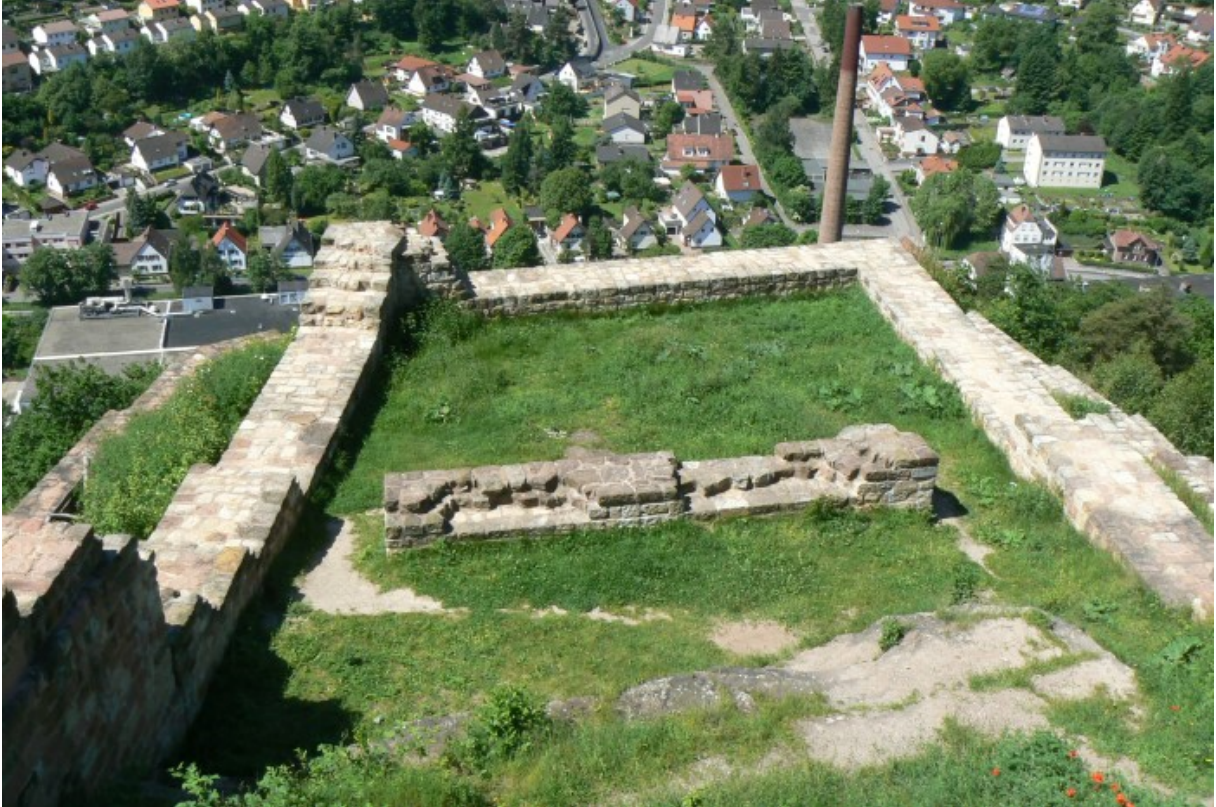
Südwestspitze der Burg